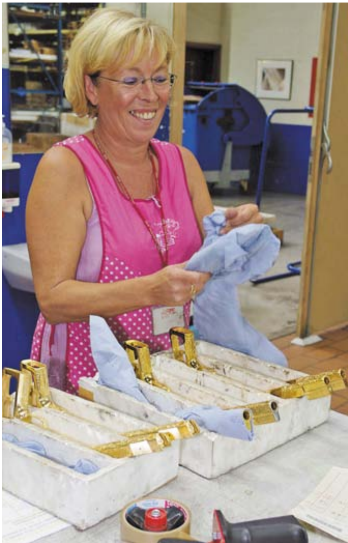
Сотрудница мастерской готовит к сборке золочённые пистолеты High Power - наверняка не для европейских заказчиков