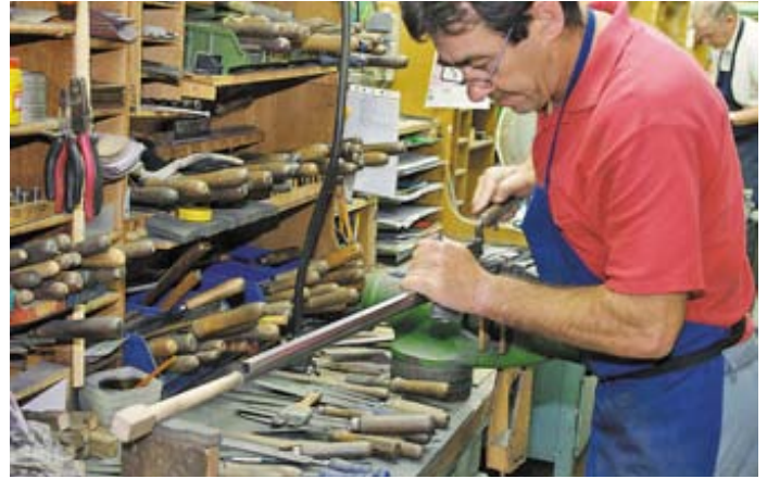
На фото слесарь готовит поверхность прицельной планки для нанесения рифления

понял, на легендарный полуавтомат в 12-ом калибре заказы не принимаются. С большим удовольствием и старанием в Херштале изготовят классический BAR II и украсят уникальной гравировкой боковые доски современного «Зенита», внутренняя конструкция которого полностью оптимизирована под машинное изготовление и предполагает минимальное вмешательство мастера кроме стандартных сборочных операций.