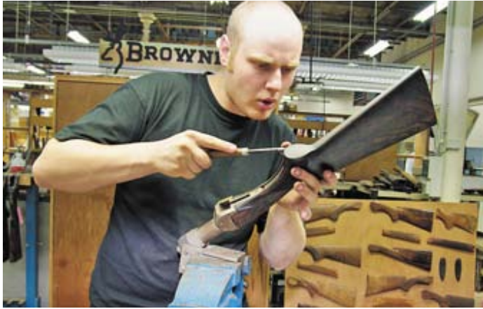
Шарнирное приспособление позволяет мгновенно фиксировать деталь в любом удобном для работы мастера положении