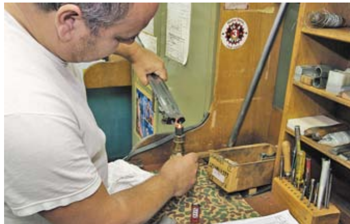
При подгонке деталей ружья настоящей ручной работы без старинного метода контроля качества сопряжения поверхностей по копти не обойтись

рабочие места слесарей-сборщиков, ложейников, резчиков, гравёров. Небольшое помещение отведено под выставочный зал, где заказчик имеет возможность познакомиться с модельным рядом предлагаемого оружия и вариантами отделки, которые ограничиваются исключительно фантазией и платежеспособностью заказчика. Однако, наблюдая за изделиями, находящимися в работе, я отметил отсутствие очень уж фантазийных образцов. Похоже, что клиенты мастерской, в большинстве своём, предпочитают классику в самом лучшем смысле и ценят изделие, прежде всего, за мастерство работников, чей ручной труд делает каждую из 2000 единиц оружия, выпускаемых за год, уникальной.