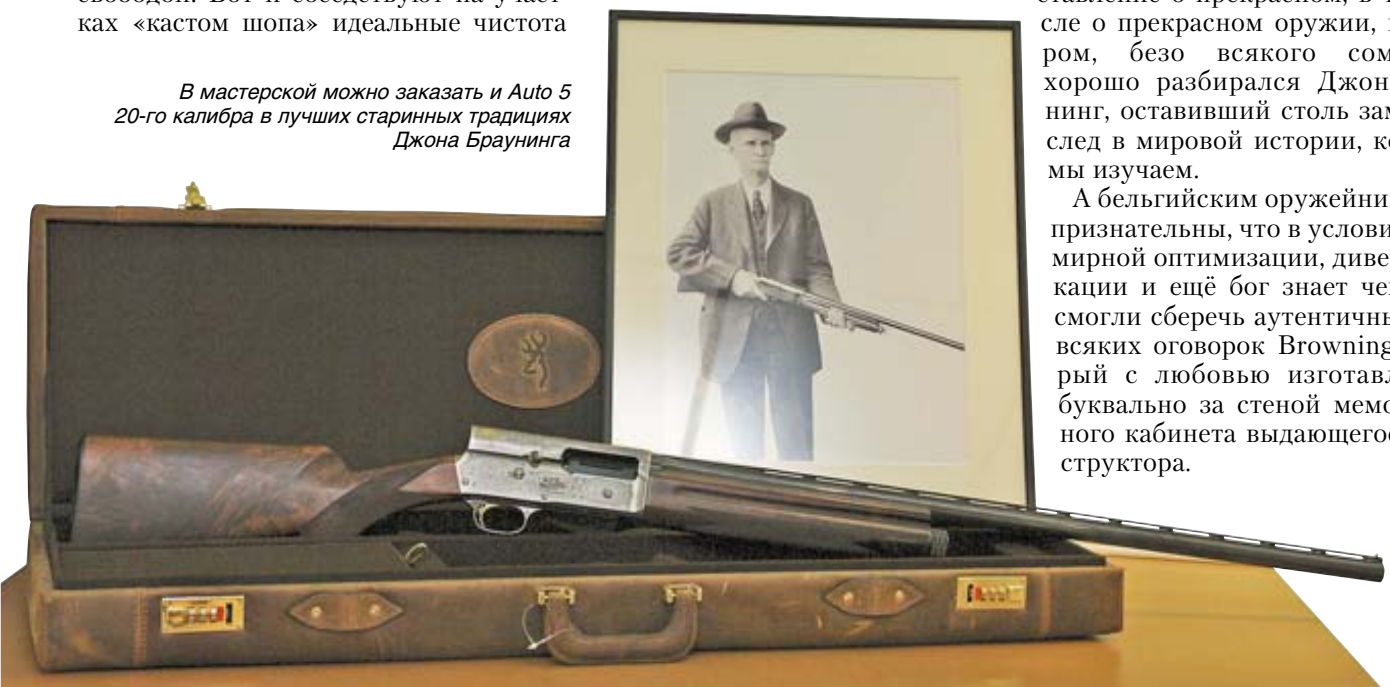
В мастерской можно заказать и Auto 5 20-го калибра в лучших старинных традициях Джона Браунинга

А бельгийским оружейникам мы признательны, что в условиях всемирной оптимизации, диверсификации и ещё бог знает чего, они смогли сберечь аутентичный безо всяких оговорок Browning, который с любовью изготавливают буквально за стеной мемориального кабинета выдающегося конструктора.