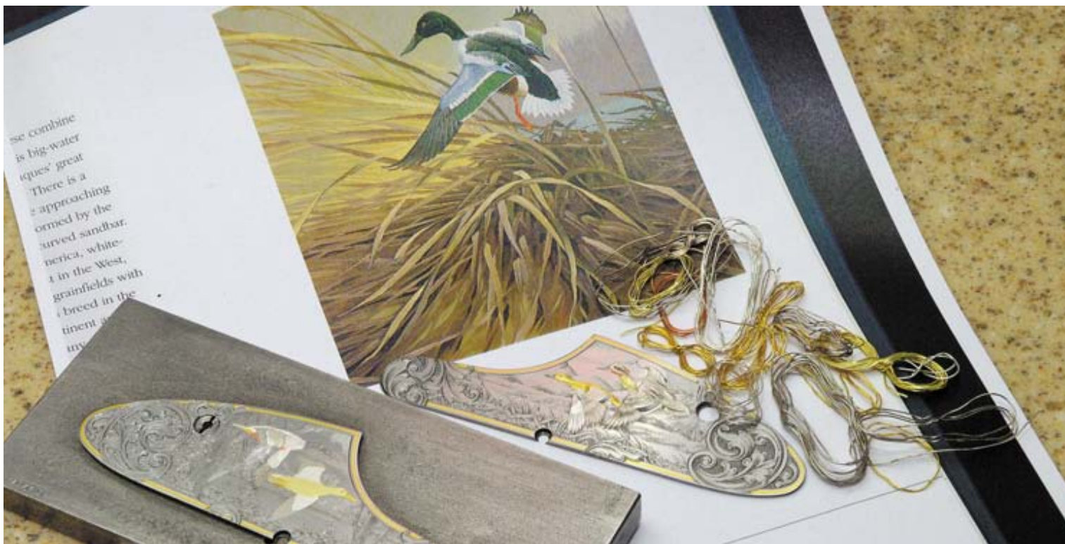
Для создания цветных художественных композиций на металлических частях оружия используется проволока из сплавов различных драгоценных металлов