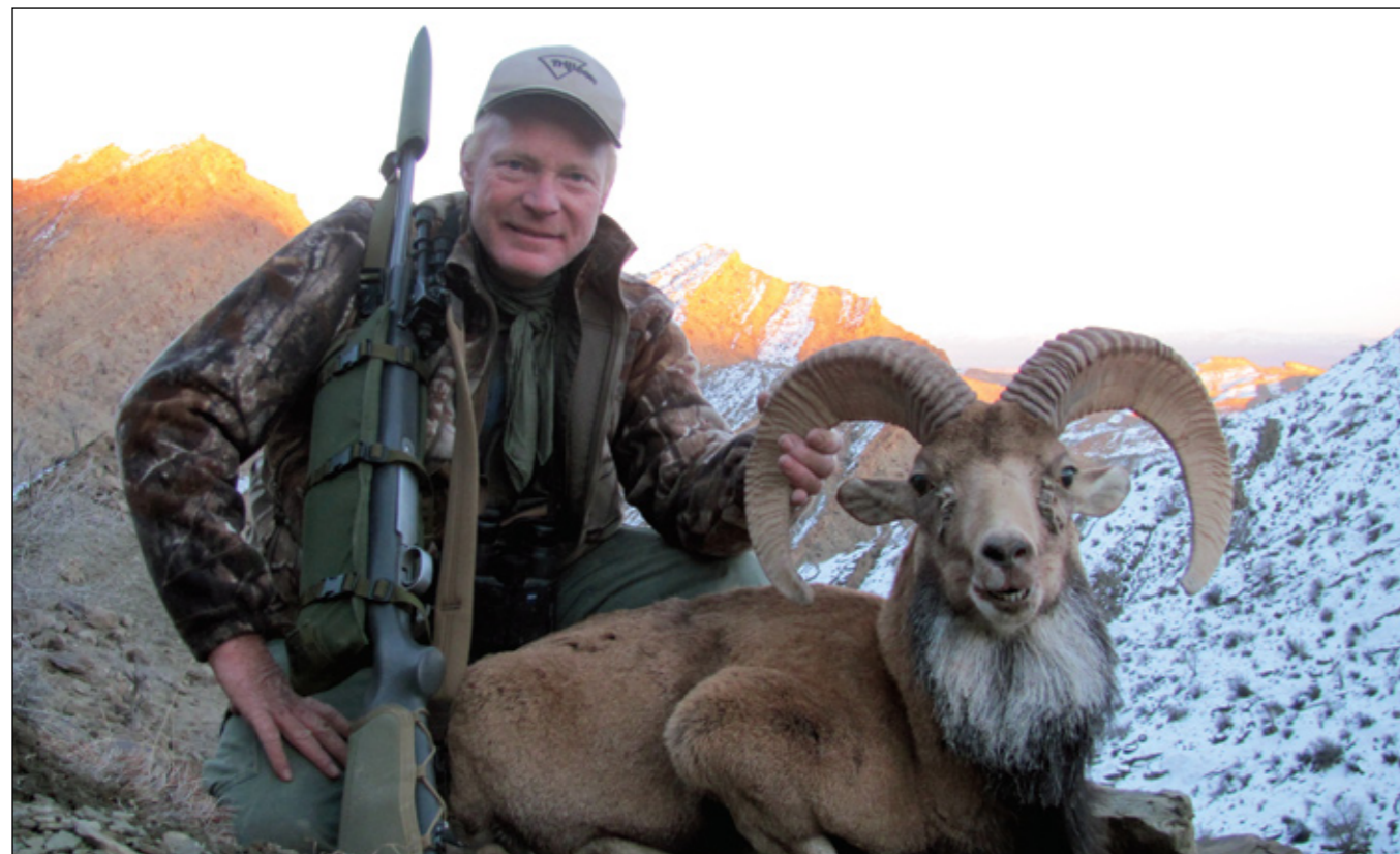
Великолепный экземпляр афганского уриала, взятый несколькими днями позже к западу от Кветы. Афганский уриал отличается особо шикарным «воротником», но его рога не настолько большие, как у менее крупных бланфордских уриалов.

Четыре другие вида – афганский, бланфордский, пенджабский и транскаспийский уриалы являются объектами охоты как в Пакистане, так и в Иране, имеют неплохие по численности популяции, обитающие на значительной части Центральной Азии.