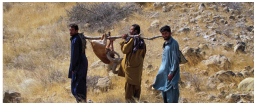
Уриал – небольшое и относительно простое для транспортировки животное, но во время традиционной охоты в Азии вам потребуются помощь.

Я охотился в Пакистане впервые, и моей главной целью был действительно большой бланфордский уриал. Кроме того, мне хотелось добыть синдхского айбекса, и, если дела пойдут хорошо, гималайского айбекса. Я добыл больших особей обоих видов горных козлов. Как я мог быть недоволен? Но уриал, как бы это сказать, в какой-то мере был уже мелочью. Хотя через оптику прицела на дистанции 270 м он выглядел отлично. Ожидая команды, я не мог видеть представления, что разыгралось у меня за спиной: помощник руководителя охоты, выкрутив барабанчик поправок на моём пристрелянном прицеле, приказал переводчику держать рот на замке. Вероятно, он очень торопился домой.