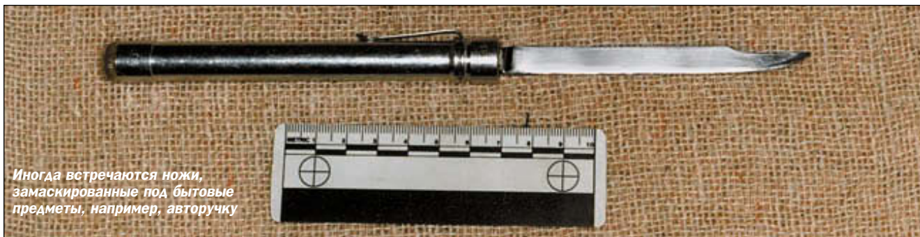
Иногда встречаются ножи, замаскированные под бытовые предметы, например, авторучку

«Заточка» – как уже было сказано, самый примитивный пример холодного оружия российского криминального фольклора. По большей части она применялась в экстремальных случаях, как последний аргумент «политической внутрикамерной борьбы», когда по решению «старших товарищей» приводился в исполнение приговор или вашей (упаси Господь) жизни или чести угрожала реальная опасность. Незначительная длина и традиционное отсутствие рукоятки сводило использование «пиковины» к множе-