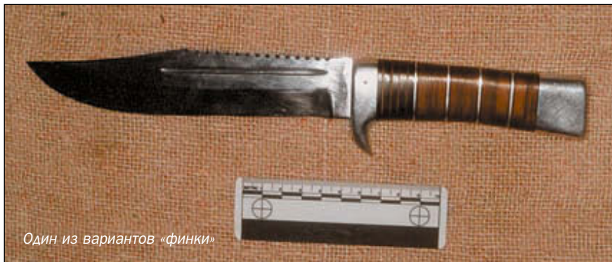
Один из вариантов «финки»

Не стал бы категорически отождествлять нашу криминальную технику с испанской, но левосторонняя стойка с выставленной (пассивно