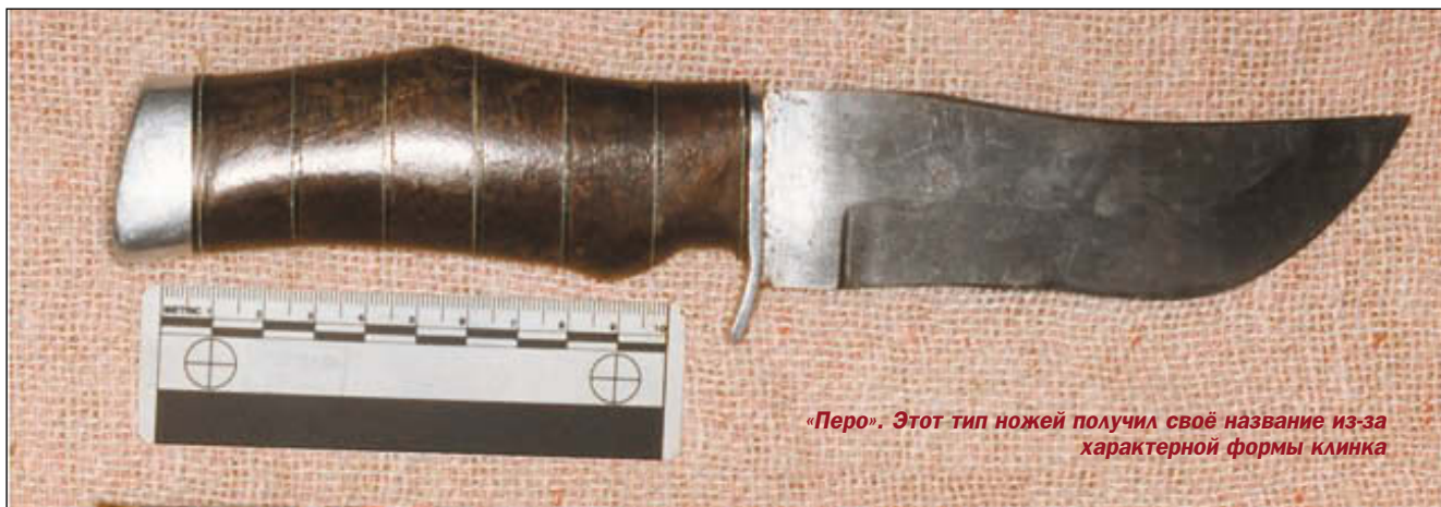
«Перо». Этот тип ножей получил своё название из-за характерной формы клинка

По тактике применения можно констатировать, что она сводилась к фланговым (дугообразным) движениям, ложным выпадам в вводной части боя и плотному захвату левой рукой в основной, сразу после захвата наносилось максимальное количество мощных ударов в корпус, количеством и направлением напрямую связанным с опытом «исполнителя». Соответственно чем больше и качественнее опыт, тем меньше количество и значительнее поражение. Всё же следует заметить, что предпочтение отдавалось коло-