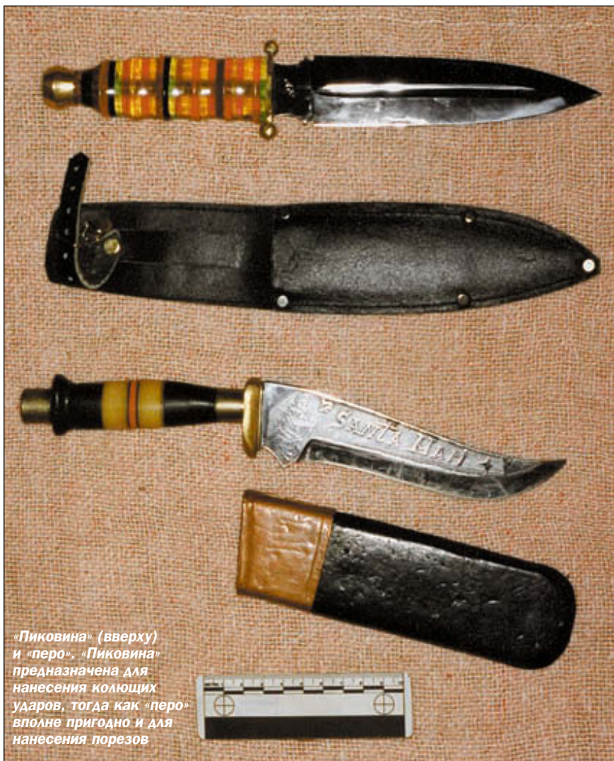
«Пиковина» (вверху) и «перо». «Пиковина» предназначена для нанесения колющих ударов, тогда как «перо» вполне пригодно и для нанесения порезов

тym ударам, так как изготовление ножа из подручных материалов – клапана ДВС, рессоры и пилы, не подразумевало выдающихся качеств режущей кромки, а для проникающих свойств клинка это не играет решающей роли.