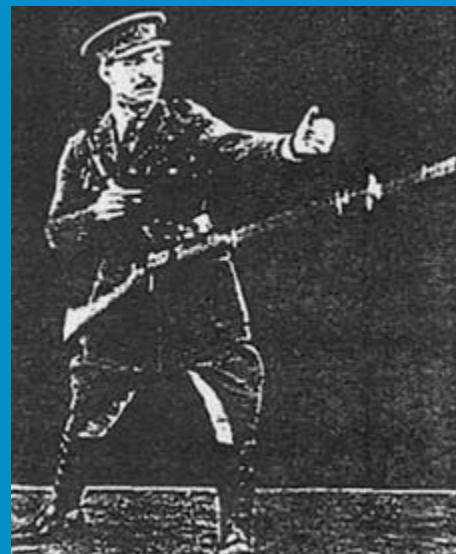
Майор Ноббс демонстрирует синтез бокса и штыкового фехтования