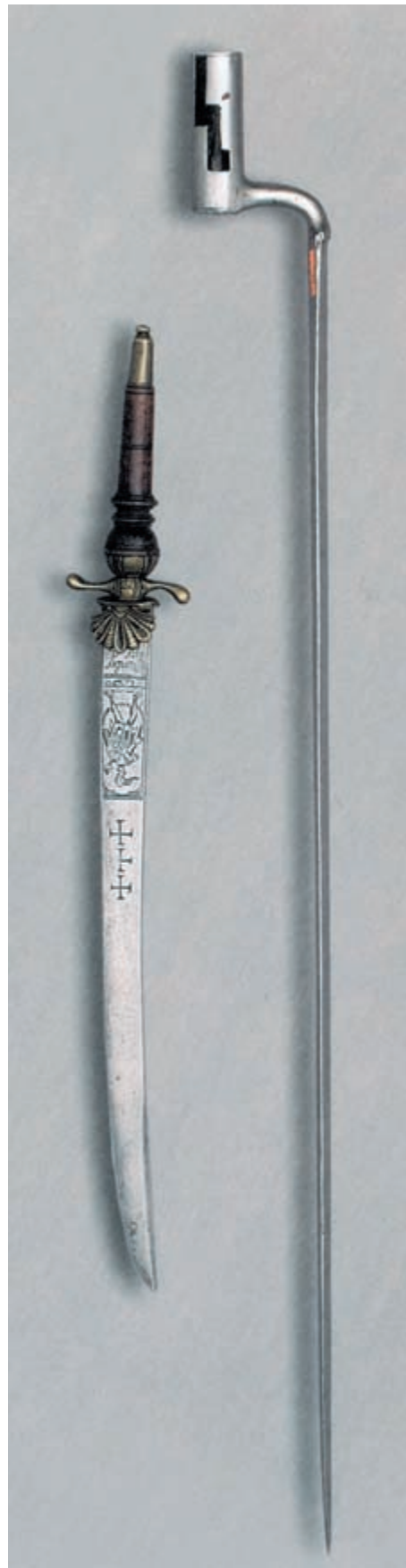
Охотничий багинет (слева) и штык