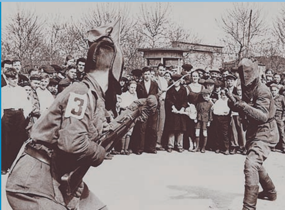
Соревнования по штыковому бою в СССР. 1943 год