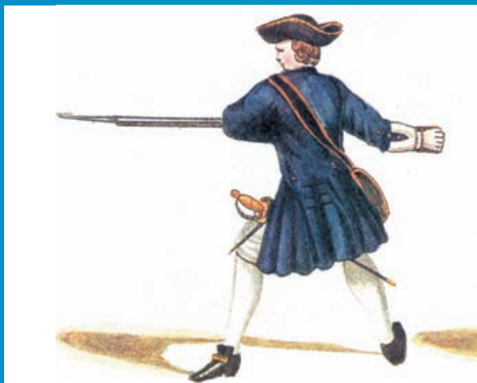
Наследие техники пики – «бронепробивное» удержание