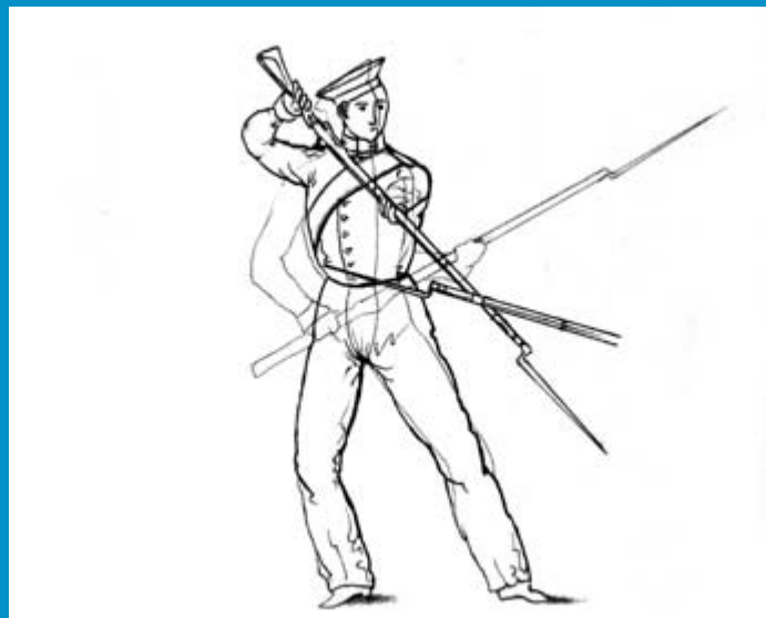
Техника защиты по учебнику Соколова. 1843 год