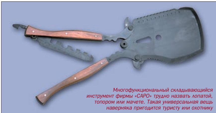
Многофункциональный складывающийся инструмент фирмы «САРО» трудно назвать лопатой, топором или мачете. Такая универсальная вещь наверняка пригодится туристу или охотнику

Знатокам ножей многое говорит марка Opinel («Опинель»). Более ста лет назад во Франции увидел свет первый нож, имеющий все характерные признаки современного «Опинеля». Лаконичность и красота внешней формы вместе с революционным по тем временам фиксатором клинка дошли до нас без изменений. В 2001 году фирма «Опинель» впервые обратила внимание на развивающийся российский рынок, и ножи начали появляться в магазинах, в 2002 году можно ждать появления в нашей стране всего модельного ряда