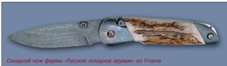
Складной нож фирмы «Русское холодное оружие» из Углича