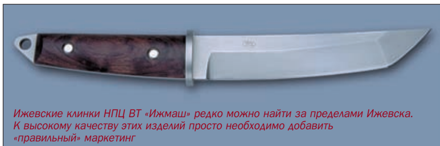
Ижевские клинки НПЦ ВТ «Ижмаш» редко можно найти за пределами Ижевска. К высокому качеству этих изделий просто необходимо добавить «правильный» маркетинг