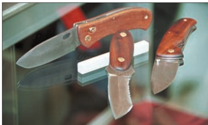
ЧП «Шокуров» на выставке впервые показало небольшой универсальный нож (на снимке в центре), форма которого заслужила пристальное внимание многих посетителей выставки

П оявились торговые марки, способные конкурировать с иностранными брэндами по всем статьям. Такие фирмы, как «НОКС», «Кизляр», «Южный крест», «АиР», «САРО», «Харалуг», «Медтех», «Союзспецоснащение» и другие, представляют собой полноценные развивающиеся производственные предприятия, руководство которых за сиюминутными проблемами не забывает думать о перспективах. И в планах большинства из них выход на внешний рынок. Тем более, что первый опыт фирм «НОКС», «АиР» и «Кизляр» на выставке IWA 2001, полностью удался, доказав заинтересованность иностранных любителей холодного оружия в русских изделиях.