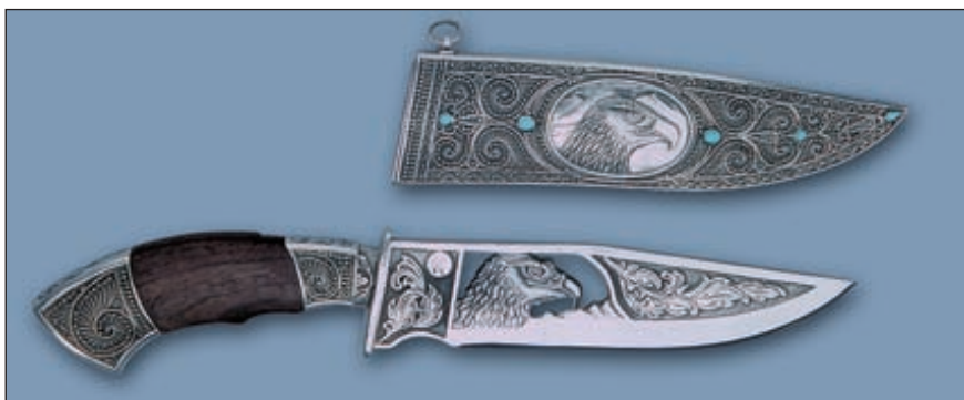
Оставаясь в границах своего индивидуального и узнаваемого стиля, предприятие «Кизляр» вводит в дизайн своих изделий всё новые элементы. Например, декоративную сквозную просечку клинка