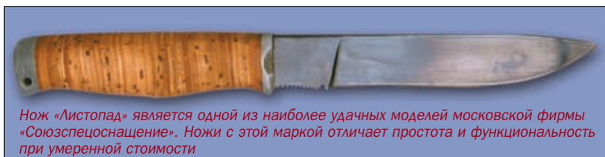
Нож «Листопад» является одной из наиболее удачных моделей московской фирмы «Союзспецоснащение». Ножи с этой маркой отличает простота и функциональность при умеренной стоимости

Целую витрину на стенде «Южного креста» занимали ножи, которые по действующим в России нормам, относятся к охотничьим. При этом многие знатоки разглядели в них черты, присущие боевым ножам известных зарубежных фирм. При этом стоят ножи «Южного креста» в несколько раз дешевле своих иностранных собратьев