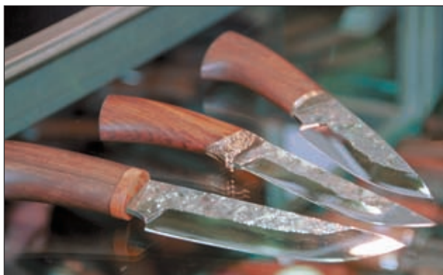
Блеснули оригинальным оформлением целой серии ножей мастера нижегородской фирмы «Гефест-НП». Поверхность их клинков имеет своеобразную обработку, похожую то ли на камень, то ли на грубую поковку