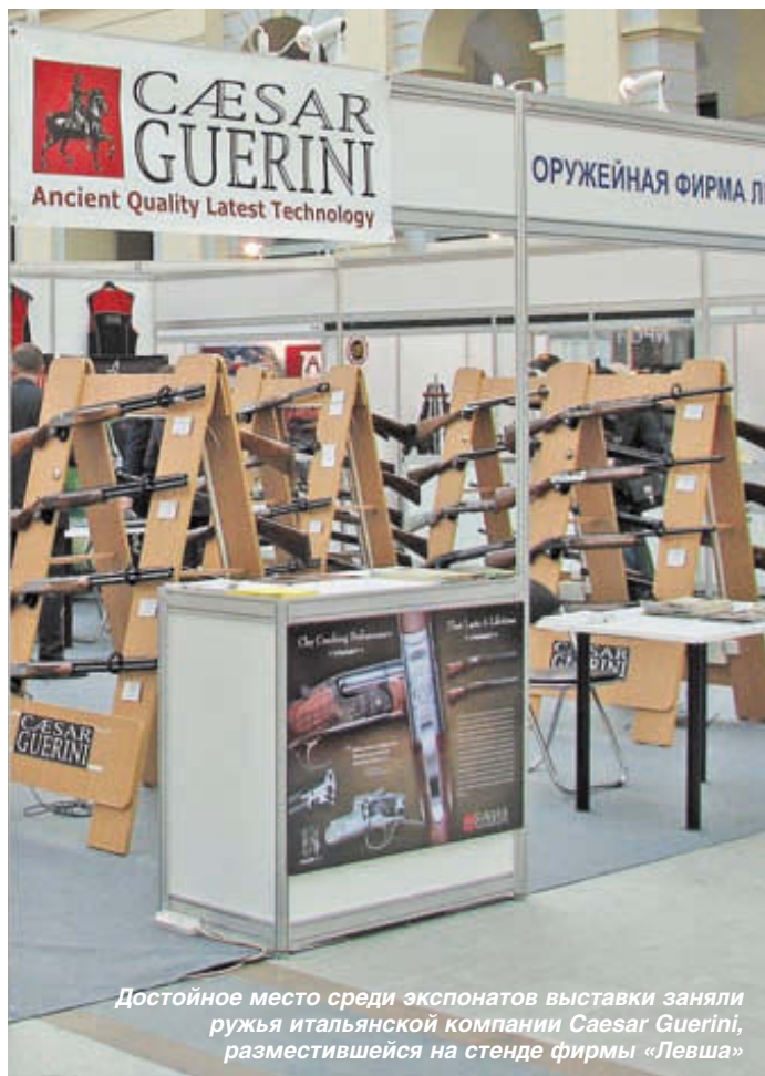
Достойное место среди экспонатов выставки заняли ружья итальянской компании Caesar Guerini, размещившейся на стенде фирмы «Левша»

В мире оружия новинок действительно было мало, но опять же – что считать «истинной», а что «относительной» новинкой? На стендах петербургской компании «Левша», например, красовались шикарно оформленная