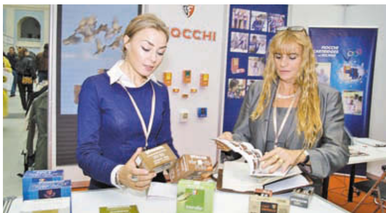
Патроны Focchi становятся одной из обычных марок на российском оружейном рынке. Богатый выставочный ассортимент – достойное тому подтверждение