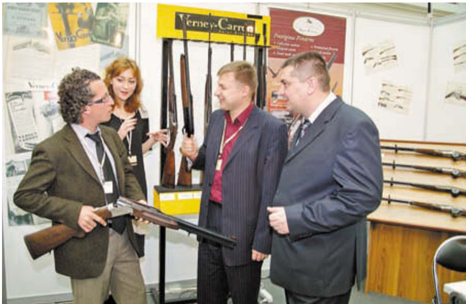
В очередной раз у нас есть основания говорить о перспективах фирмы Verney-Carron в России. У них, вместе с партнёром («Русак-Р») – самые серьёзные намерения

Внимание многих специалистов и любителей стрельбы привлёк выставочный стенд ФКП «Казанский государственный казённый пороховой завод», где наряду с классическими порохами класса «Сунар», красовались ёмкости с новыми охотничьими и спортивными порохами класса «Ирбис». Мне представляется, что многим нашим охотникам и стрелкам и вовсе недостаточно