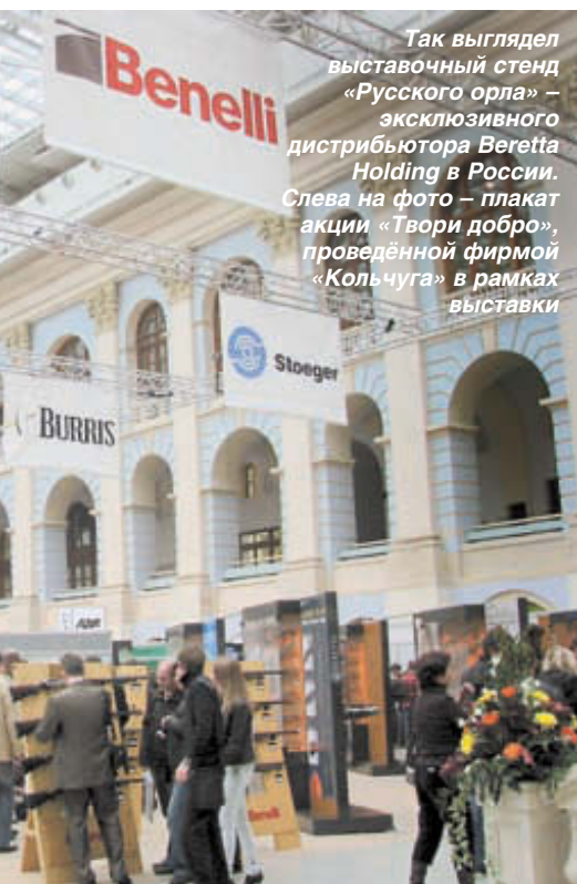
Так выглядел выставочный стенд «Русского орла» – эксклюзивного дистрибьютора Beretta Holding в России. Слева на фото – плакат акции «Твори добро», проведённой фирмой «Кольчуга» в рамках выставки