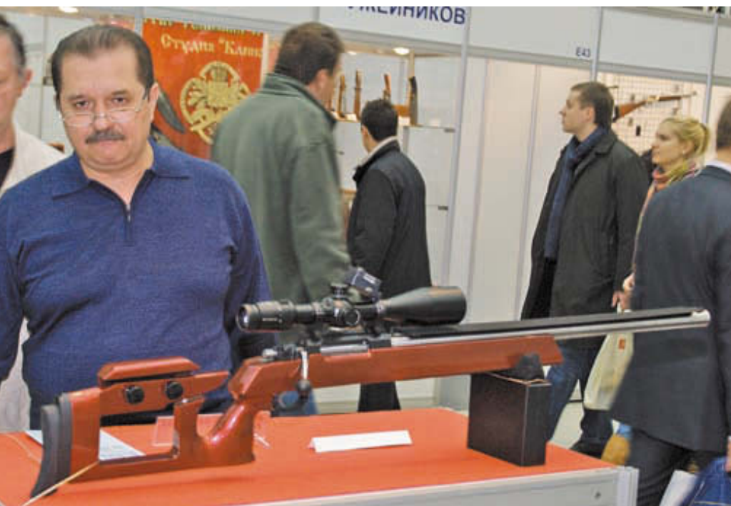
Немецкий оружейник Готфрид Прехтль знаменит своими высокоточными винтовками и охотничьими карабинами (на фото не Г. Прехтль, а посетитель стенда)

Новым, хотя и будучи давно известным и когда-то единственным, смотрится патрон «Патронного завода «Феттер» из категории «ретро». Снаряженный в папковую гильзу с войлочным пыжом, без пластикового контейнера, этот патрон нашей юности, а также зрелых лет, обеспечивает стабильные баллистические характеристики при морозной погоде. Резкость его боя вполне достаточна на всём протяжении нормальных дистанций охотничьей