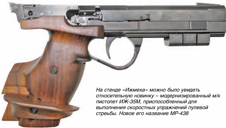
На стенде «Ижмеха» можно было увидеть относительно новинку – модернизированный м/к пистолет ИЖ-35М, приспособленный для выполнения скоростных упражнений пулевой стрельбы. Новое его название MP-438