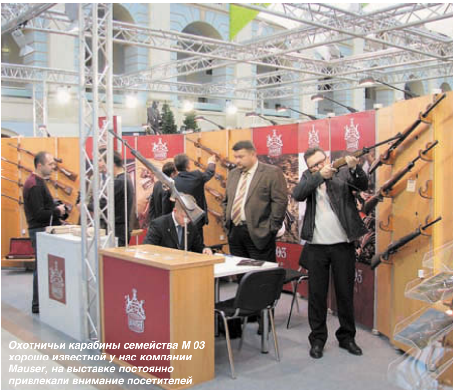
Охотничьи карабины семейства М 03 хорошо известной у нас компании Mauser, на выставке постоянно привлекали внимание посетителей

Выставленные новые пороха «Ирбис 24» и «Ирбис 24М» – это одноосновный и двухосновный спортивные пороха с высокой скоростью горения. Они предназначены для снаряжения спортивных дробовых патронов для выполнения упражнений классической стендовой стрельбы, с массой дроби 24 г и патронов с 28 г дроби для спортинга. По заявлению изготовителя патроны обеспечивают мягкую, плавную отдачу, чистое горение, негромкий звук выстрела. Для снаряжения охотничьих патронов предлагаются новые пороха «Ирбис 32» и «32М», а также универсальные «Ирбис 35» и «35М» – для применения в дробовых патронах 12, 16 и 20 калибров, как с отечественными капсюлями КВ-22, КВ-209, КВ-21, так и с КВ европейского стандарта. Пороха, марка которых обозначена буквой «М», имеют улучшенные характеристики при сниженных на 10-15 % массах зарядов, повышены полнота сгорания и величина начальной скорости при отрицательных температурах, за счёт ввода гидрофобной добавки уменьшена гигроскопичность пороха