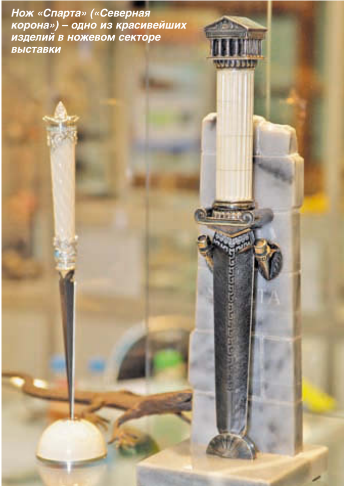
Нож «Спарта» («Северная корона») – одно из красивейших изделий в ножевом секторе выставки

хорошо известно, как об этом старейшем в России (основан в 1788 г.) пороховом заводе, так и о его продукции. Пироксилиновые пороха Казанского завода применяются в зарядах для боеприпасов не только ручного огнестрельного оружия, но и для малокалиберной артиллерии, танковых и авиационных пушек, полевой и морской тяжёлой артиллерии, а также средств ближнего боя. Всего же по технической документации, разработанной на заводе совместно с Казанским научно-исследовательским институтом химических продуктов, в настоящее время выпускается более 15 марок одноосновных и двухосновных порохов для дробовых и пулевых патронов к гладкоствольным ружьям и более 7 марок к нарезному охотничьему, спортивному и служебному оружию.