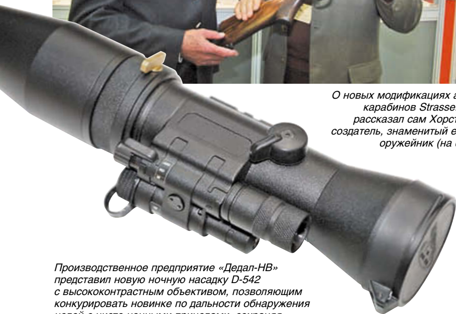
Производственное предприятие «Дедал-НВ» представил новую ночную насадку D-542 с высококонтрастным объективом, позволяющим конкурировать новинке по дальности обнаружения целей с чисто ночными прицелами, сохраняя возможности штатного дневного прицела