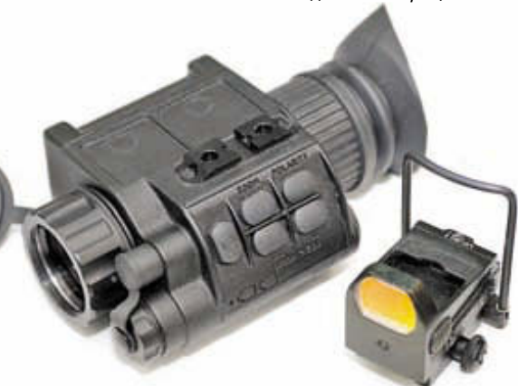
«Инфратех» представил два уникальных для российского производителя изделия: тепловизор, который предлагается с ч/б и цветной матрицами, а также компактный коллиматор открытого типа