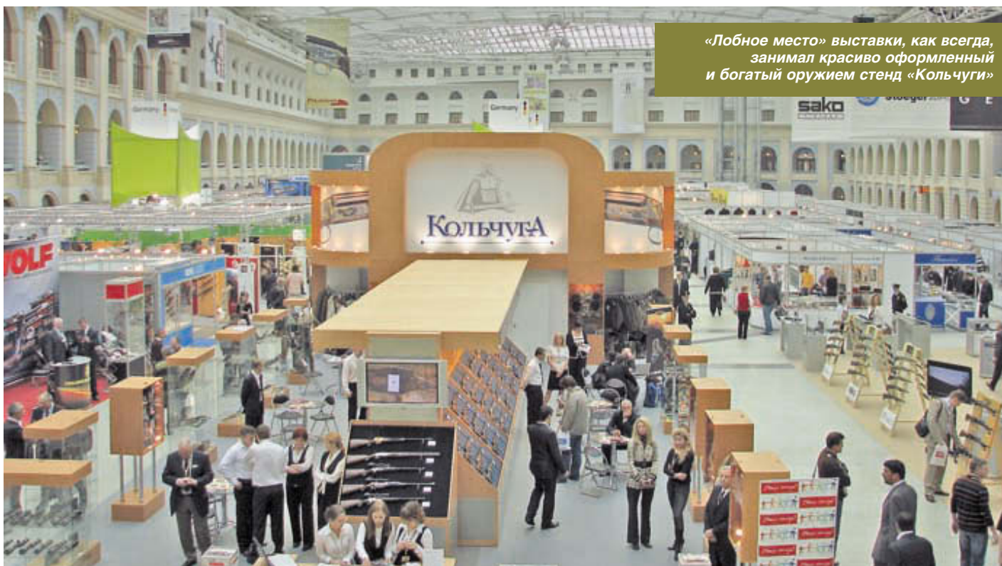
«Лобное место» выставки, как всегда, занимал красиво оформленный и богатый оружием стенд «Кольчуга»