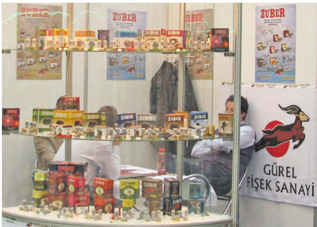
Новинкой выставки стала патронная продукция турецкого производителя Gurel Hunting Cartridges под маркой Zuber