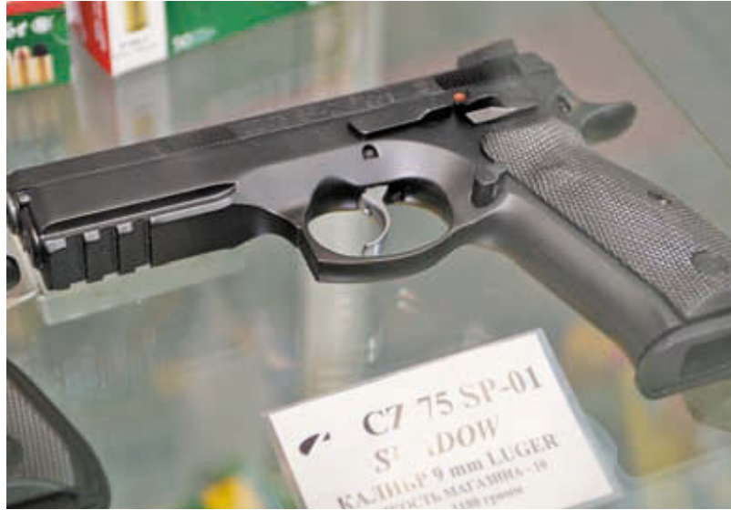
9-мм спортивный пистолет CZ 75 SP-01 Shadow хорошо знаком российским членам IPSC, стреляющих за рубежом. Теперь эта модель сертифицирована и для России

В целом эта выставка выглядела подчёркнуто деловой, она была местом встреч и переговоров производителей и их дилеров, крупных и мелких оптовиков, а также