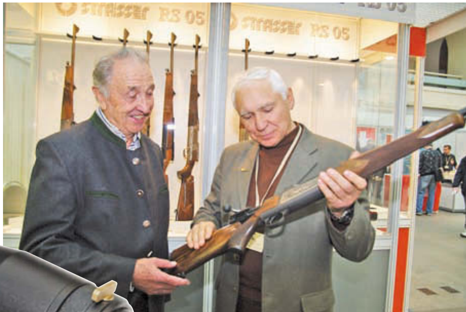
О новых модификациях австрийских карабинов Strasser RS 05 мне рассказал сам Хорст Блазер, их создатель, знаменитый европейский оружейник (на фото слева)