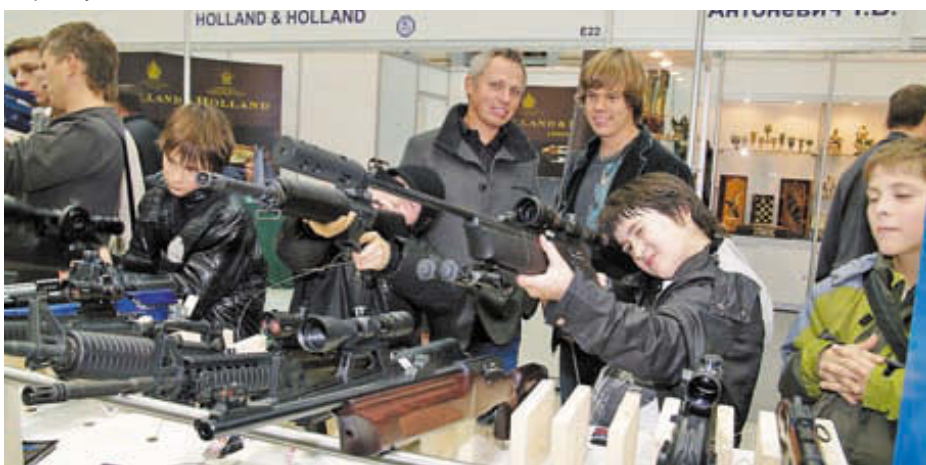
На стенде фирмы Утагех все дни топпилась целевая аудитория – подрастающие стрелки