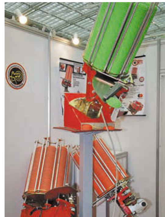
Французская компания Laporte набирает обороты в России, наладив сотрудничество со Стрелковым союзом и ведущими стендами