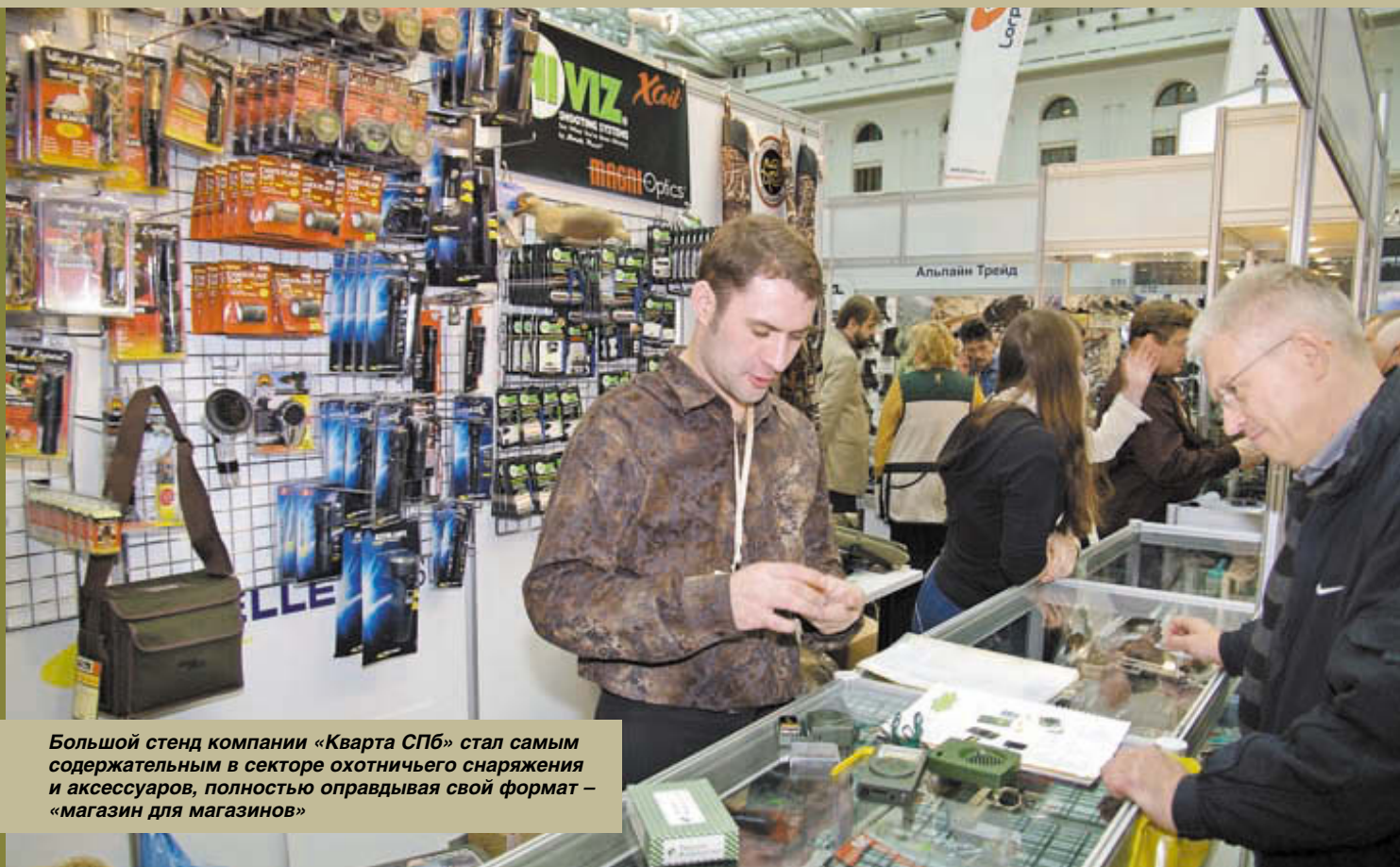
Большой стенд компании «Кварта СПб» стал самым содержательным в секторе охотничьего снаряжения и аксессуаров, полностью оправдывая свой формат – «магазин для магазинов»