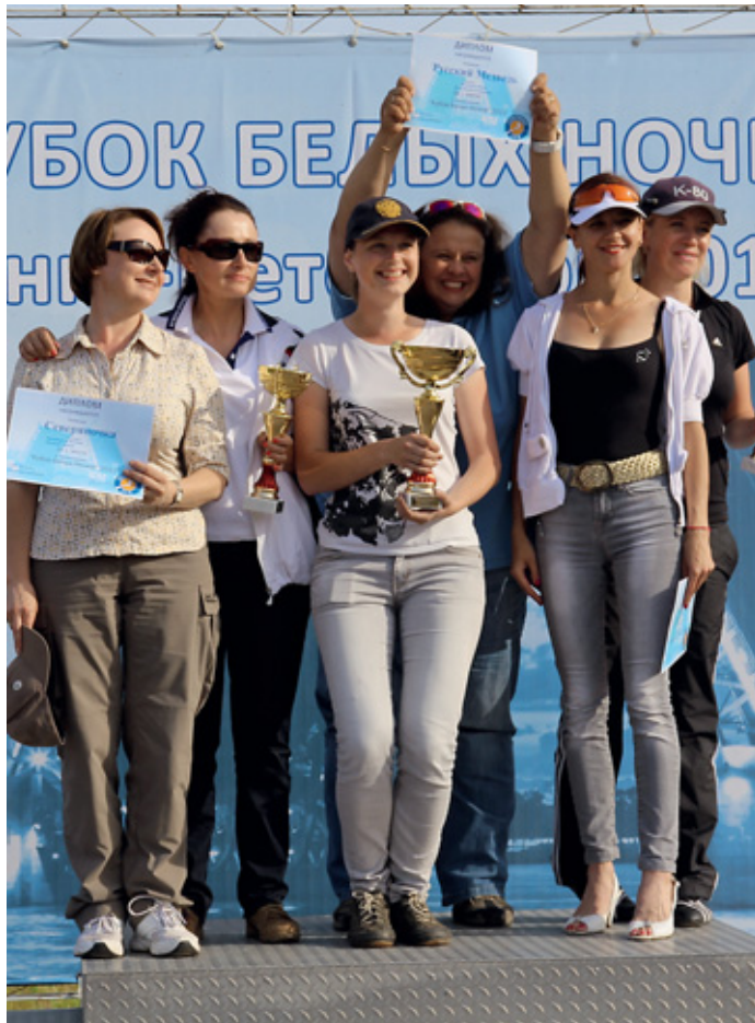
Команда «Русский медведь» – обладательница кубка среди женщин (в центре) и призёры – «Северянин» (справа) и Lady Hunter