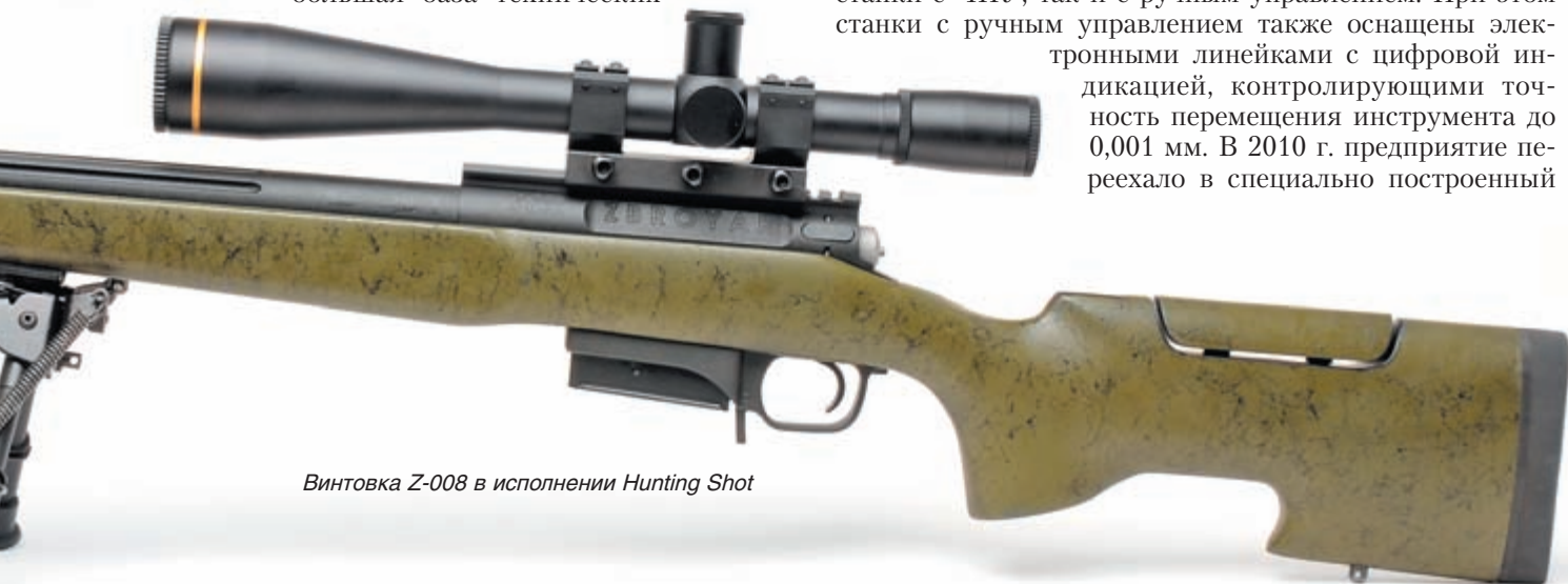
Винтовка Z-008 в исполнении Hunting Shot

На сегодняшний день предприятие имеет парк различного металлорежущего оборудования. Среди него как станки с ЧПУ, так и с ручным управлением. При этом станки с ручным управлением также оснащены электронными линейками с цифровой индикацией, контролирующими точность перемещения инструмента до 0,001 мм. В 2010 г. предприятие переехало в специально построенный