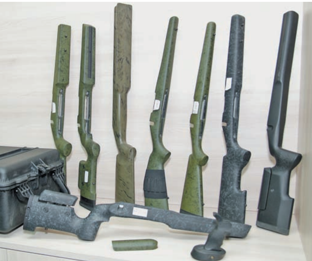
Для заказчика предлагается довольно широкий ассортимент лож различного назначения

«Сердцем» винтовки является её затворная группа. Наша ствольная коробка замкнута сверху (в отличие от классических моделей типа Remington, HS Precision или Mauser), что обеспечивает ей большую жёсткость, меньшие вибрации и соответственно лучшую кучность стрельбы. Заметно переработан узел крепления ствола в ствольной коробке. Если в классическом случае пенёк ствола «лежит» на резьбе, которая в принципе не может рассматриваться как сколько-нибудь точная направляющая, то в Z-008 пенёк разделён на три части: в средней – резьба, а с двух сторон от неё направляющие шейки. Упор отдачи монолитный,