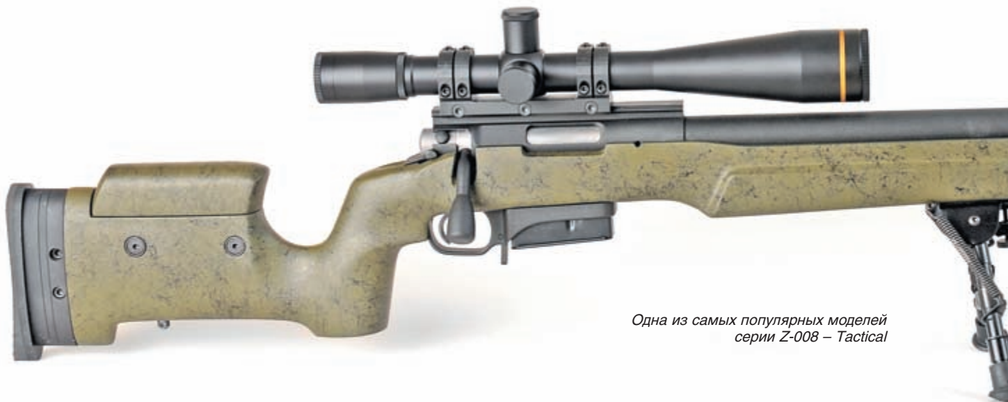
Одна из самых популярных моделей серии Z-008 – Tactical