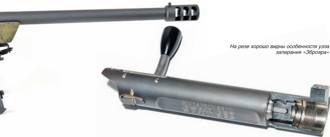
На резе хорошо видны особенности узла запирания «Зброяра»

выполненный из одного куска металла со ствольной коробкой. Конечно, это более трудоёмко для изготовителя, но оправдывает себя с точки зрения достижения максимально возможного результата. Для затвора, ствольной коробки и ствола используется только нержавеющая сталь. При производстве винтовок используются заготовки стволов Shilen, Bartlein резе Lothar Walter. Что касается патронников, то мы изготавливаем как стандартные, так и «тесные» патронники по согласованию с клиентом.