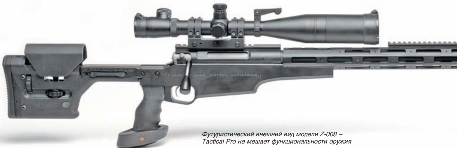
Футуристический внешний вид модели Z-008 – Tactical Pro не мешает функциональности оружия

трубка (3 базы «вивер»), цевье); мост для установки предобъективной насадки ПНВ для AW; быстросъёмный кронштейн для ПНВ «Дедал»; монолитные кронштейны для дневных прицелов с трубкой 30 и 34 мм; стальные и дюралевого кольца диаметром 1 дюйм и 30 мм.