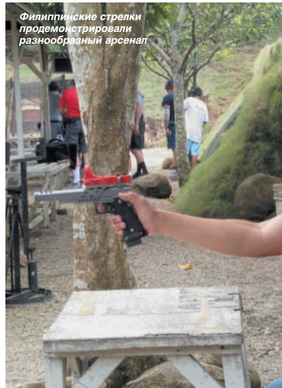
Филиппинские стрелки продемонстрировали разнообразный арсенал

удавалось позаниматься на 4-5 упражнениях. Оканчивался день вечерним собранием по результатам дня, которое совмещалось с лёгким ужином. Атмосфера царил спортивная и аскетичная, никаких курортных настроений: стрелки ответственно и сосредоточенно занимались.