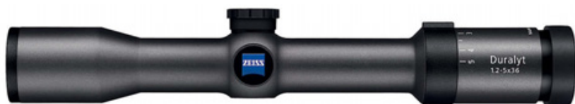
Оптические прицелы Zeiss Duralyt 1,2-5x32 и 3-12x50 без подсветки сетки