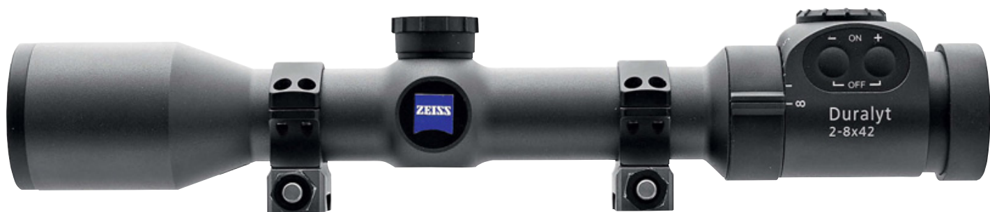
Оптический прицел Zeiss Duralyt 2-8x42 с подсветкой сетки. Именно этот прицел использовался во время редакционного тестирования

Основной задачей было выяснить возможности прицела при его использовании в зверовых охотах из засидки, а также с подхода к зверю скрадом на кормовом поле в короткое сумеречное время. Для этого на достаточно открытой лесной поляне была выставлена фигурная мишень кабана чёрно-бурого цвета средних размеров в реальную величину. Место засидки было выбрано на высоте около 3 м от земли, дистанция до мишени – 50 м.