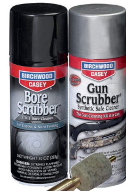
Патчи FVG на игле

Продукцию всех выше обозначенных фирм вы можете приобрести в компании ООО «Лазер-Трейддинг» (Москва), (495) 940-08-08, www.laserhunt.ru , e-mail: info@laserhunt.ru , а также в компании ООО «Егер» (Новосибирск), (383) 236-07-66, www.eger-nsk.ru , eger_nsk@mail.ru .