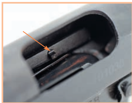
Стрелкой указан новый отражатель

В наши руки попал пистолет ТТ 1940-го года выпуска (серийный номер и год производства видны над накладкой рукоятки), переделанный в МР-81 в 2008 году