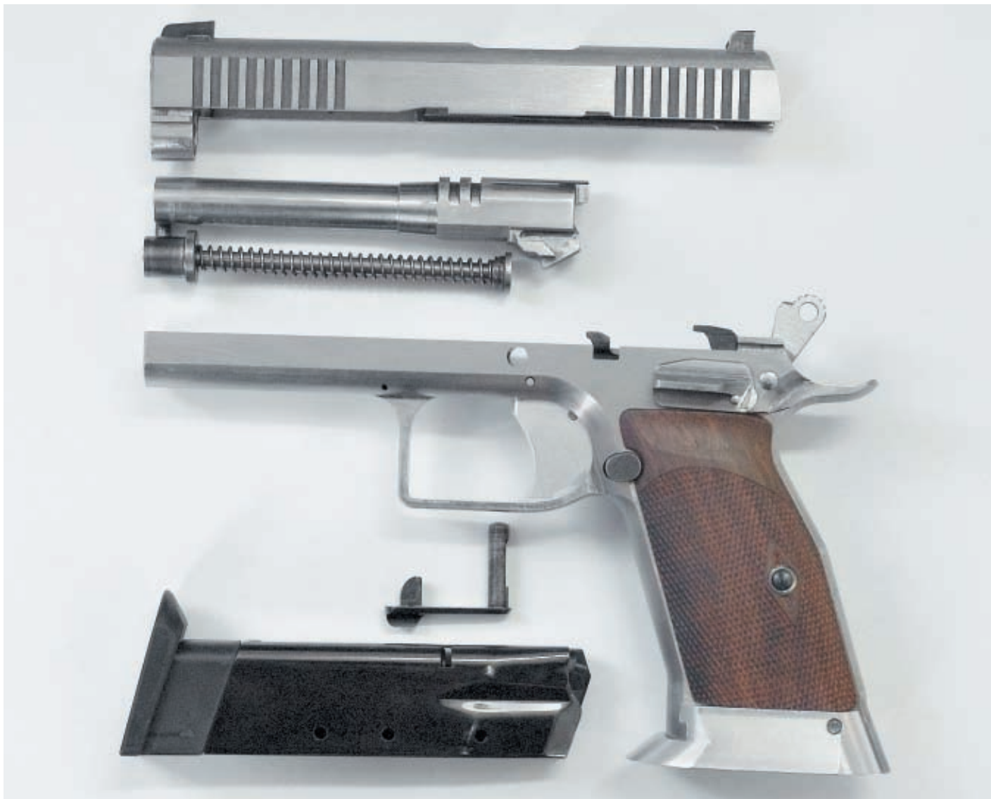
9-мм спортивный пистолет ПЕ-9. Неполная разборка