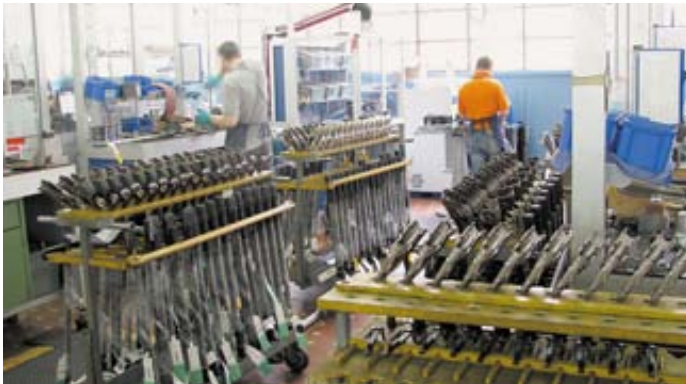
Участок сборочного цеха. Всё готово к сборке ружей и отладке их механизмов