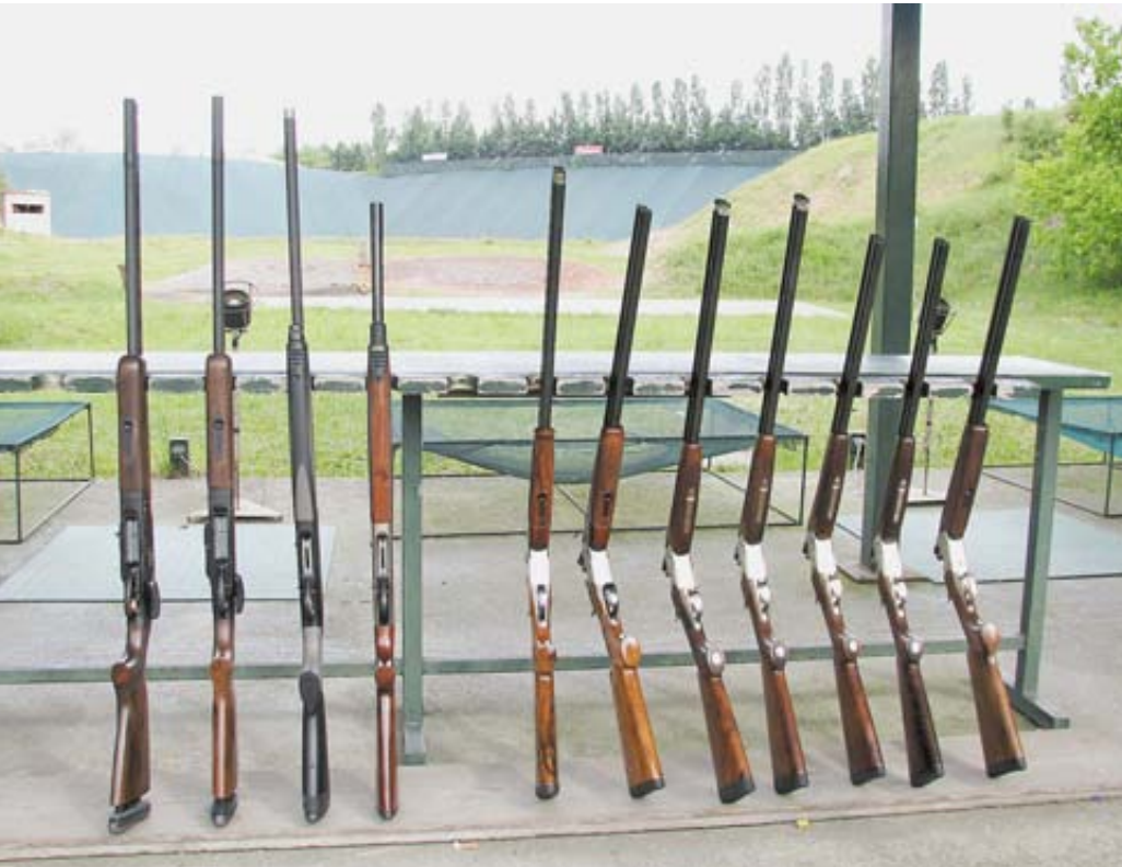
Для стрельбы на стенде были представлены почти все типы ружей Beretta: газоотводные самозарядки серии AL 391, двухзарядные полуавтоматы UGB 25 Xcel Sporting, новые двухстволки SV 10 Perennia и Prevail и даже знаменитые DT 10 Trident