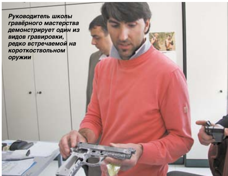
Руководитель школы гравёрного мастерства демонстрирует один из видов гравировки, редко встречаемой на короткоствольном оружии