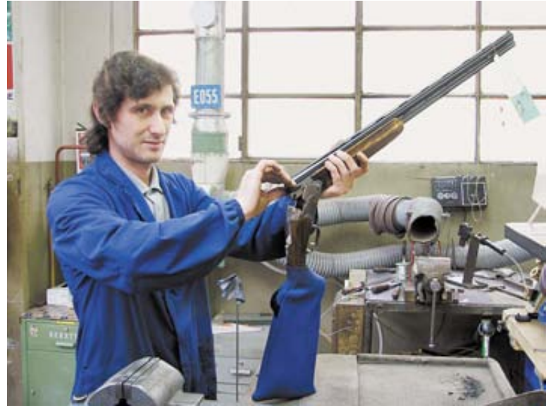
На этом участке производится отладка эжекторной пары двухствольных ружей Beretta

и полицейского короткоствольного оружия. На протяжении нескольких последних лет компанией был подписан контракт на поставку 45 000 пистолетов 92 FS гражданской гвардии Испании, около 40 000 пистолетов 92-й серии было поставлено для полицейских сил Турции, 18 744 пистолета 92 FS – для военно-воздушных сил США, а также 10 576 единиц Beretta 92 – для ВМС США. Это наряду с поставками для армии и полиции Италии, пограничной службе Канады (модель Px4 Storm), национальной жандармерии и военно-воздушным силам Франции и т. д.