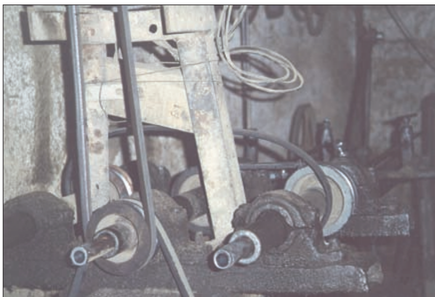
Агрегат для сверления стволов, позволяющий обрабатывать сразу две заготовки