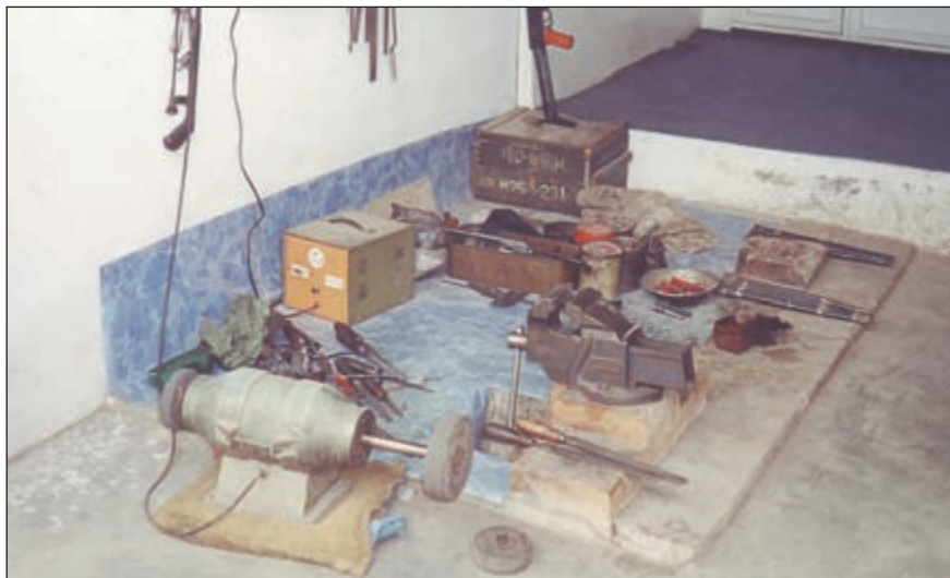
Типичная пуштунская оружейная мастерская. Всё делается даже не «на коленках», а в буквальном смысле слова на полу

Процесс формирования нарезов в канале ствола оружия