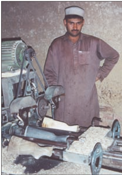
Изготовление прикладов производится на простейшем копировальном станке

теснил наиболее популярное оружие предыдущих десятилетий – английскую винтовку Ли Энфилд. Уровень преступности при этом остается довольно низким: «У меня дома есть «Калашников» и у моего брата тоже есть. Все живут одинаково, и всякий знает, что такой же автомат есть и у его соседа, и у его врага».