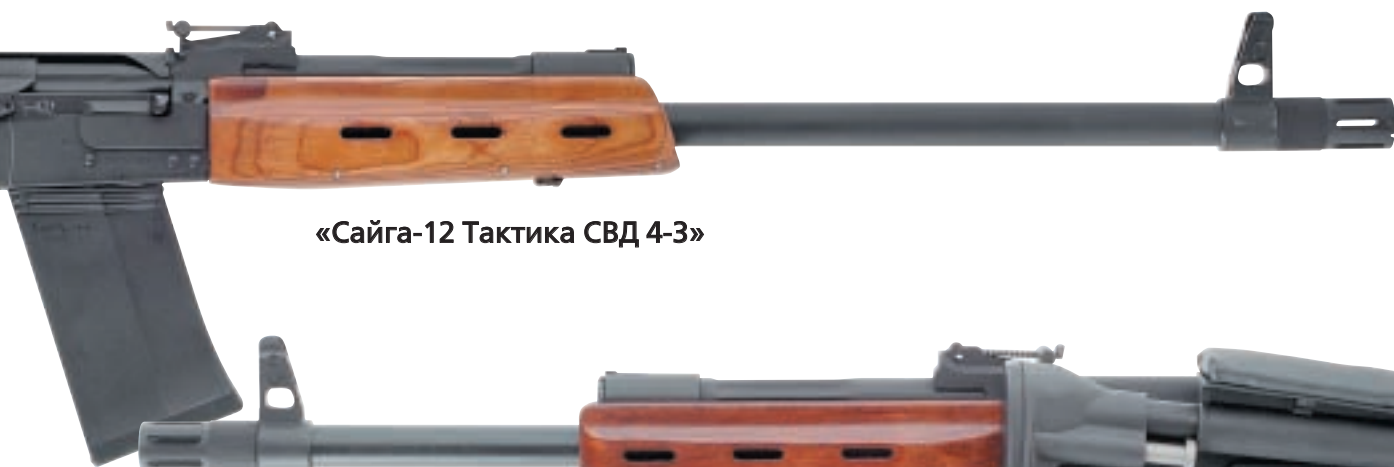
«Сайга-12 Тактика СВД 4-3»