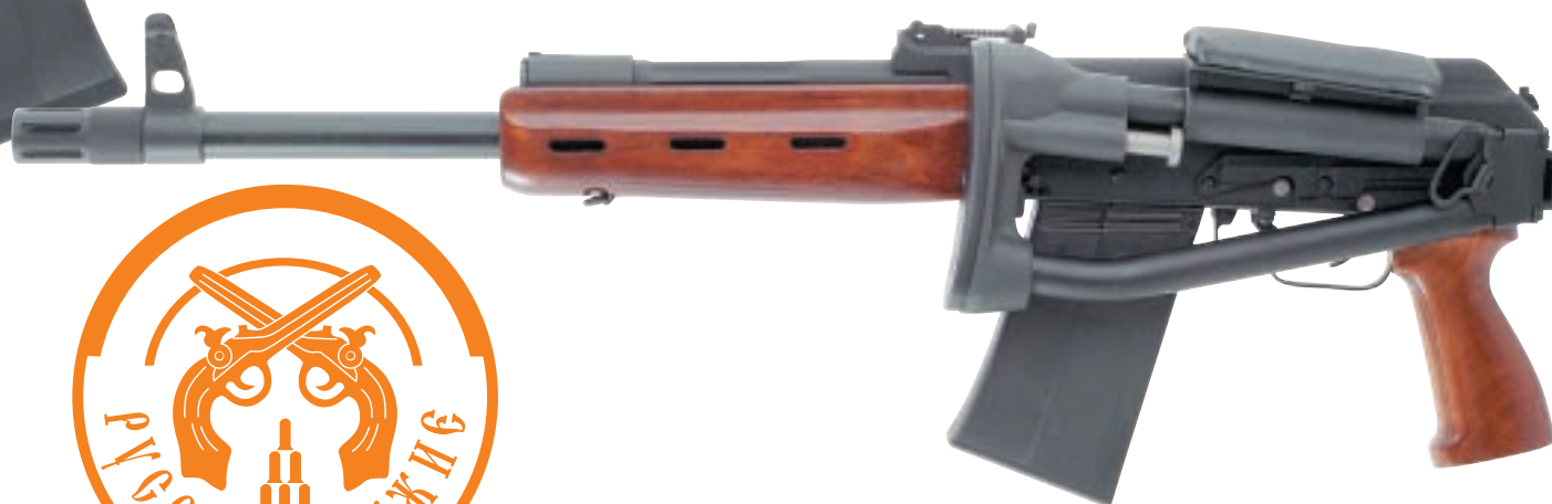
«Сайга-12 Тактика 3-1»