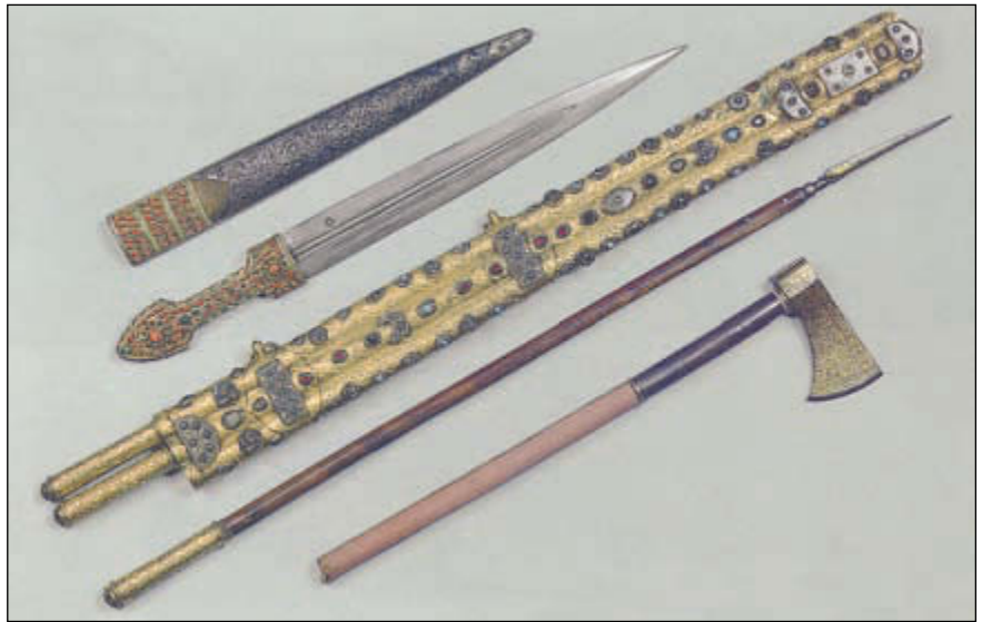
Снизу-вверх: топорок, джерид (джит) с сулицами, кинжал типа «кама». Сулицы представляют собой дротики

женная елмань с острым лезвием на ней. Предположительно она появилась на турецком оружии в XV столетии. Такая же елмань есть и у палы, но пала имеет клинок несколько шире, чем у килиджа и более резкий изгиб. Рукояти и килиджа и палы делались из рога или кости и имели характерное для турецкого оружия каплевидное завершение. Крестовина с перекрестьем о двух огнивах, как правило, имела завершения на концах в виде продолговатых округлых утолщений. До середины XVII века боевые сабли изготавливались тяжелыми и чрезвычайно острыми, что объяснялось необходимостью