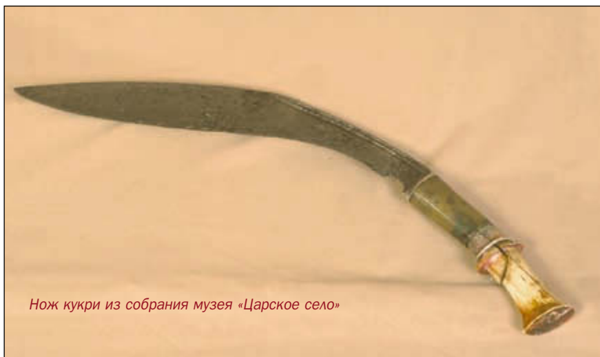
Нож кукри из собрания музея «Царское село»