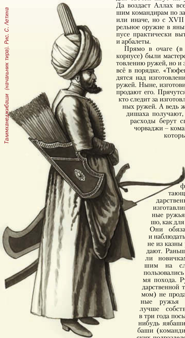
Талимханеджибаши (начальник тира). Рис. С. Летина

Впервые этот термин – «трапезундские ружья» мы встречаем в трудах Э. Ленца, хотя в архивных материалах этот термин встречается в рукописях начала XVIII столетия. История Трапезунда по-турецки Тарабузана, ныне Трабзона, весьма драматична. Трапезундская империя была создана в 1204 году внуками Византийского императора Андроника I при содействии Грузинской царицы Тамары. В 1461 году империя была завоёвана Турками Османами и с тех пор находилась в составе турецкого государства, за исключением некоторого времени в 1916 году, когда город был взят Российскими войсками и превращён в базу Российского Черноморского флота. Отношение самих ту-