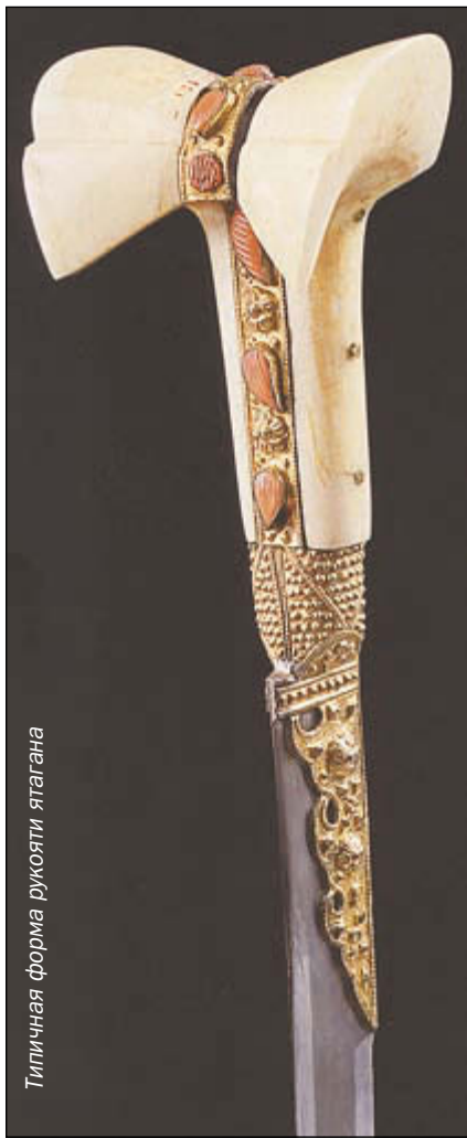
Типичная форма рукояти ятагана