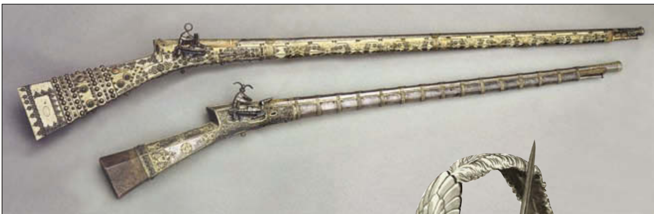
Турецкие ружья XVIII в. из собрания Государственного музея заповедника «Царское село». Оба ружья имеют нарезной ствол.

рок к этому санджаку (провинции) было весьма негативным. «Производить среди них (Тарабузанцев) набор (в янычары) незаконно. Не делают этого вот почему: мало того, что порочность тарабузанцев превосходит всё, что можно себе представить, ещё ни один из заимов и sipахи из их числа не проявил ни отваги, ни доблести. Они совершали лишь обман да злодейство». Тем не менее, это был процветающий город, ибо только в таких санджаках, по традиции правили принцы, перед тем как вступить на престол. Будущий султан Селим I правил в Трапезунде с 1512 по 1520 год, и на основании своего опыта повелел брать трапезундцев в янычары, с тем, чтобы они были доносчиками и помогали предотвращать янычарские бунты. «Жители Тарабузана – зловерные люди, люди двуличные... Как только один такой появится среди них (из боязни доноса) невозможно будет собраться вместе 4 – 5 янычарам. Тогда янычары не смогут поднять мятеж». Чуть ниже автор «Истории...» оговаривается: «Со временем плутовство и обман тарабузанцев не замедлили сказаться и само имя «лаз» стало вызывать смех». Таким образом, речь идет о лазах, которые были мусульманами и брать их в янычарский корпус действительно было незаконно, т. к. в него набирались только христиане.