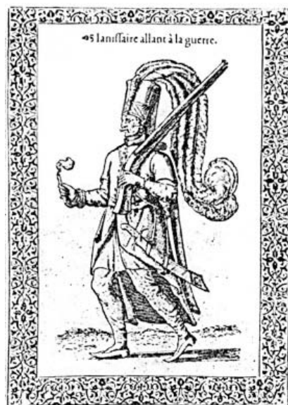
Янычар в полном вооружении. Европейская гравюра середины XVI в.

Как уже говорилось выше, – талимхане представлял собой особую орду – подразделение янычарского корпуса – под № 54, хотя в ней были только сам командир и инструктор. Как всегда старшее поколение сетовало на полное духовное разложение молодёжи, и, кроме того, автор «Истории происхождения законов янычарского корпуса» раздражался громом и молниями против казнокрадства современных ему турецких бюрократов: «Получают деньги на все расходы (по содержанию талимхане), однако, они ныне в запустении. Недостойно брать деньги на расходы по талимхане и не исполнять своих обязанностей. Между тем тот, кто учредил талимхане, сделал это ради того, чтобы янычары обучались искусству стрельбы из лука. Нынче и талимха-