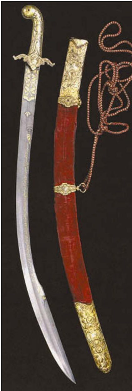
Турецкая сабля (килидж) конца XVIII века

женная елмань с острым лезвием на ней. Предположительно она появилась на турецком оружии в XV столетии. Такая же елмань есть и у палы, но пала имеет клинок несколько шире, чем у килиджа и более резкий изгиб. Рукояти и килиджа и палы делались из рога или кости и имели характерное для турецкого оружия каплевидное завершение. Крестовина с перекрестьем о двух огнивах, как правило, имела завершения на концах в виде продолговатых округлых утолщений. До середины XVII века боевые сабли изготавливались тяжелыми и чрезвычайно острыми, что объяснялось необходимостью