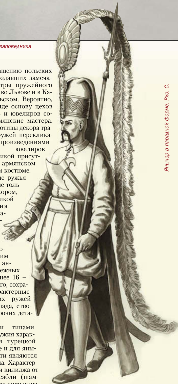
Янычар в парадной форме. Рис. С.

Основными типами холодного оружия характерными для турецкой армии вообще и для янычар в частности являются килидж и пала. Характерным отличием килиджа от персидской сабли (шамшира) является ярко выра-