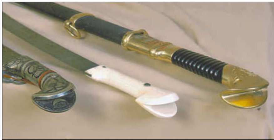
Кавказские шашки XIX в. Крайняя справа – строевая казачья шашка обр. 1909 г., выполненная по типу кавказской шашки

необходимо отметить, что среди археологических находок при раскопках могильника XII века до нашей эры на острове Крит был обнаружен жреческий нож для жертвоприношений, имеющий рукоять в виде сустава берцовой кости. И вот в XVIII веке в Турции появляется нож, рукоять которого повторяет рукоять