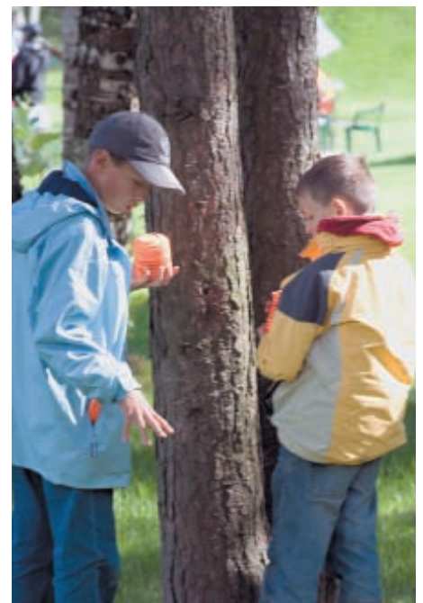
Новая смена молодых петербуржцев уже присматривает места на стрелковых площадках ССК «Олимпиец»...