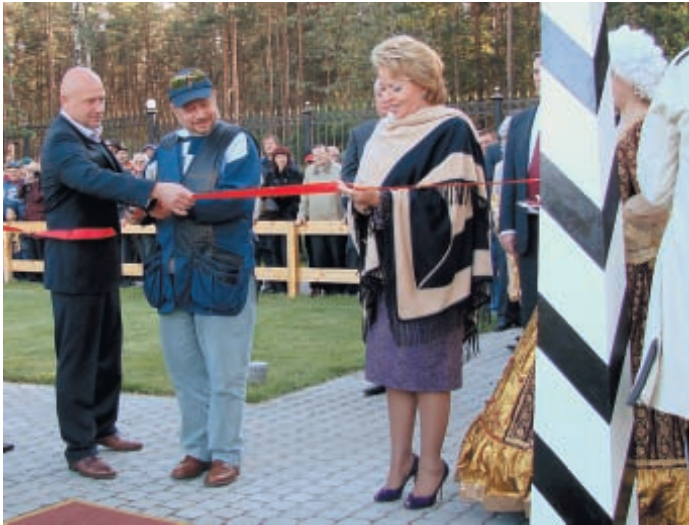
Новый стрелковый стэнд «Олимпиец» в Сосновке торжественно открыли президент Стрелкового Союза России Владимир Лисин и губернатор Санкт-Петербурга Валентина Матвиенко