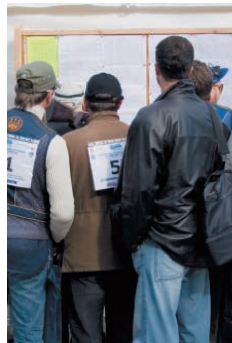
Обычное столпотворение у стенда информации в поисках итоговой таблицы результатов стрельбы, которая так и не появилась ...