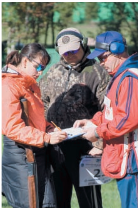
Очередную победную серию на площадке завершила чемпионка Европы, мастер спорта международного класса, ведущий стрелок страны Инна Александрова