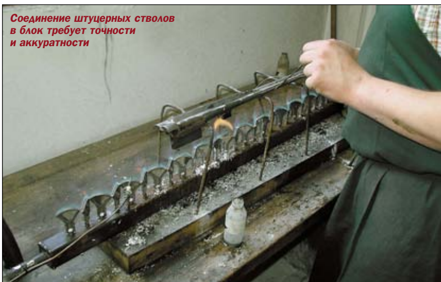
Соединение ружейных стволов в блок требует точности и аккуратности

Всё оружие Шайринга отличается особой высокохудожественной отделкой, в которой могут быть