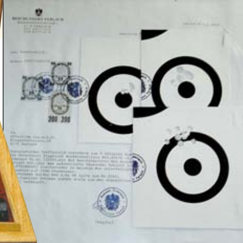
Кучность стрельбы из оружия Шайринга в комментариях не нуждается

получения стволов очень высокого качества). После тщательного контроля параметров наружные поверхности стволов проходят первичную обработку, а затем стволы собираются в блок. Для этого никогда не используется муфтовое соединение, обычное при серийном производстве. Стволы в казенной части соединяются в моноблок пайкой твёрдым припоем. Верхняя межствольная планка в ружьях-«горизонталках» припаивается твёрдым припоем, нижняя – мягким. Применение высококачественных сортов ствольной стали позволяет сделать двуствольный штуцер или тройник под мощные патроны, например, .300 Pegasus, массой менее 3 кг.