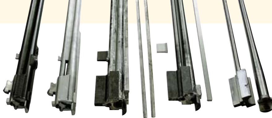
От заготовки к блоку стволов. Стволы соединяются в блок пайкой твёрдым припоем. Особенность технологии состоит в том, что нижний ствол и его «крылья» выполнены из цельного куска металла

Архивные данные свидетельствуют, что особое развитие оружейное производство в Ферлахе получает при правлении императрицы Марии-Терезии (1740-1781), когда оружейникам были предоставлены важные социальные привилегии в виде статуса и квалификации мастера-оружейника государственного значения. В дальнейшем здесь была основана гильдия мастеров-оружейников. В период наполеоновских войн 1800-1814 гг. в Ферлахе уже насчитывалось 22 оружейные мастерские, которые за это время произвели более 300 000 единиц военного ору-