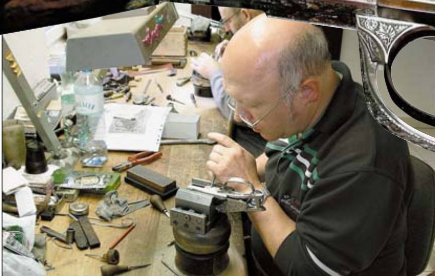
За работой гравёры – люди, превращающие хорошее охотничье ружьё ещё и в произведение искусства

лов: двуствольный горизонтальный штуцер-экспресс под патроны калибра .470 N.E., второй блок – под патроны .30-06 Spr., и третья пара – гладкие стволы калибра 20/76(!). Или: горный штуцер с верхним стволом под патрон 8x75R, нижний – 6x50R, с одним замком на оба ствола, селектором очерёдности стрельбы, со шнеллером и отдельной спицей для его взведения и с ручным поджатием боевой пружины. Или: две идентичные горизонталки калибра 20/70 и 20/76 с замками на боковых досках типа Holland&Holland, с английскими