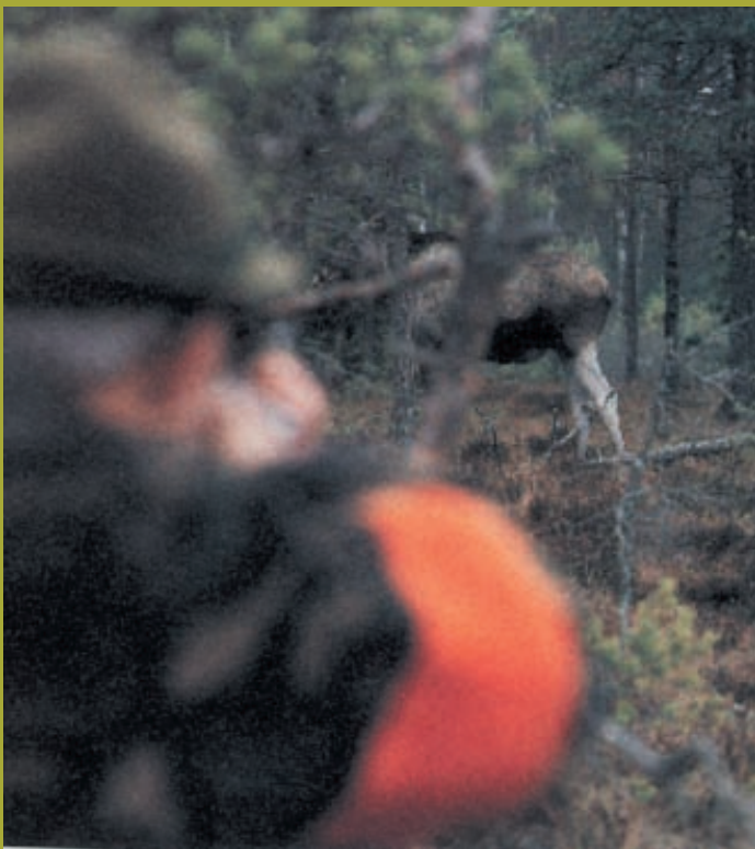
Охотник изготовился, но проявил выдержку и не выстрелил по нечётко видимой цели