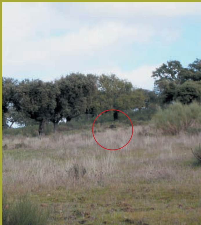
Неясно видимая цель. Стрельба запрещена