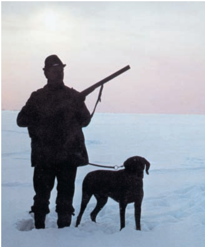
По сравнению с коллективными, одиночные охоты более безопасны

охот, в цикле очерков «Охота в России» (Лесной журнал – 1847, № 10, с. 80) писал: «В русском языке есть слово, непередаваемое ни на какой другой язык, слово всемогущее, выражающее лучше длинных фраз и объяснений то странное чувство, которое пробуждается в русском человеке при приближении опасности, в исполнении опаснейших предприятий. Это слово – авось, с ним для русского нет ничего невозможного». Смею уверить читателя, что черты «национальной психологии охот» у других народов Старого света этим европейцем преподнесены в значительно более хмурых тонах, по сравнению с нашими, так что