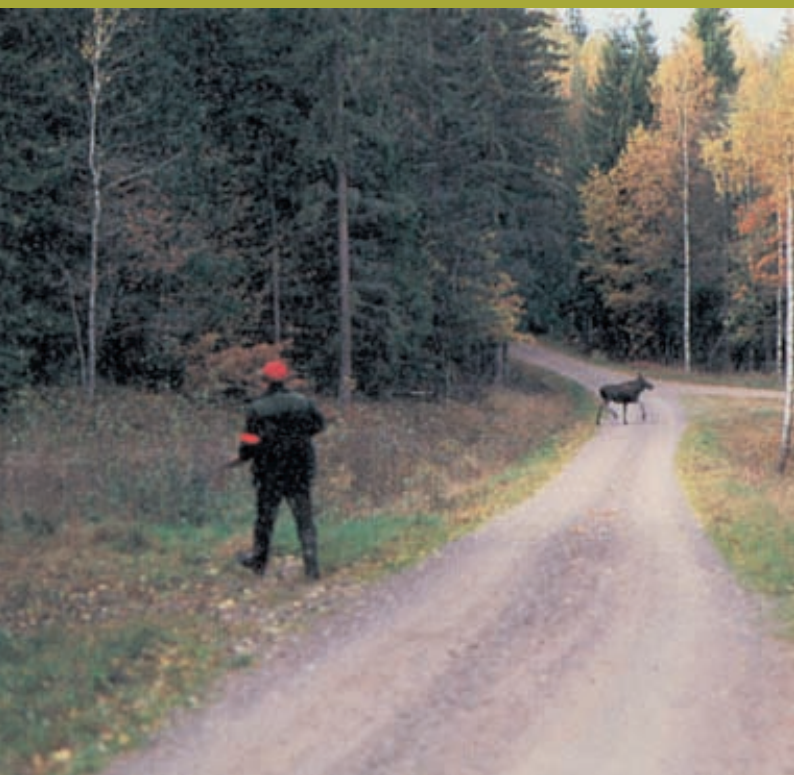
Зверь на стрелковой линии. Стрельба запрещена

Примерно через час ожидания выхода кабанов на номере молодого охотника прозвучал выстрел, до меня донеслись отрывки речи охотников, и опять всё стихло. Увидев световой сигнал, я вышел на место сбора и вскоре всё выяснилось. Оказалось, что наш «опытный» охотник спустя полчаса покинул место засидки, ушёл в лес, ходил по его краю, затем перепутал направление и вместо возвращения на свой номер, стал выходить на номер молодого охотника. Сумерки становились всё гуще, с поверхности земли поднялся туман и застыл пеленой примерно на метровой высоте. От этого фигура идущего человека стала видна лишь наполовину, т. е. верхняя ее часть от пояса, и молодой охотник принял её за кабана. Подпустив «зверя» шагов на 50, хорошо прицелился и выстрелил пулевым патроном 12 калибра... Будучи мастером спорта по пулевой стрельбе, он даже в сумерках не промахнулся и попал