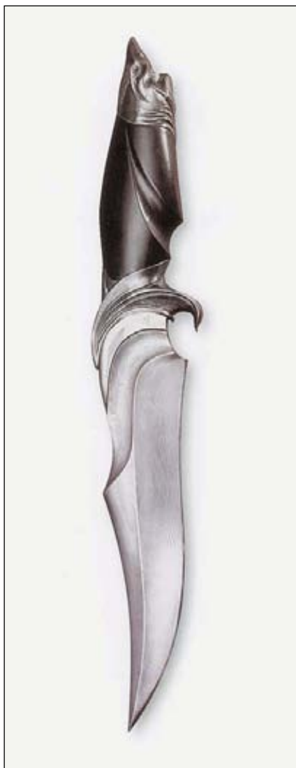
Нож «Акула». ООО ПП «Кизляр»