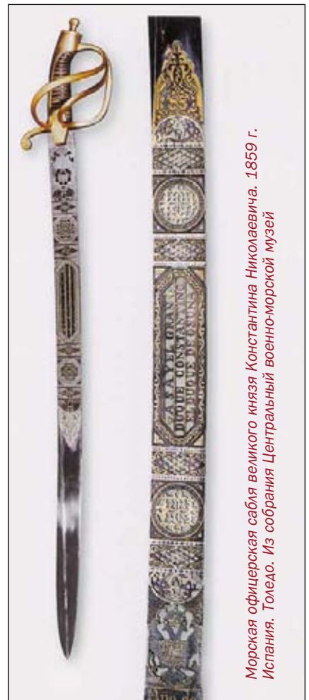
Морская офицерская сабля великого князя Константина Николаевича. 1859 г. Испания. Толедо. Из собрания Центрального военно-морской музей