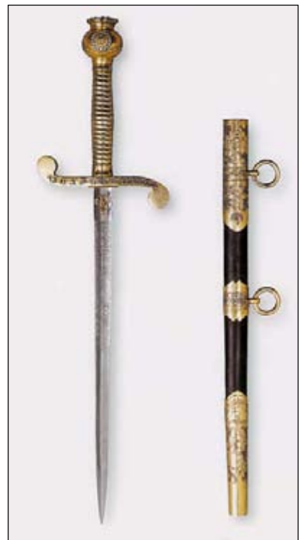
Морской офицерский кортик адмирала Е. И. Алексева. Золотое оружие с бриллиантами. Златоуст, вторая половина XIX в. Из частного собрания