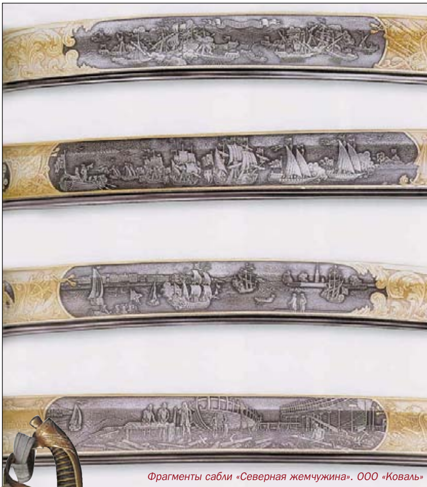
Фрагменты сабли «Северная жемчужина». ООО «Коваль»