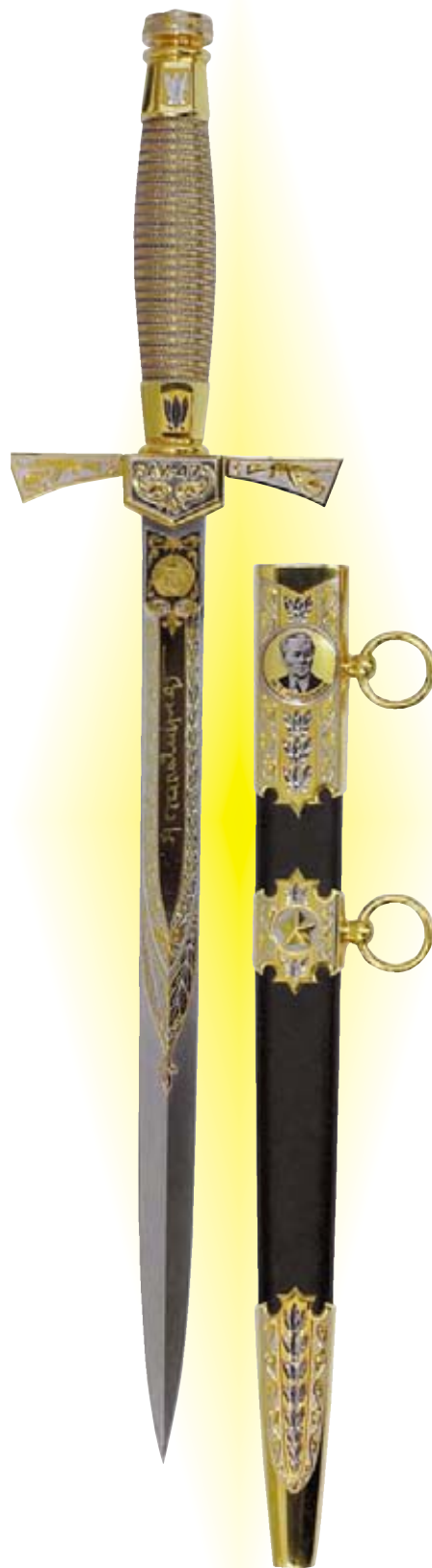
Коллекционные кортики художественной мастерской «Практика» из серии «Калашников»