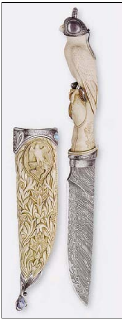
Нож «Кречет». ООО «Русские палаты»