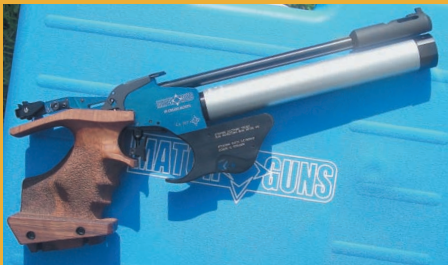
Новый продукт на Российском рынке – пневматический пистолет итальянского производства