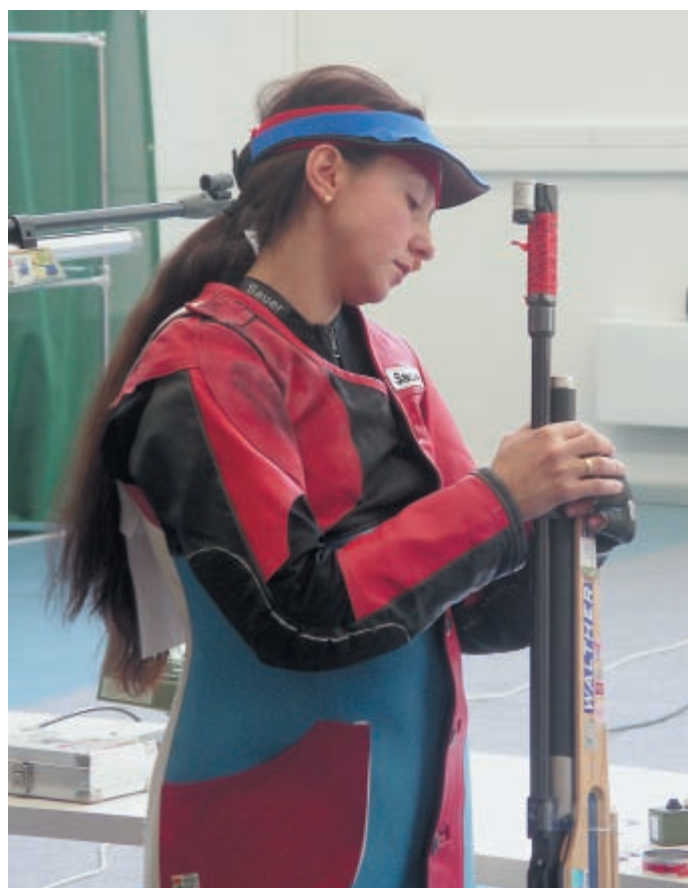
Победительница в стрельбе из пневматической винтовки, олимпийская чемпионка Любовь Галкина