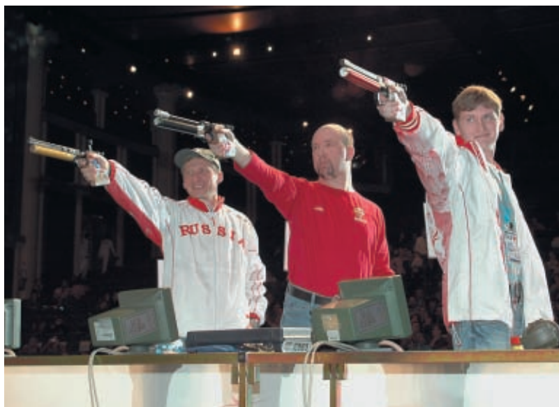
Первыми в «бой» вступили мужчины-пистолетчики