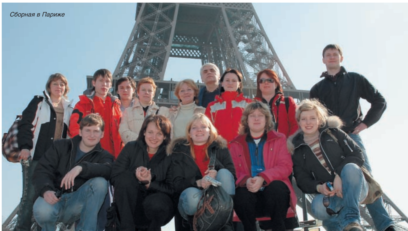
Сборная в Париже