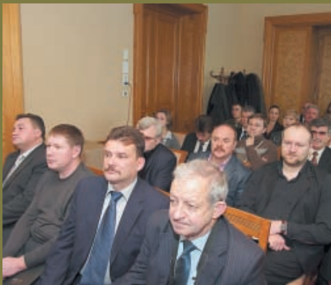
На семинар «Беретты» приехали представители почти 40 российских оружейных магазинов