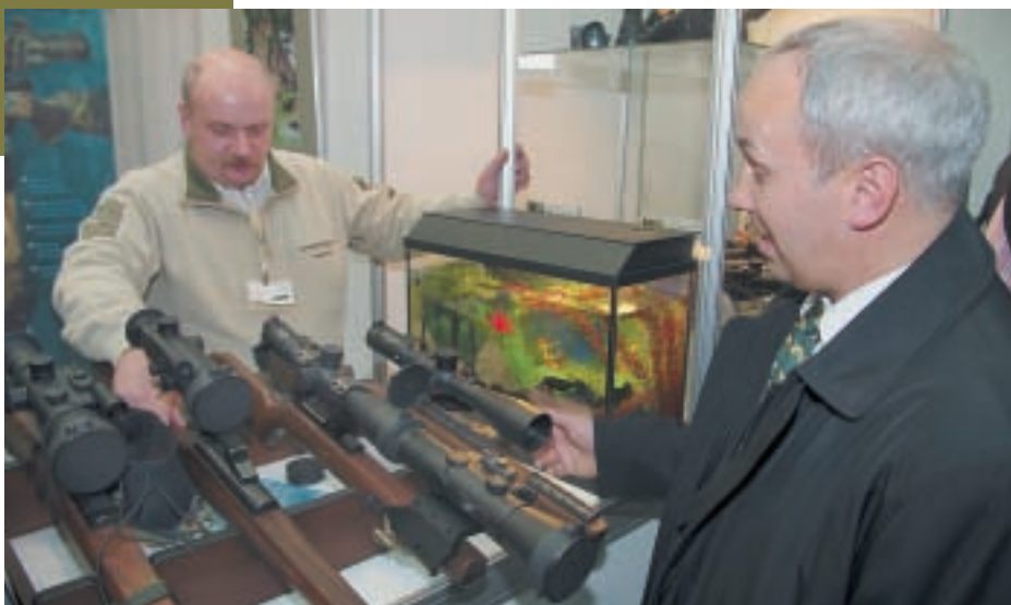
Однажды на выставке специалистам «Дедала» для того, чтобы убедить недоверчивого посетителя в настоящей водонепроницаемости своих ночных прицелов пришлось достать прибор из аквариума и включить. До этого момента гость был уверен, что это муляж

Одна из самых востребованных новинок Zeiss – прицел с встроенным лазерным дальномером Victory Diarange