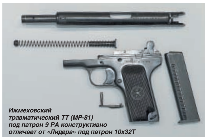
Ижмеховский травматический ТТ (МР-81) под патрон 9 РА конструктивно отличает от «Лидера» под патрон 10х32Т

Кстати, со своей стороны я предложил изготовителям «Терминатора» оснастить его тактическим ударно-спусковым механизмом. В таком варианте, если нажать и удерживать спусковой крючок, срыв курка с шептала и, соответственно, выстрел, будет происходить каждый раз, когда при перезарядании затвор будет приходиться в крайнее переднее положение. То есть, для производства, например, четырёх выстрелов из оружия с пустым патронником, стрелок, удерживая нажатым спусковой крючок, просто четыре раза передёргивает цевье в удобном ему темпе. Просто, быстро, безопасно и проверено американскими полицейскими.