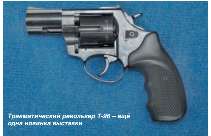
Травматический револьвер Т-96 – ещё одна новинка выставки

с резиновой пулей калибра 12x35 мм (патрон для «Хауды»). Витиеватое название не должно вводить будущего владельца в заблуждение – «пистолет» на поверку оказывается четырёхзарядным (+1 в патроннике) помповым ружьём без приклада, а всё это словоблудие связано исключительно со своеобразием отечественного законодательства. Образец имеет длину менее 500 мм и весит 1,75 кг.