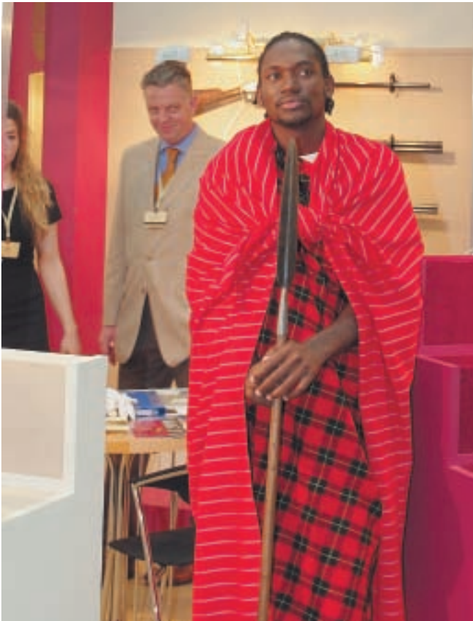
Стенд группы компаний «Охотник». Рядом с шикарным оружием для африканских охот аутентичный африканский охотник

а ставший похожим на боевой, дульный срез «45-го» ствола оказывает дополнительный «успокаивающий» эффект на «цель». Правда, на мой взгляд ещё больший эффект оказывается на впечатлительного владельца оружия, осознающего, что «...дульный срез «45-го» ствола оказывает...». На всякий случай помните, что оправданное применение оружия – это всегда крайняя мера, и когда решение приятно, нужно стрелять, а не «демонстрировать» – это не удостоверение.