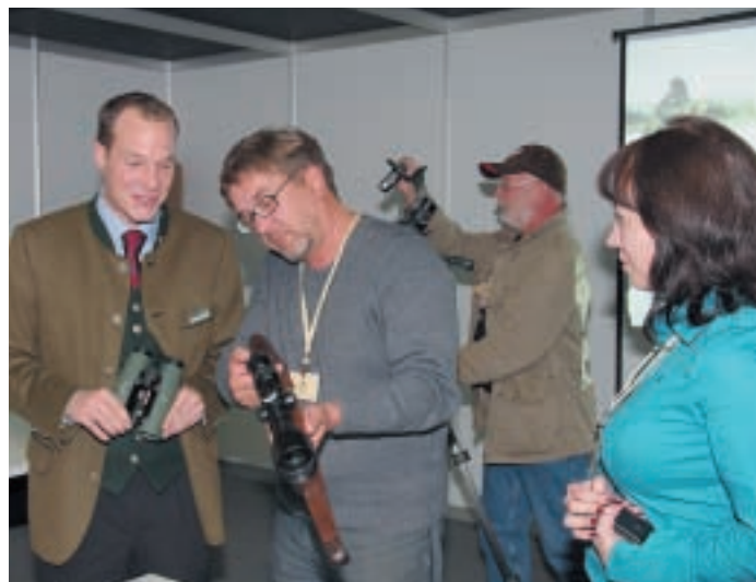
Презентация новинок компании Swarovski

семей с детьми самых разных возрастов. Простор выставочного зала и постоянство размещения основной части стенов обеспечивают порядок и удобство для каждого.