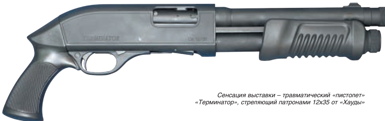
Сенсация выставки – травматический «пистолет» «Терминатор», стреляющий патронами 12x35 от «Хауды»