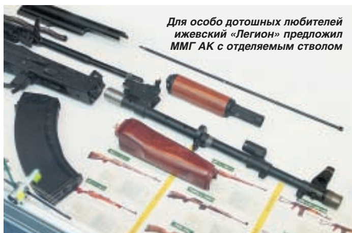
Для особо дотошных любителей ижевский «Легион» предложил ММГ АК с отделяемым стволом