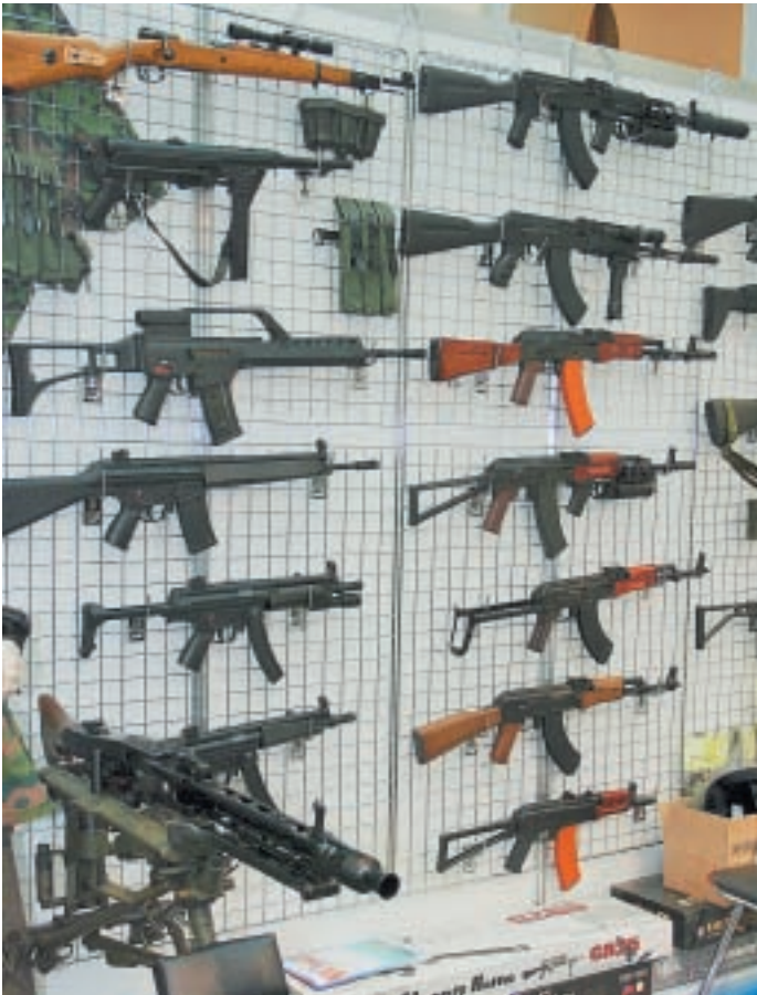
Огромный ассортимент soft-пневматики был представлен на стенде www.7-62.ru