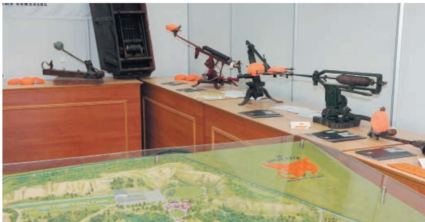
На стенде ССК «Лисья нора» была представлена великолепная коллекция старинных метательных машинок