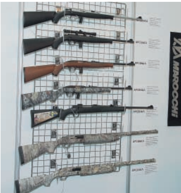
Оружие Mossber, продвигаемое в России «Ижевским арсеналом», постепенно возвращается на позиции, утраченные в середине 90-х годов