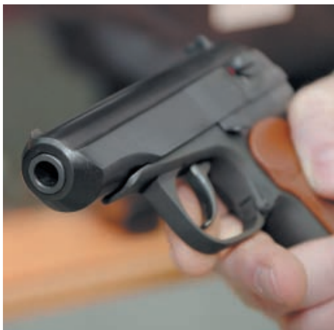
Дульная часть крупнокалиберного «Макарыча» (MP-80-13T) выглядит внушительно – несложно перепутать с настоящим ПМом

Эта, пятая по счёту, выставка Arms&Hunting – точка. Жирная точка на ещё вчера теплившихся надеждах конкурирующих выставочных площадок побороться с Гостиным двором за экспонентов-оружейников. Около-тематические выставки на ВВЦ (ВДНХ) и в «Крокусе» окончательно лишились серьёзной оружейной составляющей, и я не вижу предпосылок к тому, чтобы изготовители и продавцы гражданского оружия сколь-нибудь массово принимали в них участие. Зачем? Целесообразнее сэкономить время и деньги потратить на экспозицию в Гостином дворе – достойная компания и правильная посетительская аудитория гарантированы.