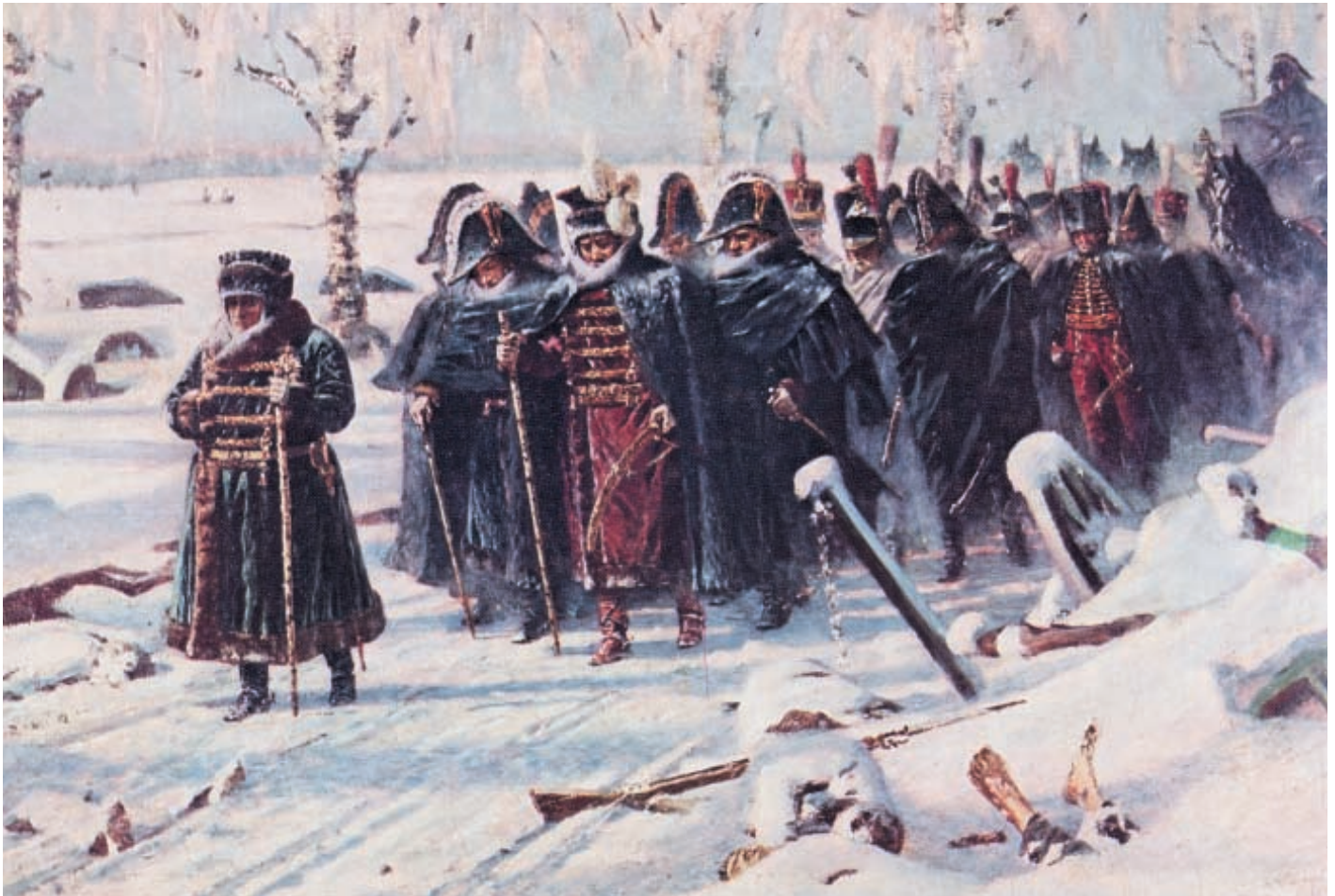
Брошенное оружие, изображённое на картине Василия Васильевича Верещагина, вполне могло попасть в руки жителей Российской Империи. После Отечественной войны 1812 года был даже издан специальный указ, предписывающий населению сдавать трофейное оружие властям