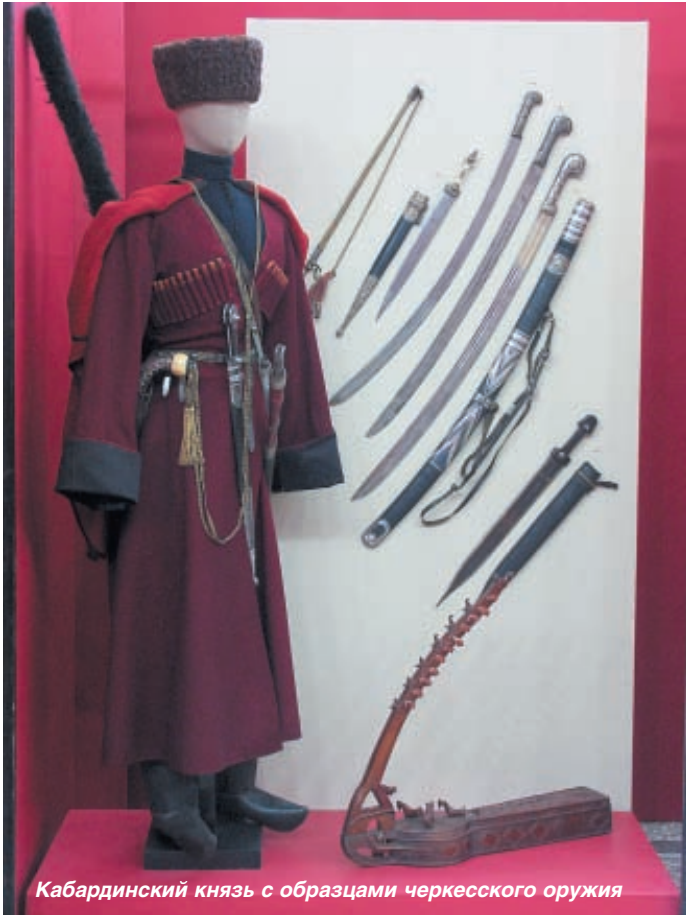
Кабардинский князь с образцами черкесского оружия

рассматривать как своеобразную промысловую деятельность. Под руководством военного предводителя – сердара – собирался временный военный отряд, в который вступали, в основном, молодые мужчины. Участие в набеге приносило им не только материальную выгоду, но и славу смельчаков, высоко ценимую в традиционном