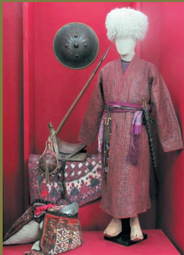
Туркмен, вернувшийся из набега

Если ремесленник мог подтверждать своё мастерство, делая не только оружие, но и другие вещи, то для мужчины-воина оружие было совершенно необходимым атрибутом. Эпический образ героя, служивший образцом для подражания, непосредственно связан с представлением