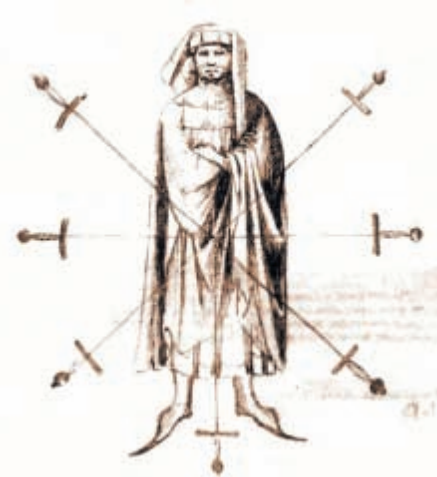
Итальянский учитель фехтования Фиоре Дей Либери

Но минули тысячелетия, и оба имени равноправно соединились в тонких стебельках прекрасного цветка. Цветка гладиаторов.