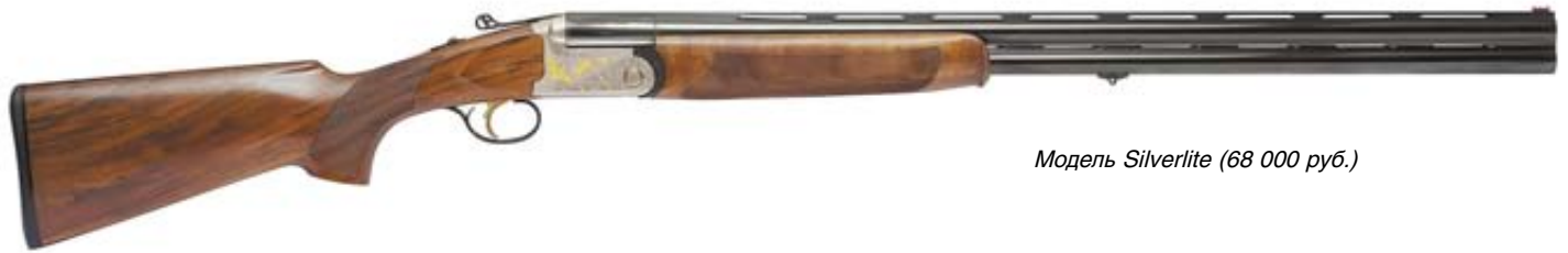
Модель Silverlite (68 000 руб.)