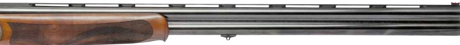
Модель Overland EL (99 000 руб.)

в боковые стенки коробки. Все так называемые легкосплавные коробки ружей Bettinsoli сделаны из цельных заготовок сплава Ergal, имеют в «зеркале» вставки.