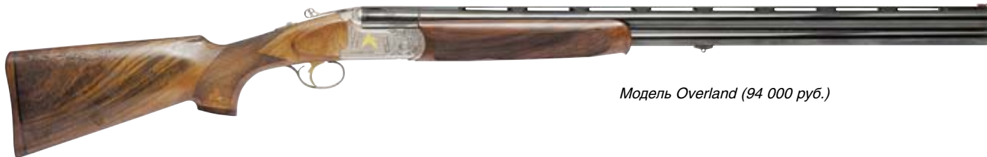
Модель Overland (94 000 руб.)

Следующие две модели, наоборот, занимают верхнюю «полку» ценовой шкалы и представлены ружьями Overland и Overland EL, обе с коробками, выполненными из сплава «Эргал», с характерными выступами на боковых стенках, а EL-ружья имеют необычайно для серийных моделей богатое художественное оформление, их стволы снабжены комплектами удлинённых внутренних чоков и длинными снарядами входами. Ложи изготовлены из ореха высокой категории, а затыльники прикладов из отборной древесины особо твёрдых пород.