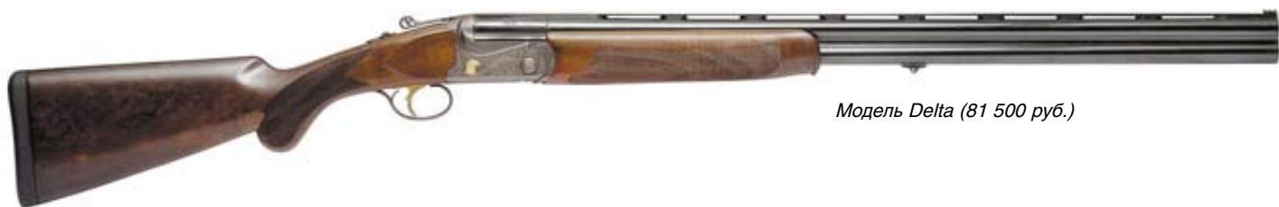
Модель Delta (81 500 руб.)