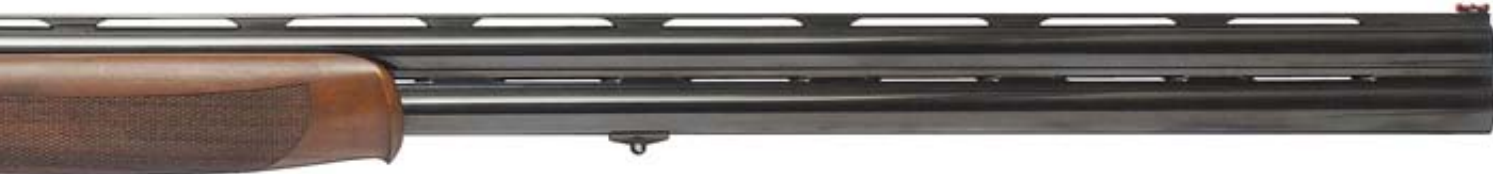
Модель Diamond De Luxe (70 500 руб.)