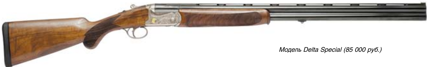
Модель Delta Special (85 000 руб.)