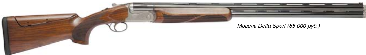
Модель Delta Sport (85 000 руб.)

Ружьё оснащено регулируемым по высоте гребнем приклада, имеет 3 резиновых затыльника различной толщины, позволяющие менять общую длину приклада, что очень удобно. Длина стволов 760 или 810 мм, снарядные входы каналов стволов стандартные, короткие, чоки специальные спортивные, выступающие за дульный срез стволов на 11 мм. Для исключения вероятности сдвоенного выстрела механизм инерционного разобщителя не позволяет спустить второй курок если не произошёл первый выстрел (осечка). Второй выстрел возможен только после перевода кнопки предохранителя в положение «включено» (на себя) и отжатия её в другую сторону и снятия с предохранителя (или можно симитировать «отдачу» несильным ударом затыльника о твёрдую поверхность). Прицельная планка широкая. Ствольная коробка стальная, серых тонов, с прекрасным рисунком растительного орнамента. На её нижней стенке – фирменная надпись «Bettinsoli» и фигура золотистого