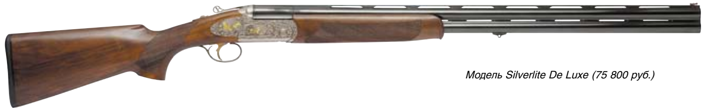
Модель Silverlite De Luxe (75 800 руб.)

вальдшнепа в полёте. Флажок рычага затвора без отверстий, цельный, стальной. Впечатляет совершенная форма спусковой скобы, широкий и удобный спусковой крючок золотистого цвета – фирменные признаки «от Bettinsoli». Ложа выполнена из ореха повышенной категории качества, шейка ложи спортивного типа, как и весь приклад. Приятная насечка, особенно оригинально выполнена на цевье. Ружьё хорошо сбалансировано и довольно посадисто. Приплетка краёв древесины к металлу коробки безукоризненная, ружьё в целом заслуживает высокой оценки.