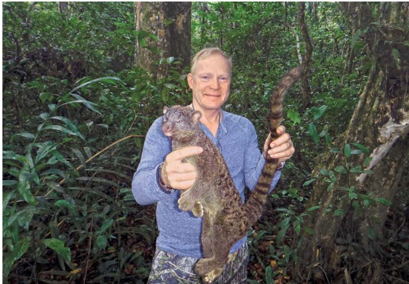
Это – пальмовая виверра, небольшой представитель кошачьих, уникальный для лесной зоны, который похож на помесь генетты и циветты с очень длинным хвостом