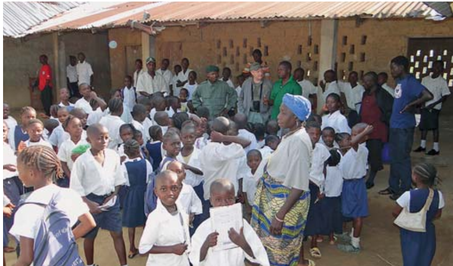
Охотники принесли в школу большого селения Зуие один из «синих пакетов», полных подарков от Международного сафари-клуба