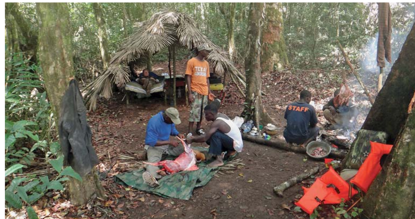
Хотя охотники Либерии практически не имеют опыта в трофейной охоте, свежевание дичи было выполнено отменно, а у аутфиттера было в запасе вполне достаточно соли для засолки шкур