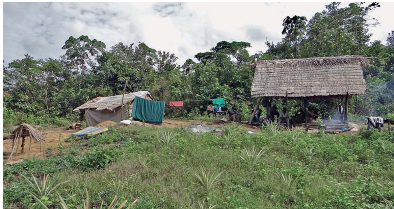
Это был самый уютный из наших полевых лагерей – хорошего размера хижины, крытые пальмовыми ветвями, где всем хватало места