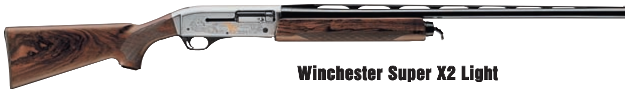
Winchester Super X2 Light