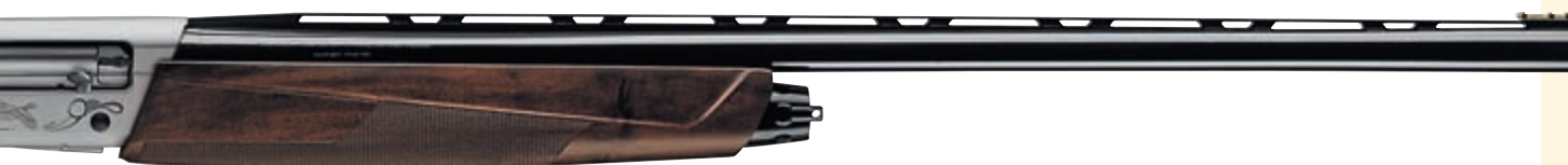
Browning Fusion Evolve II

и Испания установили режим протектората и взяли под контроль территорию страны. А с 1956 года была провозглашена независимость Королевства Марокко. Кстати,