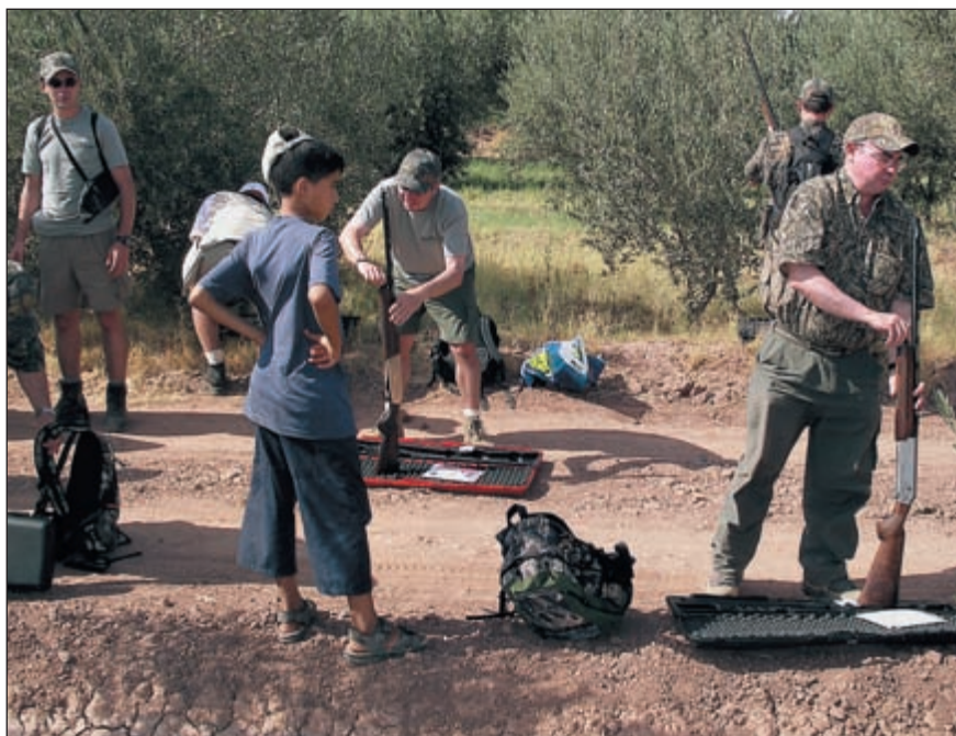
Сборы на охоту проходили под пристальными взглядами маленьких помощников из числа местного населения

Первые поселения людей на этой земле появились около трёх с половиной тысяч лет назад, и были это финикийские колонии. Затем на этой территории было Римское господство, какое-то время Марокко находилось в составе Византийской империи. И лишь в VII веке Марокко заселили арабы, когда возник ислам и был создан Халифат. Благодаря взаимодействию