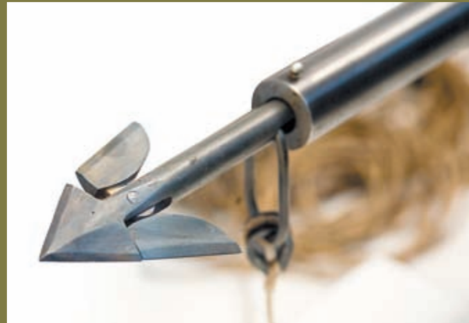
Гарпунное ружьё Vetterli кал. 12,17 мм

Иллюстрируя этот материал, я постарался подробно познакомить вас с оружейной частью экспозиции. А в заключение хочется сказать, что если у вас появится возможность посетить Осло, то рекомендуется побывать в этом музее. Интересно будет всем – и детям, и взрослым!