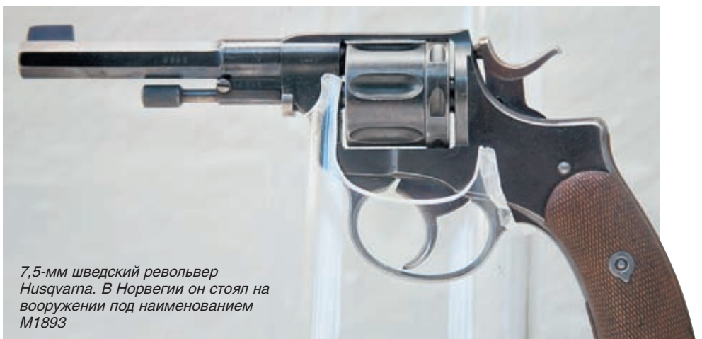
7,5-мм шведский револьвер Husqvarna. В Норвегии он стоял на вооружении под наименованием M1893

Можно подумать, что с помощью данных образцов оружия, команды этих мужественных людей преодолевали голод и встречающиеся опасности в виде дикой фауны и коренного