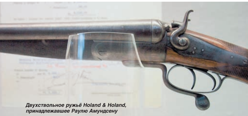
Двухствольное ружьё Holand & Holand, принадлежавшее Раулю Амундсену