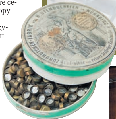
Старые немецкие капсюля