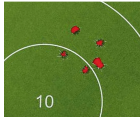
Некоторые результаты стрельбы из винтовок на дистанции 300 м. Первая и вторая мишени – Haenel RS8 K308, третья мишень – Rangemaster 308 G2. Диаметр «десятки» – 10 см