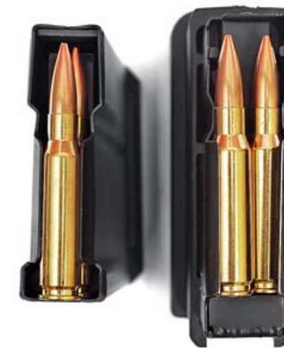
Двухрядный магазин «Хайнеля» обеспечивает возможность нормальной подачи патронов любой разумной длины