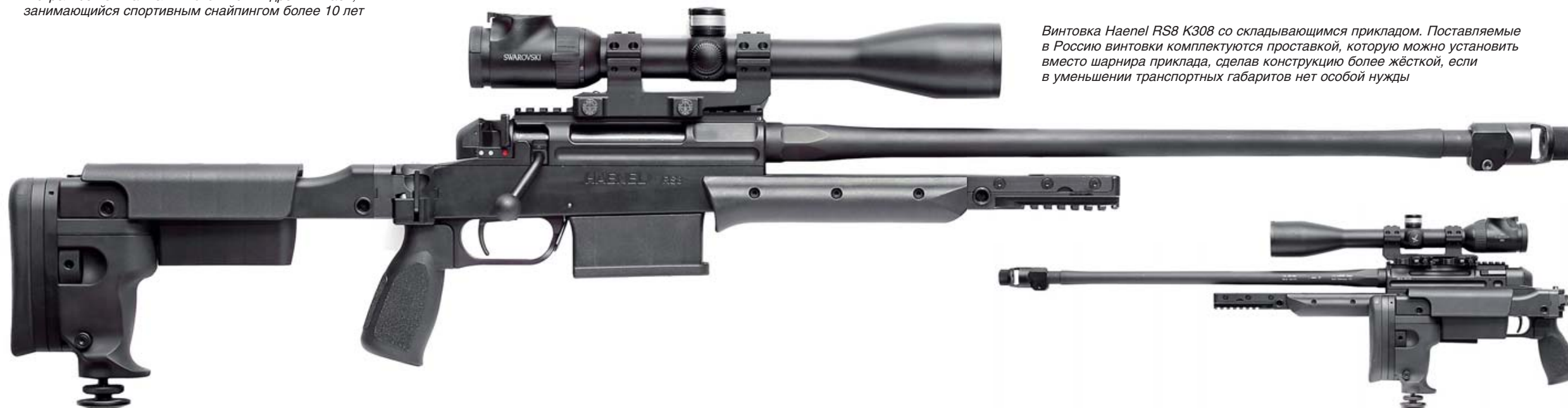
Винтовка Haenel RS8 K308 со складывающимся прикладом. Поставляемые в Россию винтовки комплектуются проставкой, которую можно установить вместо шарнира приклада, сделав конструкцию более жёсткой, если в уменьшении транспортных габаритов нет особой нужды