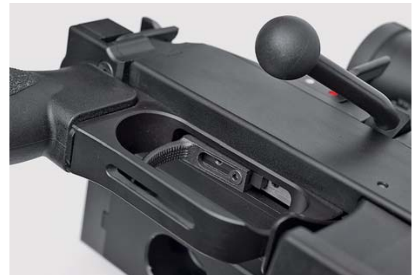
Спусковые механизмы обеих винтовок регулируемые, с заводской установкой около 1,5 кг. Оба спусковых крючка имеют возможность перемещаться по длине, что особенно важно для «Хайнеля» с довольно «худой» рукояткой управления огнём

Стреляли патронами RWS Target Elite .308 Win. с массой пули 10 г и 10,9 г. Стрельба производилась из положения сидя с упора и лёжа с упора.