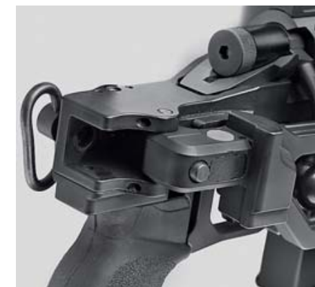
Шарнир приклада «Хайнеля» (верхний снимок) проще по устройству, но в английском варианте присутствует даже возможность регулировки, позволяющей устранить влияние износа деталей при интенсивной эксплуатации