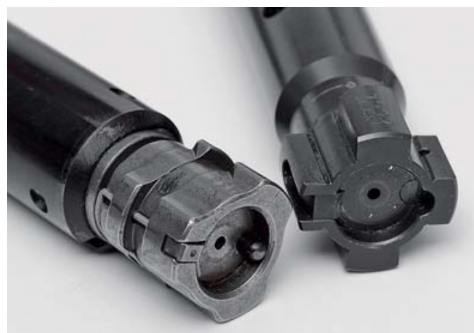
Затвор немецкой винтовки имеет три боевых упора, а у «англичанина» их четыре

На 100-метровой дальности оружие было приведено к нормальному бою. Нами планировалась стрельба на 600 и 800 метров, но дым от тлеющей травы вынудил ограничиться дистанцией 300 метров, где были установлены щиты с грудными зелёными мишенями.