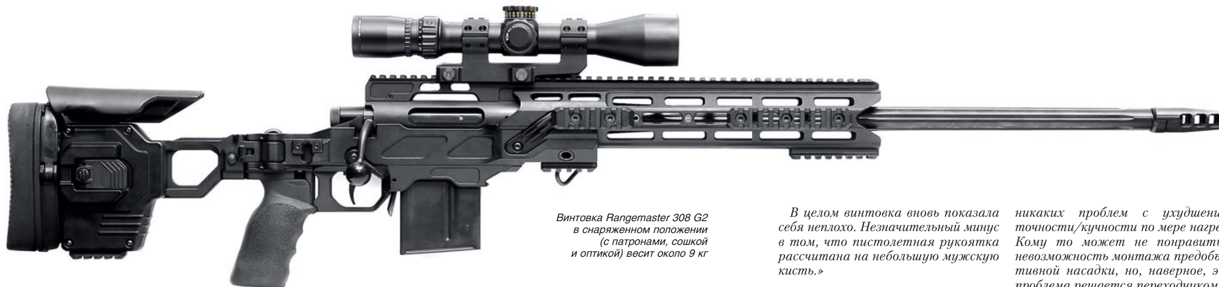
Винтовка Rangemaster 308 G2 в снаряженном положении (с патронами, сошкой и оптикой) весит около 9 кг