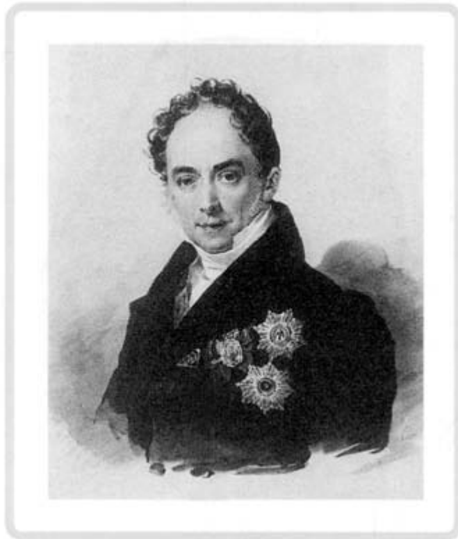
Князь В. П. Кочубей

По получении жителями из арсенала ружей городничие и исправники должны были представить военному губернатору список, «...сколько каждый таковыхъ получилъ и на столько ли дано ему было свидетельство» . Без разрешения военного губернатора запрещалось иметь больше оружия, чем было выдано. В случае необходимости