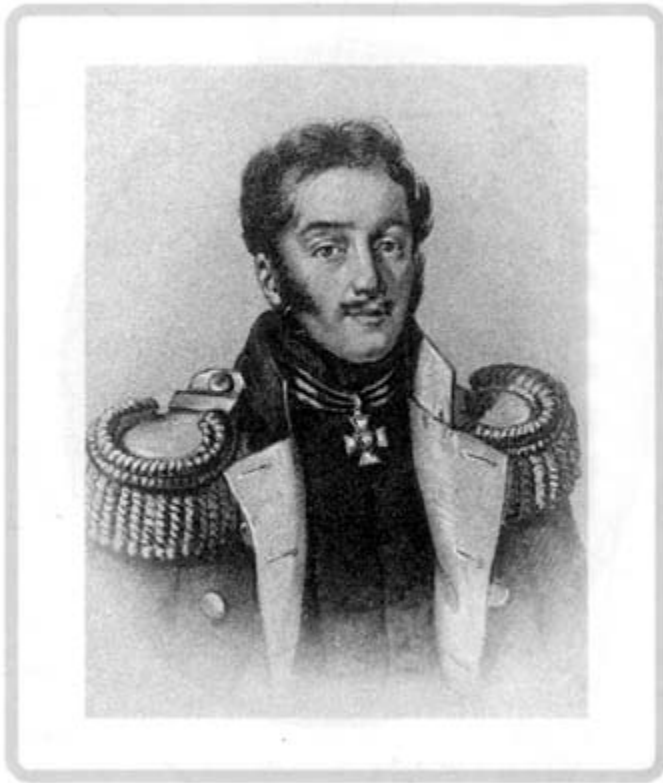
Варшавский военный губернатор граф И. О. Витт

приобрести оружие, для получения разрешения военного губернатора следовало обращаться к городничим и исправникам. Последние, в случае, если к ним обращался помещик, испрашивая у военного губернатора разрешения, должны были сообщать, сколько за ним «числится душ и сколько» он намерен купить ружей.