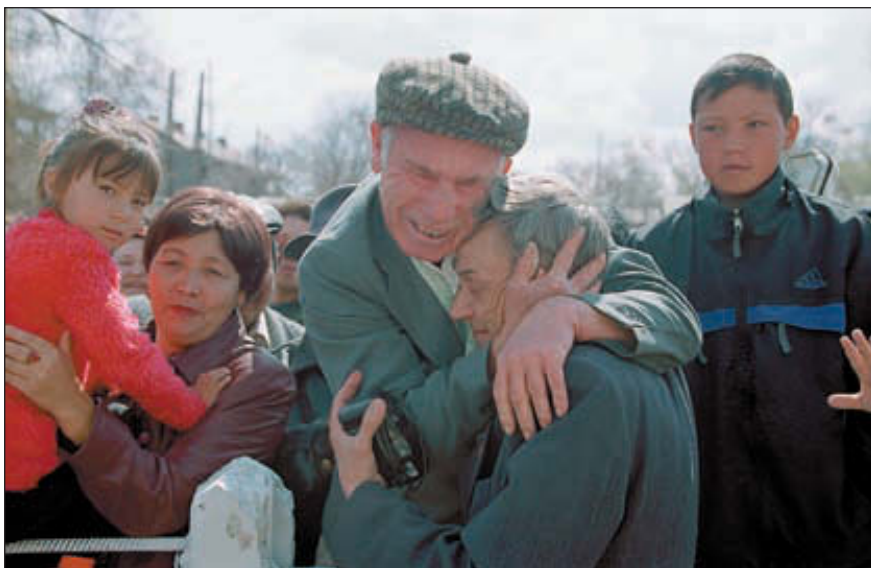
Встреча старых товарищей – они не виделись 46 лет!