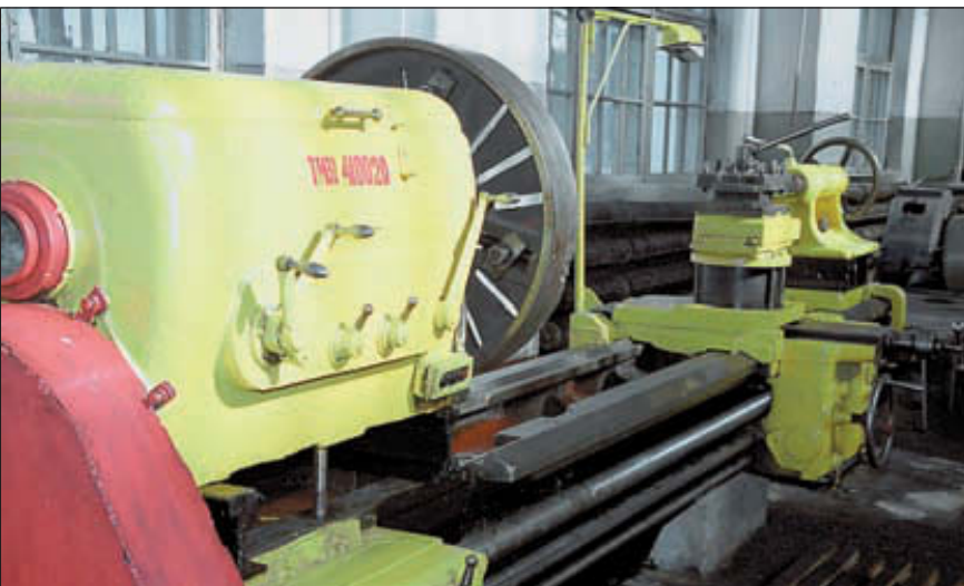
Говорят, именно на этом станке изготавливались детали первого пистолета-пулемёта Калашникова. Судя по его размерам – вряд-ли. Несомненно то, что в начале 40-х годов прошлого века этот агрегат трудился в железнодорожном депо станции Матай и стал свидетелем рождения первого образца оружия Калашникова

Удивительно, но в школе этого маленького посёлка учатся более 800 детей! И все они гордятся своими земляками – конструкторами-ору-