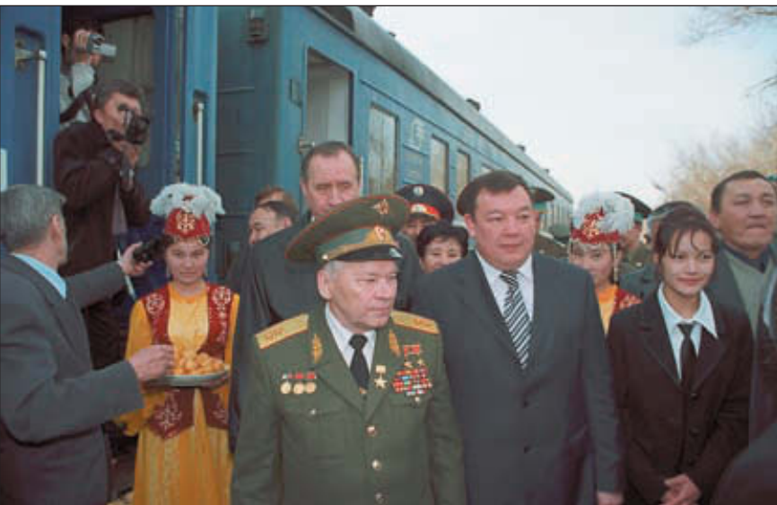
Прибытие на станцию Матай

первое офицерское звание получали в советских военных училищах. Правда, за последние 10 лет многие из них успели пройти подготовку в США. И, тем не менее, каждый год в российских военных вузах прибавляется около сотни курсантов из Казахстана.