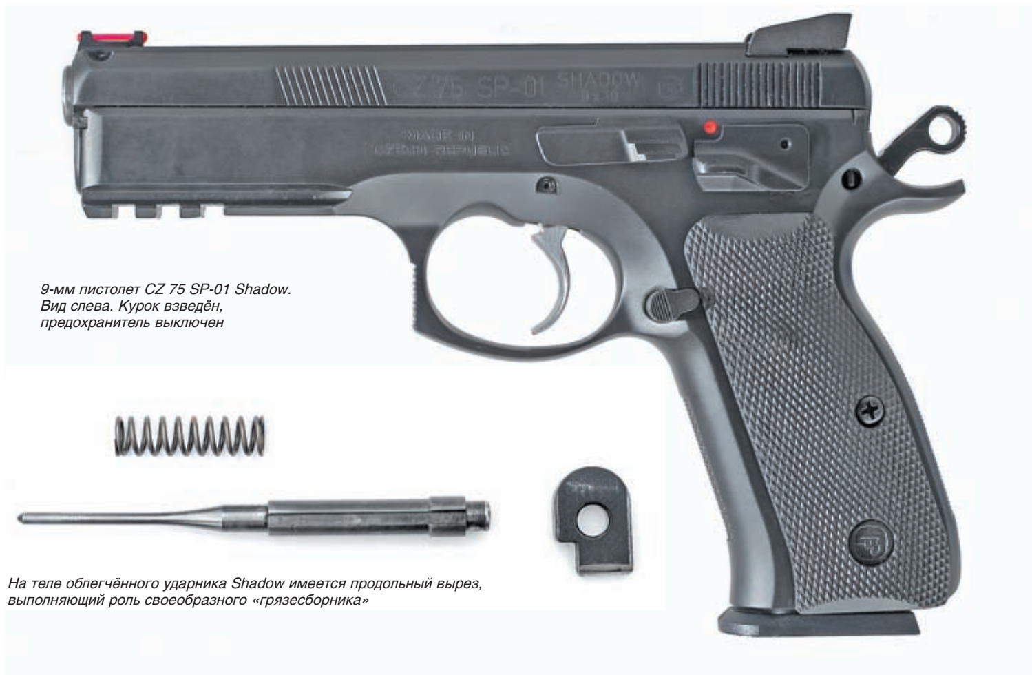
9-мм пистолет CZ 75 SP-01 Shadow. Вид слева. Курок взведён, предохранитель выключен