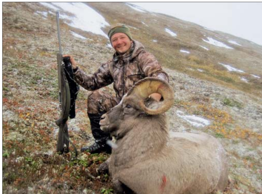
Снежный баран – один из самых престижных трофеев в мире. В России их семь видов

В последнее время модным трендом стали разговоры о полном развале охоты и охотничьего хозяйства в России и о полной бесперспективности этой отрасли. И если первый тезис – это состоявшийся факт, что вот второй – как минимум, спорен.