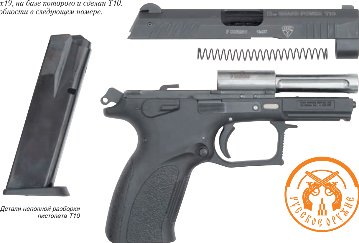
Детали неполной разборки пистолета Т10

«Русское оружие» – (812) 273 89 10 «Бушель» – (812) 430 98 19 «Оружейная палата» – (812) 714 17 65 «Снайпер» – (81370) 3 21 10 «Беркут» – (812) 542 22 20 «Ружьё» – (812) 560 52 94