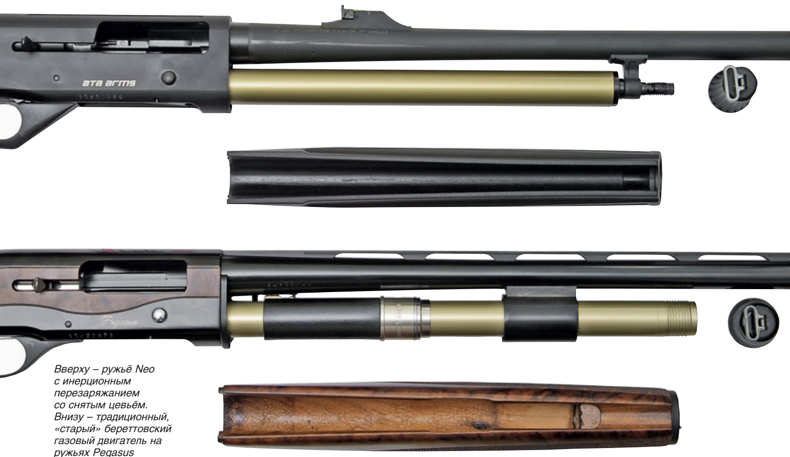
Вверху – ружьё Neo с инерционным перезаряданием со снятым цевьём. Внизу – традиционный, «старый» береттовский газовый двигатель на ружьях Pegasus