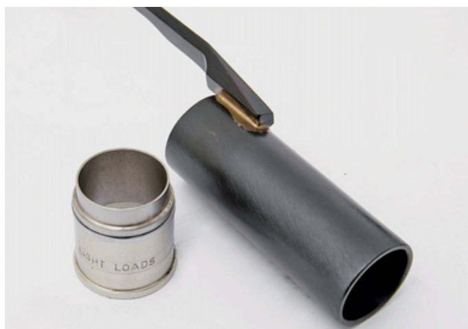
Хорошо узнаваемые по «Беретте» 300-й серии детали газового двигателя ружей Pegasus: сменный газовый поршень и шток с тягой