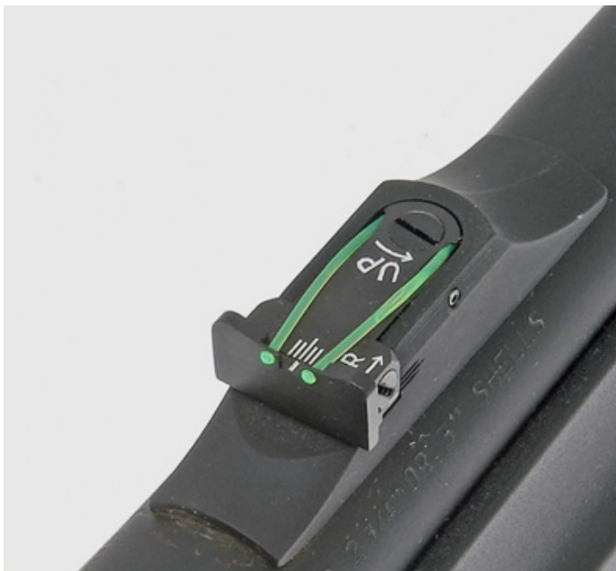
Регулируемый открытый механический прицел, устанавливаемый на стволах ружей типа Slug (под пулевые и картечные патроны). Прицел оборудован «светящимися» точками по краям прорези прицельной планки

За окном – рано наступившая осень, предзимье – начало охот на копытных. Лично я теперь уже не особенно предпочитаю загонные охоты, но опять же, как отказать своему родному коллективу и уважаемому всеми его председателю? Поскольку охотхозяйство расположено недалеко от города, то его уголья обильно посещают любители «третьей» охоты – по грибы и ягоды, а также лесные орехи, урожай которых на Северо-Западе в этом году богат. И как явиться на такую охоту с карабином? Нужно гладкоствольное самозарядное ружьё со стволом под пулевые патроны 12 калибра, которых в ассортименте АТА Arms целых четыре: два с инерционной автоматикой – Neo 12 Slug и Neo 12 Combo и два с газоотводным механизмом перезарядки, модели Pegasus Slug и Pegasus Combo. Пулевой ствол этих ружей имеет цилиндрическую сверловку и оборудован открытым механическим прицелом. Его регулируемая прицельная планка «светится» двумя точечными светлячками зелёного цвета, как и «светящаяся» мушка красного цвета.