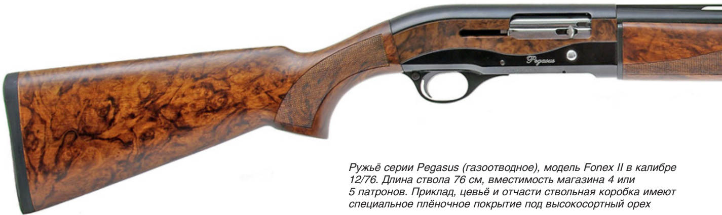
Ружьё серии Pegasus (газоотводное), модель Fopex II в калибре 12/76. Длина ствола 76 см, вместимость магазина 4 или 5 патронов. Приклад, цевьё и отчасти ствольная коробка имеют специальное плёночное покрытие под высокосортный орех