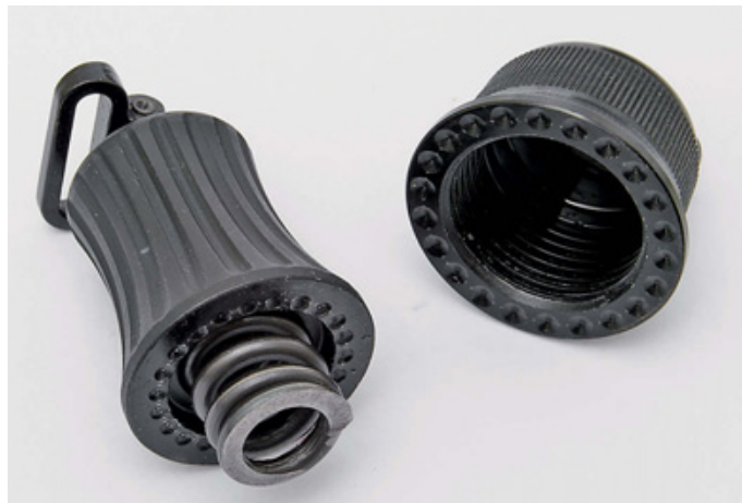
Гайки цевья: слева – ружей серии Neo, справа – серии Pegasus

В завершении этого краткого обзора новинок Ata Arms необходимо отметить также и большой выбор ружей в разнообразной отделке ствольных коробок, а также лож, как в дереве, так и особенно в пластмассе,