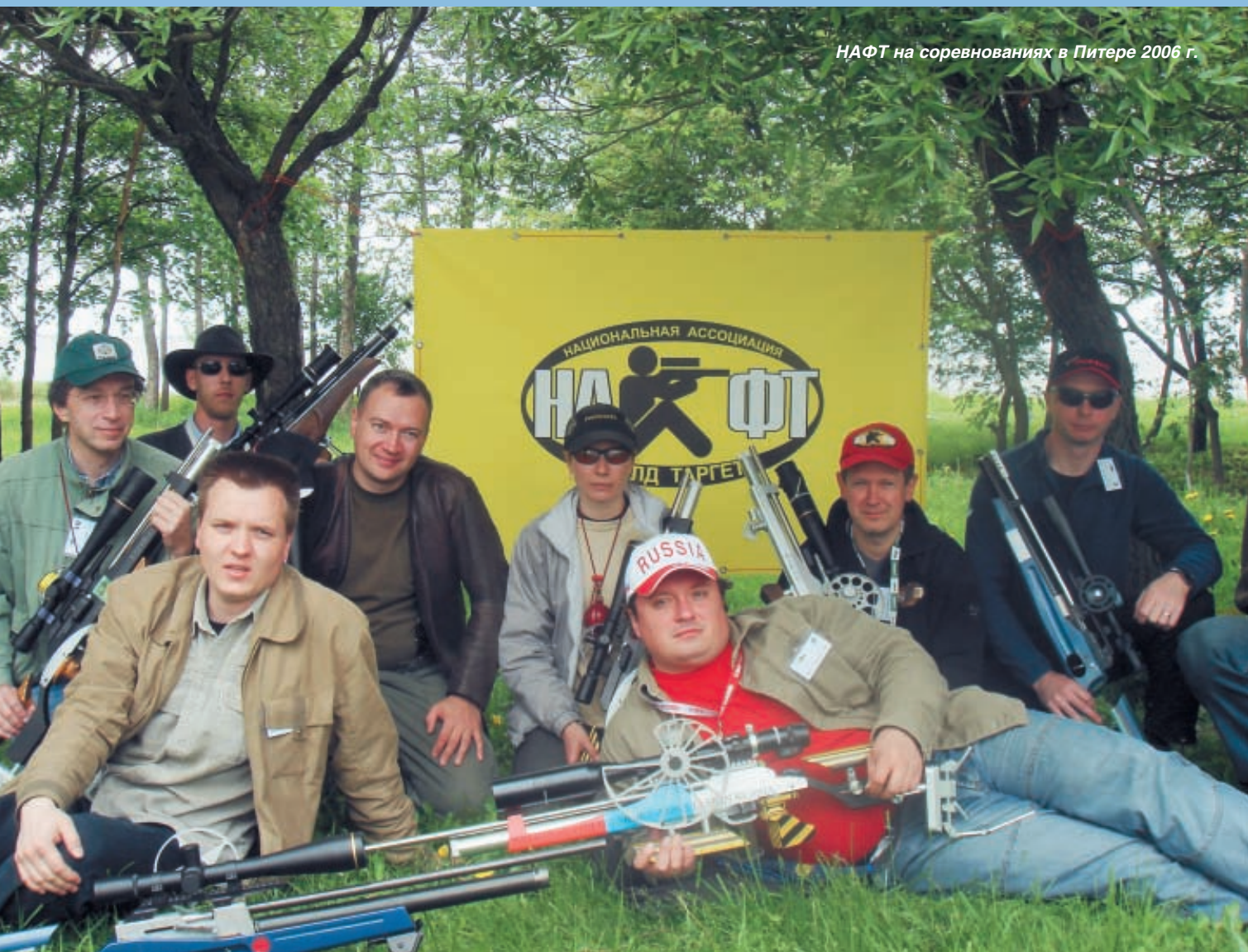
Максим Матвеев президент Национальной ассоциации филдтаргета