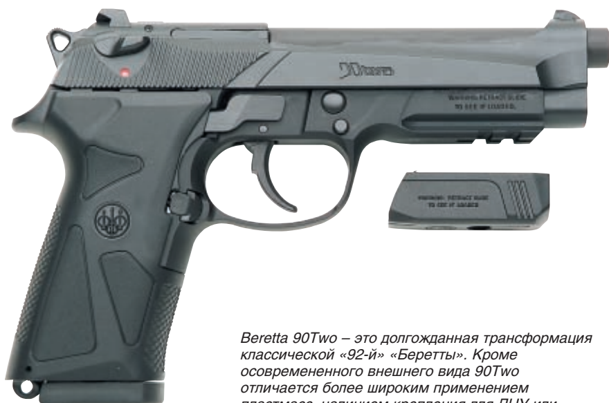
Beretta 90Two – это долгожданная трансформация классической «92-й» «Беретты». Кроме современного внешнего вида 90Two отличается более широким применением пластмасс, наличием крепления для ЛЦУ или фонаря, которое закрывается пластмасовой крышкой (совершенно не нужной на наш взгляд)

И в конце ещё одна заметная новость из Италии: крупное соглашение между «Консорциумом Колтелинаи Маньяго» (консорциум,