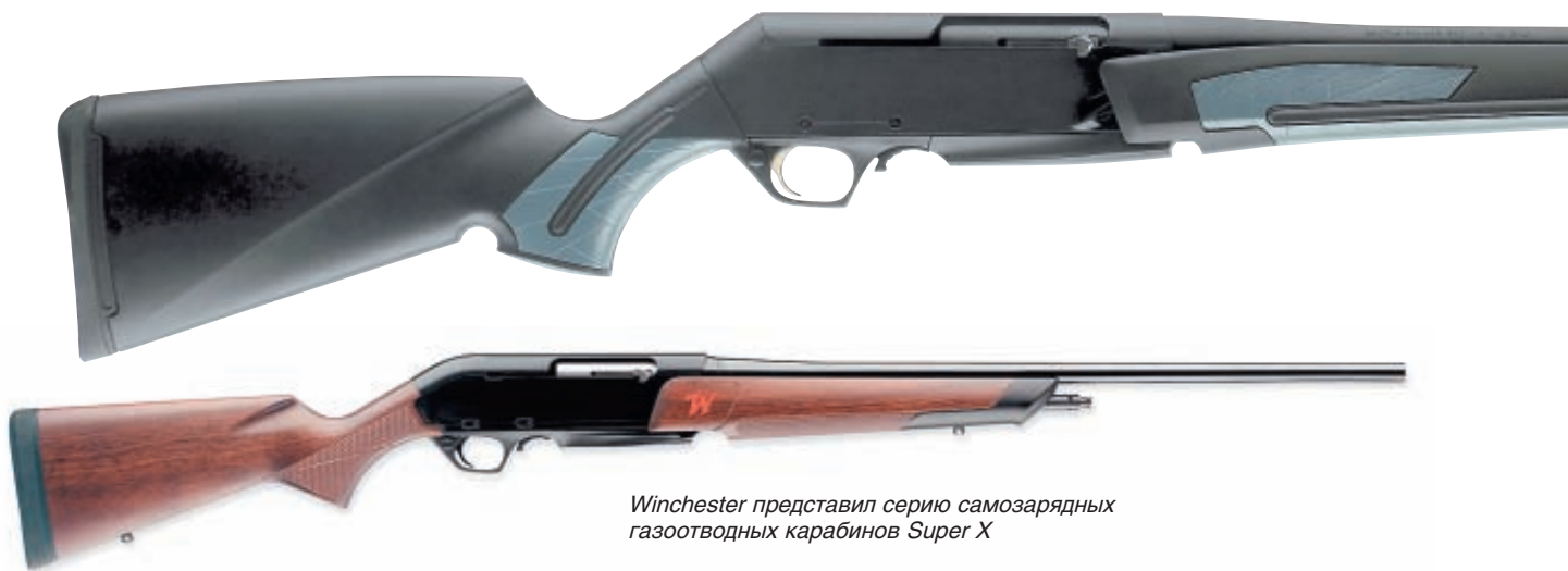
Winchester представил серию самозарядных газоотводных карабинов Super X

в результате соглашения между легендарным российским заводом и американским гигантом. Ситуация наглядно показывает, к чему могут привести 10 лет плодотворного сотрудничества.