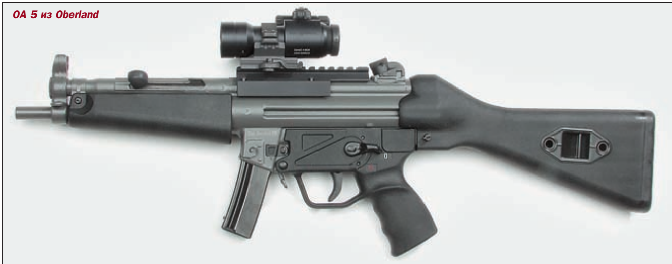
ОА 5 из Oberland

От образца требовалась надёжность функционирования при температурах от -40^{\circ}\text{C} до +43^{\circ}\text{C} , ударно-спусковой механизм должен обеспечивать возможность ведения и одиночного, и автоматического огня. Вместимость магазина – 30 патронов, масса не более 3,75 кг.