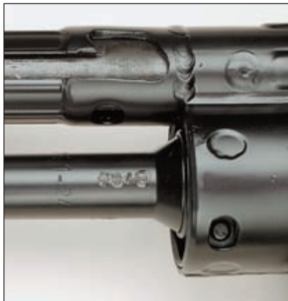
Казённая часть ствола VT 96 с испытательным клеймом ФРГ. На стволе маркировка изготовителя – МКЕ 1-24. На BWT 5 (внизу) рядом с австрийским испытательным клеймом также обнаруживается маркировка МКЕ 1-24. Стволы имеют общего изготовителя

Фирма Beitler Waffentechnik предлагает подобное оружие под наименованием BWT 5. Затвор имеет такие же размеры, как и на VT 96.