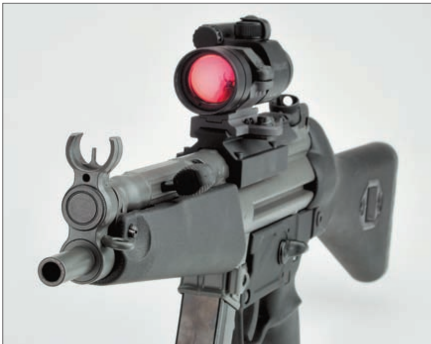
Кольцо мушки на ОА 5 сверху открыто и не перекрывает поле обзора коллиматорного прицела Aimpoint CompS 4 MOA

такого оружия сегодня можно приобрести свободно. И «soft-пневматика» может теперь иметь вид боевого оружия настолько, насколько этого пожелает владелец. ВКА удостоверяет, что ВТ 96, а тем самым и конструктивно аналогичный ОА 5, не являются боевым оружием. По организационным причинам для ВВТ 5 такого решения ещё нет, хотя до сих пор ВКА не классифицировала его как боевое. Поэтому данное оружие может приобретаться гражданами, если может быть доказана потребность в нём.