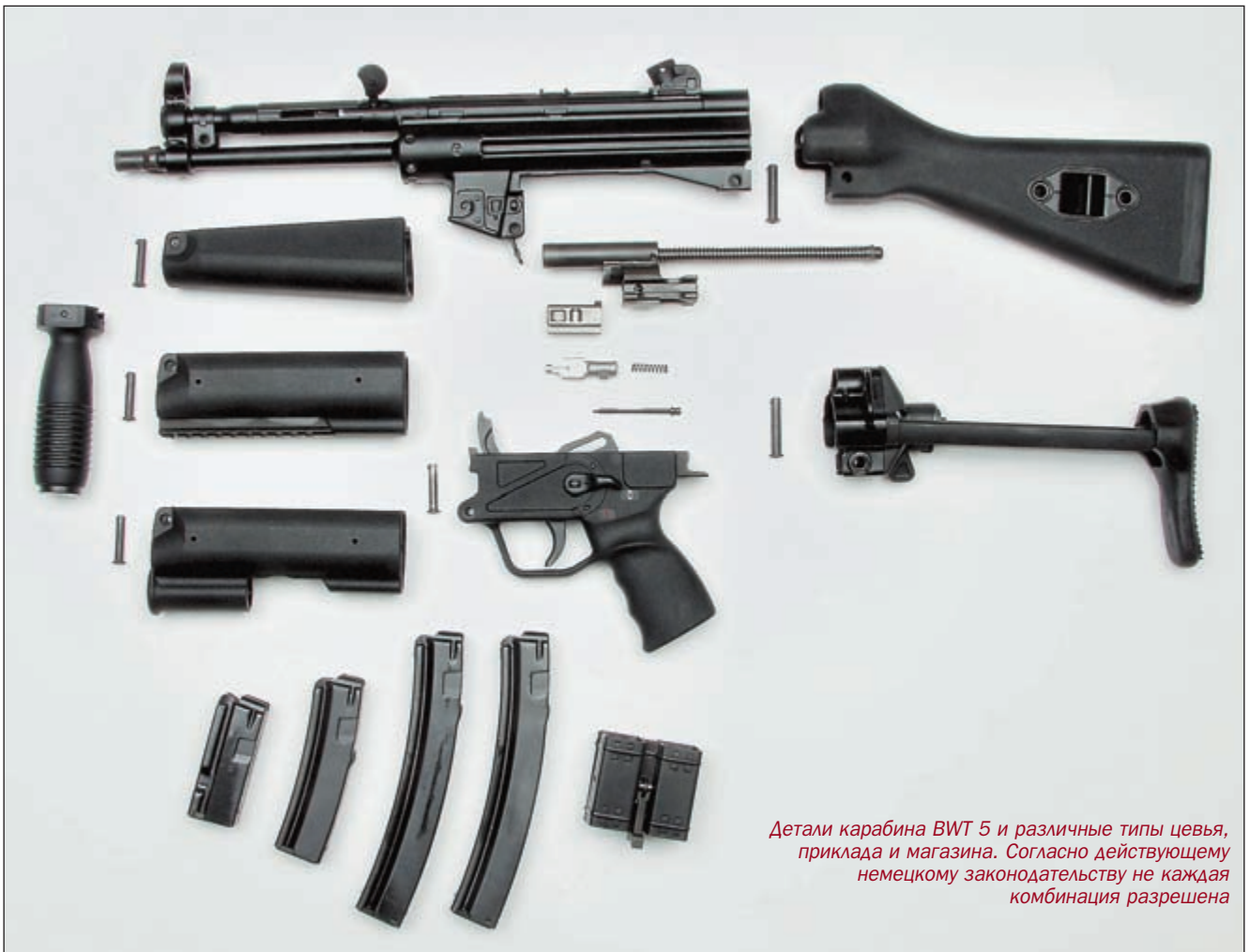
Детали карабина WWT 5 и различные типы цевья, приклада и магазина. Согласно действующему немецкому законодательству не каждая комбинация разрешена

Выстрел при закрытом затворе должен обеспечивать высокую точность. После прогрева серий выявилась разница в кучности стрельбы как между образцами оружия, так и, прежде всего, между типами патронов. Результаты стрельбы зависят, в основном, от применяемых патронов. Особо точными показали