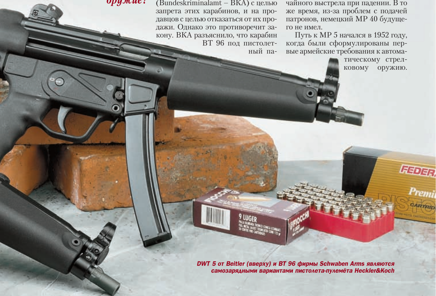
DWT 5 от Beitel (вверху) и ВТ 96 фирмы Schwaben Arms являются самозарядными вариантами пистолета-пулемёта Heckler&Koch

Путь к MP 5 начался в 1952 году, когда были сформулированы первые армейские требования к автоматическому стрелковому оружию.