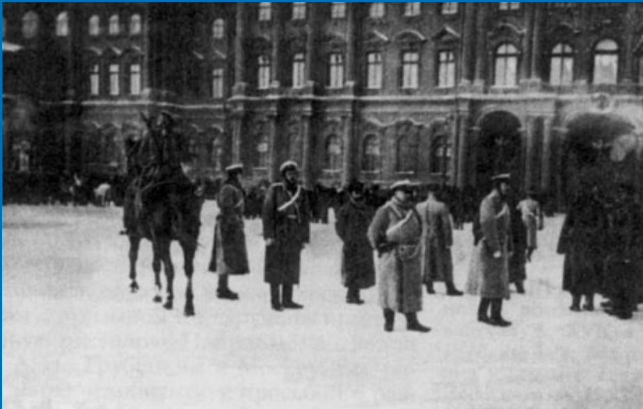
Войска на Дворцовой площади Санкт-Петербурга 9 января 1905 года

Например, в октябре 1905 года Новгородским губернатором был получен очередной секретный циркуляр Департамента полиции, который, правда, шёл аж с 8 августа: «Из полученных за последнее время из разных мест Империи сведений усматривается, что наблюдались случаи вооружения крестьян револьверами. Хотя и нет достаточных указаний, чтобы оружие это приобреталось с какой-либо преступной целью, но, имея в виду отсутствие какого-либо применения подобного оружия в крестьянском обиходе, является очевидным, что ими револьверы приобретаются без всякой надобности, при случае, в виде игрушки. Во всяком случае в настоящее тревожное время, когда возникновение беспорядков всегда возможно и среди крестьян, вооружение их огнестрельным оружием может привести к нежелательным осложнениям, Департамент полиции считает нужным обратить внимание Вашего Превосходительства на выше приведённое обстоятельство». Всё, что мог сделать губернатор, так это постановить «При всяком удобном случае подвергнуть отобранию для уничтожения», о чём через 2-3 дня было сообщено Приставам для исполнения.