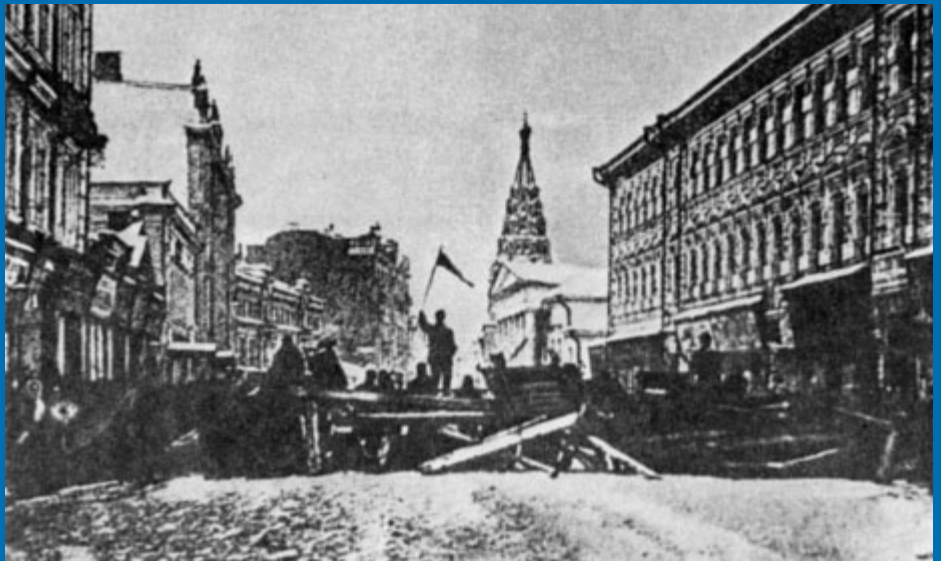
Баррикады 1905 года. События 1905 года ускорили распространение появившихся в ряде регионов в конце XIX века временных мер по контролю за оружием на большей (если не на всей) территории России