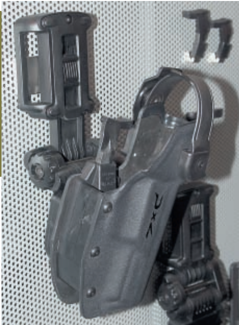
Слева. Полимерная кобура от Radar. Вид справа. Видна запирающая клавиша, позволяющая извлекать пистолет одним движением, и предохранительная скоба, препятствующая несанкционированному захвату пистолета. Видна конструкция универсального подвесного устройства