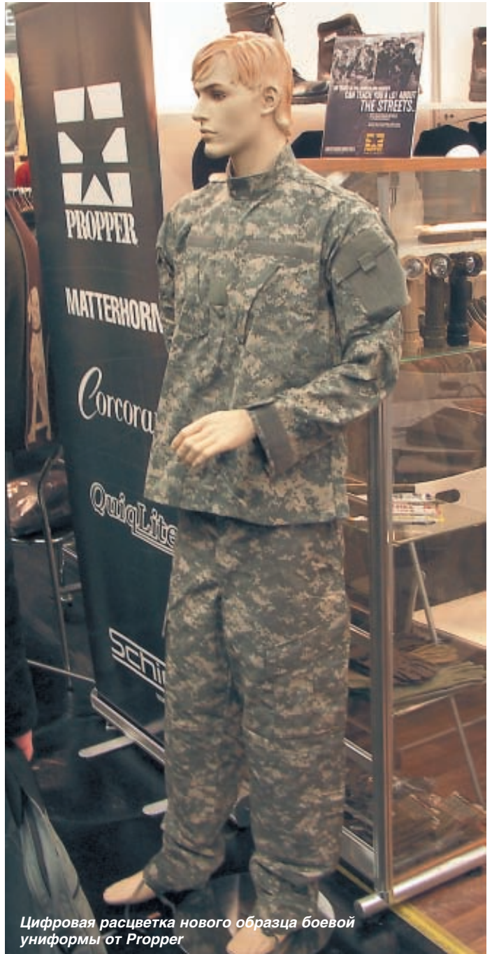
Цифровая расцветка нового образца боевой униформы от Propper

Кроме современных материалов в изделиях большинства коллекций одежды для охоты большое внимание уделено и вопросам визуальной заметности охотника. Не секрет, что одна из опасностей охоты – это «дружественный огонь» со стороны коллег-охотников. Особенно это характерно групповой охоте, причём как в лесу, так и в камышах.