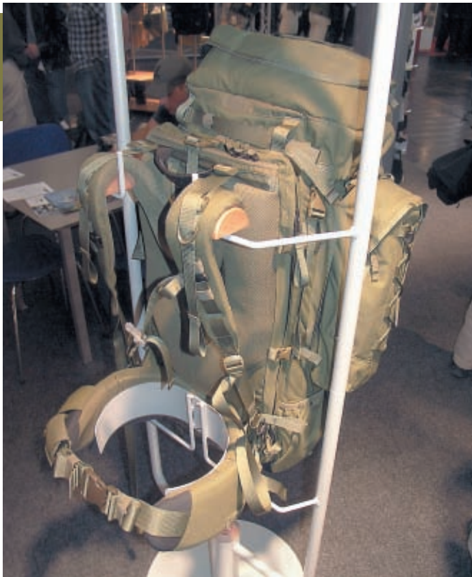
Так показывает рюкзаки Tasmanian Tiger . На стенде 120-литровый экспедиционный рюкзак TT Plus . Видны съёмные боковые карманы, усиления спины, «молния» снимаемого основного объёма и усиленный грузовой пояс

Помимо новых материалов верха, в первую очередь пространственных сетчатых структур и их комбинаций, выполненных на основе CoolMax и Corduga , отмечу и новые нескользящие материалы подошв, и рисунки протекторов.