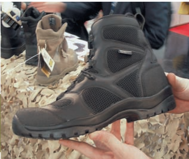
Тактическая обувь от Blackhawk!. Заметны объёмная сетчатая структура верха ботинка, усиления зон риска из окрашенной кожи, усиления носка и задника нескользящим полимером. Шнуровка представлена системой быстрого регулирования и элементами ослабления шнуровки в районе подъёма

К числу новаций применяемых материалов обращало на себя внимание использование (например, Blackhawk!) вентилируемых материалов на основе многослойных сетчатых структур и объёмных негигроскопичных материалов. Последние, по словам специалистов, не только обеспечивают комфорт при длительном пребывании в обуви в условиях жаркого климата, но и надёжно фиксируют голеностопный сустав. Не последнюю роль здесь играет и продуманная система стабилизации стопы, увязанная как с особенностями применяемых материалов, так и с функциональными свойствами подошвы и протектора.