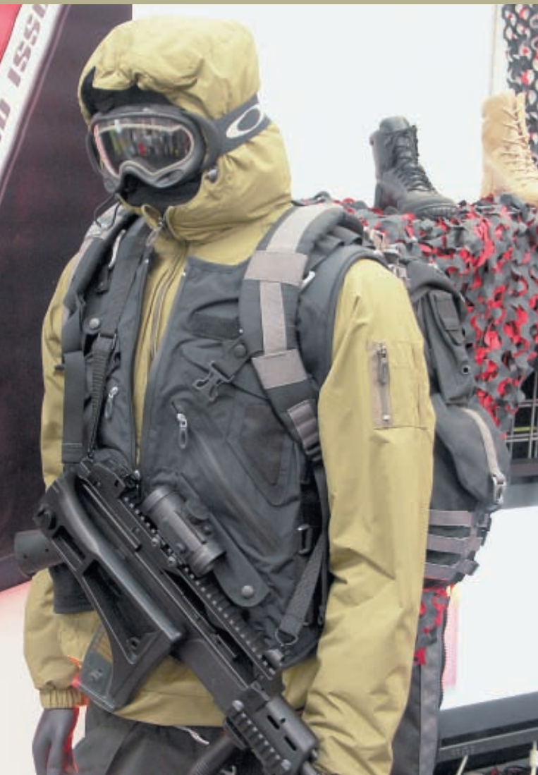
Образ профессионала безопасности от Oakle. Видны защитные баллистические очки, одежда из мембранных материалов, боевой транспортный жилет Halo в версии для прыжков