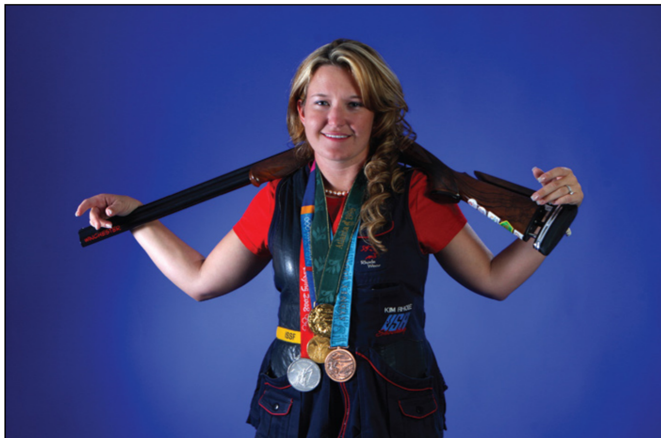
Если Ким Роуд удастся завоевать медаль на Олимпиаде 2012 г. в Лондоне, то она станет первой американской спортсменкой, добившейся медалей в личном зачёте на пяти Олимпиадах.

она была обладательницей двух золотых и одной бронзовой олимпийских медалей в упражнении «дабл-трап» на траншейном стенде, а также одной серебряной медали на круглом стенде («скит») для женщин. В апреле 2011 г. она завоевала золотую медаль среди женщин на круглом стенде в Сиднее (Австралия) на Кубке мира Международной федерации спортивной стрельбы (ISSF World Cup) и уже обеспечила себе место в сборной