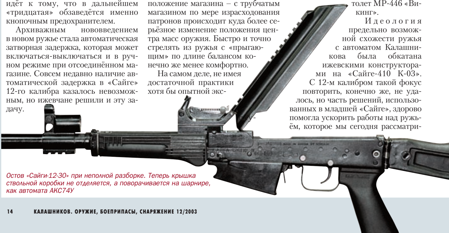
Остов «Сайги-12-30» при неполной разборке. Теперь крышка ствольной коробки не отделяется, а поворачивается на шарнире, как автомата АК74У

На самом деле, не имея достаточной практики хотя бы опытной экс-