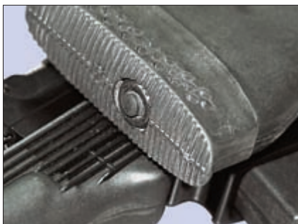
Приклад раскладывается при нажатии на кнопку в затыльнике приклада