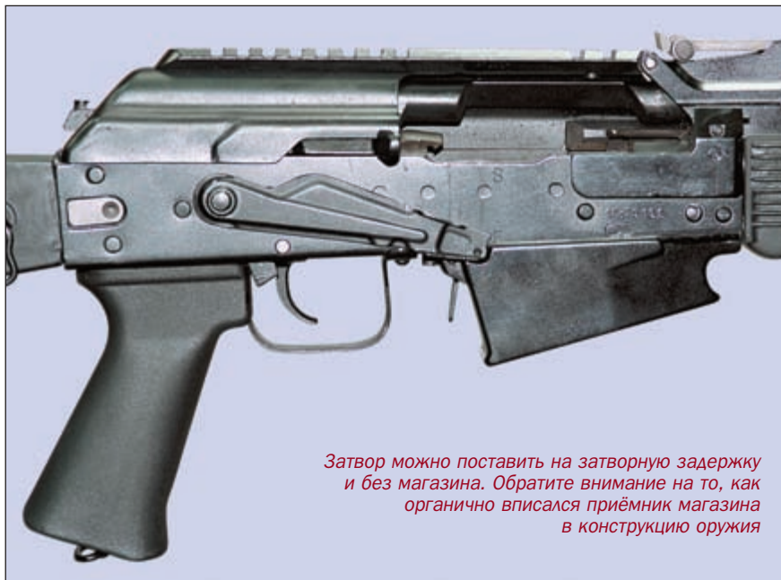
Затвор можно поставить на затворную задержку и без магазина. Обратите внимание на то, как органично вписался приёмник магазина в конструкцию оружия

И это не пустые слова. Презентации «Сайги» на выставках РОСТ и «Интерполитех», на петербургском фестивале «Сайги» проведены не для галочки. Видно отношение «ижмашевцев» к своему питомцу.