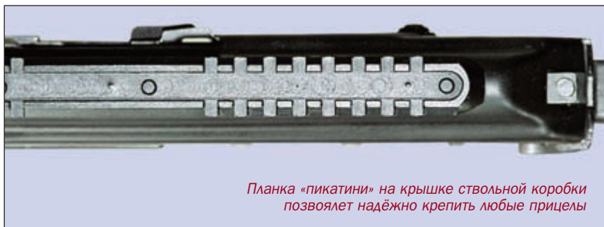
Планка «пикатини» на крышке ствольной коробки позволяет надёжно крепить любые прицелы

Резиновый затыльник-амортизатор (вместо «родного» металличе-