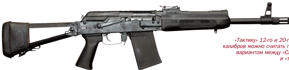
«Тактику» 12-го и 20-го (на фото) калибров можно считать переходным вариантом между «Сайгой-12 К» и «тридцаткой»