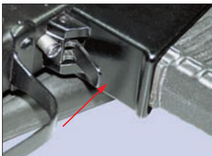
За защёлкой магазина находится кнопка (показана стрелкой) принудительной постановки затвора на задержку