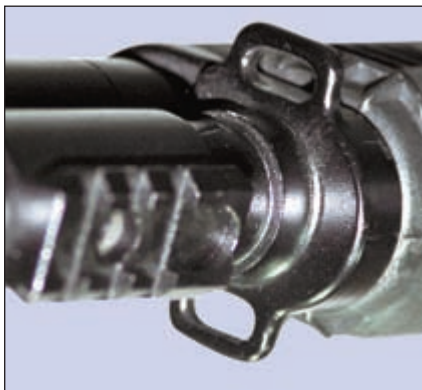
Для удобства передняя антабка дублирована. Под газовой камерой расположена планка для присоединения ЛЦУ или фонаря