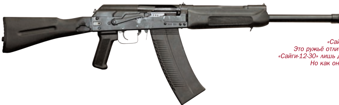
«Сайга-12 К». Это ружьё отличается от «Сайги-12-30» лишь деталями. Но как они важны!

В общем, подведём черту, «Сайга-12-30» – это гладкоствольное самозарядное ружьё с корбочатым ма-