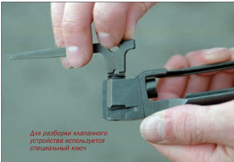
Для разборки клапанного устройства используется специальный ключ