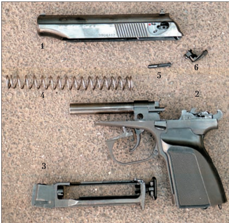
Детали пистолета МР-654К:

1 - затвор, 2 - рамка со стволом, 3 - «магазин» с клапанном устройством, 4 - возвратная пружина, 5 - ударник, 6 - предохранитель