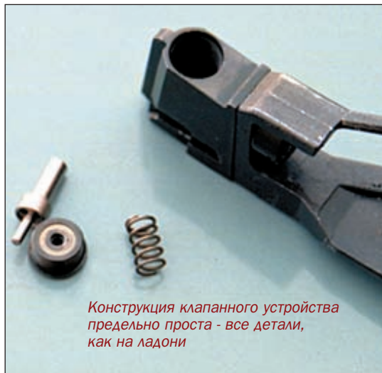
Конструкция клапанного устройства предельно проста - все детали, как на ладони

заднее положение и при этом происходит взведение курка. Задержка пистолета выполняет скорее декоративную функцию, хотя при желании, затвор можно зафиксировать в заднем положении, отжав её вверх.