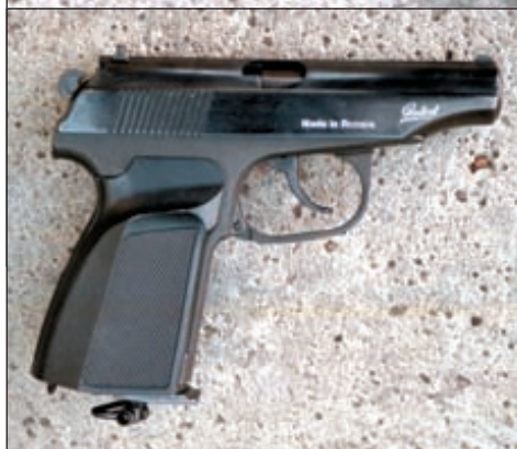
На первый взгляд пневматическую сущность МР-654К выдают только маркировка на затворе и наличие антабки на дне магазина

МР-654К от «ПМ» сводятся к меньшему диаметру канала ствола, видимому на дульном срезе и «лишней» антабке, скрывающей зажимной винт баллончика. Менее заметны проточка в курке и разрезной «патронник» в окне затвора. Клеймение на левой стороне затвора так же от-