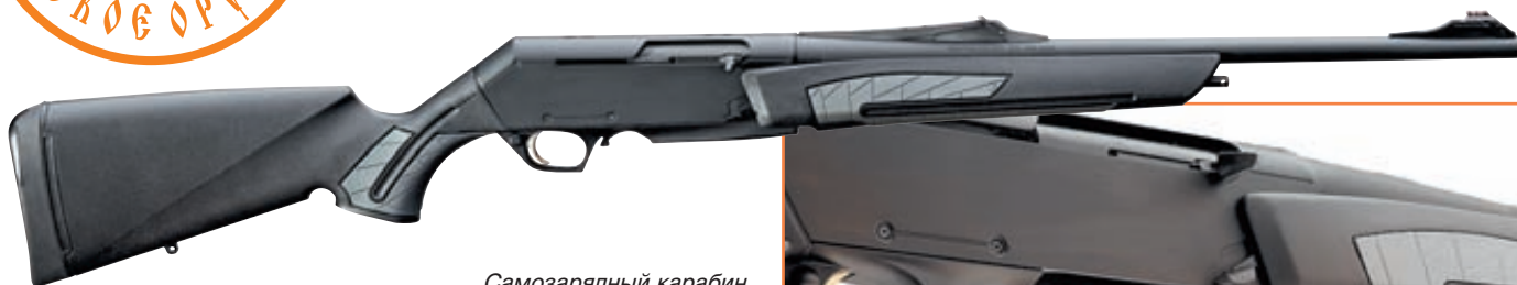
Самозарядный карабин BAR ShortTrac/LongTrac Composite