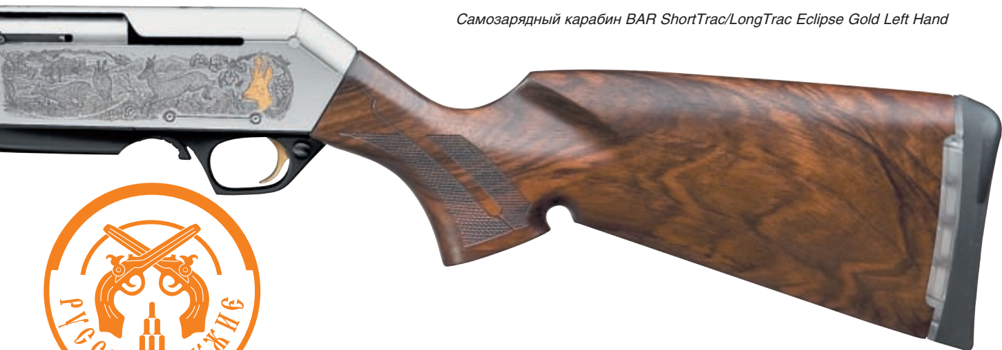
Самозарядный карабин BAR ShortTrac/LongTrac Eclipse Gold Left Hand