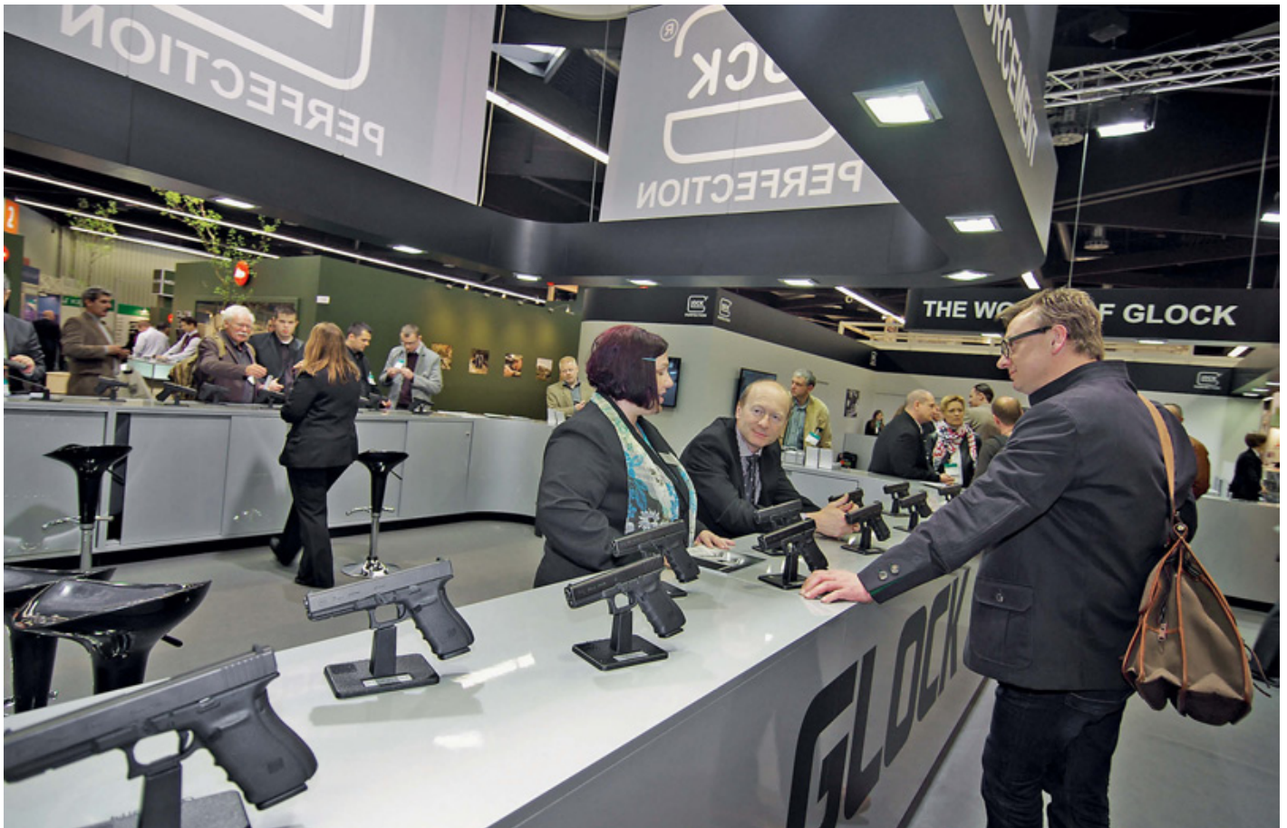
Один из самых посещаемых пистолетных стендов на IWA – экспозиция компании Glock. Вроде бы ничего нового, но в мелочах австрийцы продолжают совершенствовать и саму конструкцию и модельный ряд