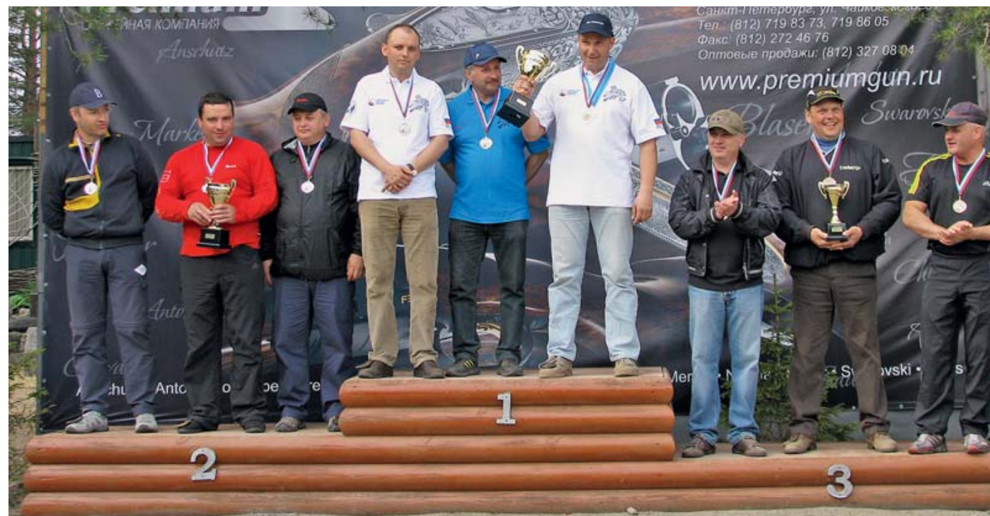
Чемпионы и призёры командного первенства: СК «Невский-1», СЦ «Демидовский» и ПСК «Северянин-1»

Отдельное спасибо спонсорам соревнований, имена которых несли линии стрельбы. Это уже упомянутая компания Dext, а также «Оружейная линия», «Левша», «Феттер», RESTO, «Азот», «Премиум» и AFIYET. До новых встреч!