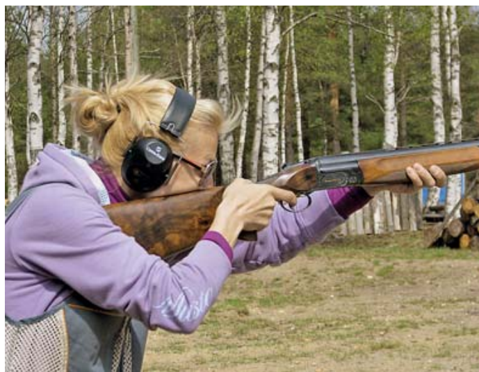
Стреляет серебряная медалистка чемпионата Наталья Колячко