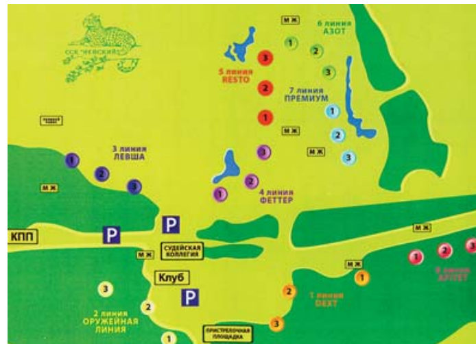
Соревнования проводились на базе ССК «Невский». Стрельба проходила на восьми маршрутах (линиях) и включала 24 стрелковых места