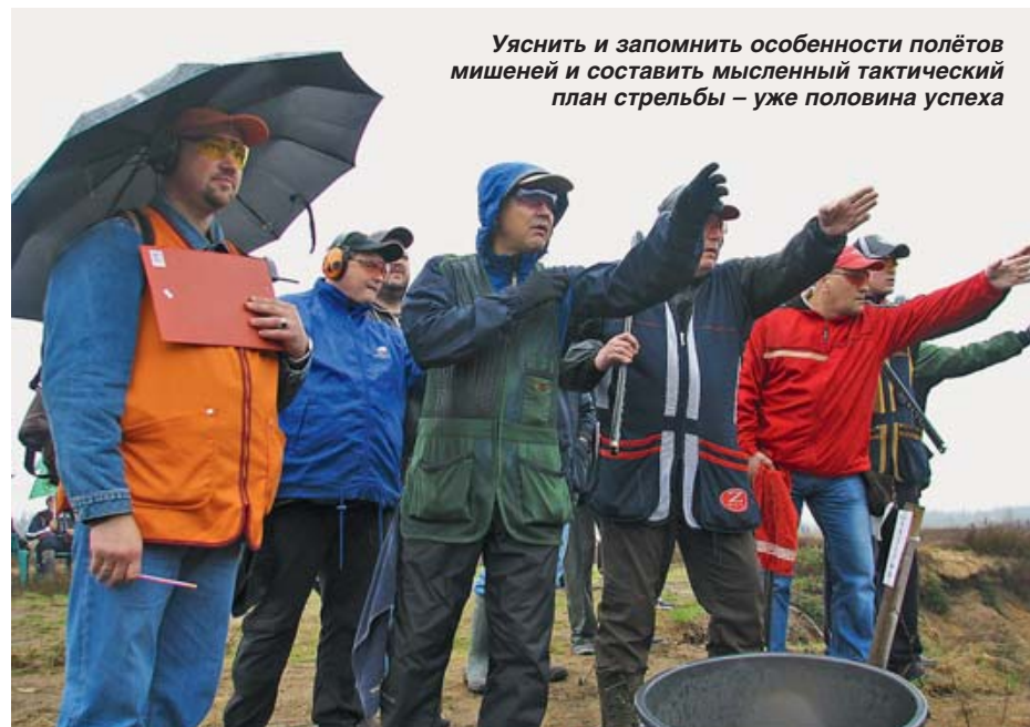
Уяснить и запомнить особенности полётов мишеней и составить мысленный тактический план стрельбы – уже половина успеха