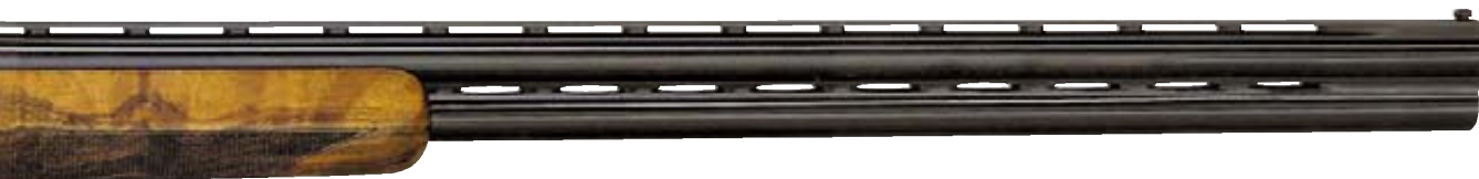
По мнению руководителя компании, Kronos – перспективное спортивное ружьё с большим будущим

Ну и, наконец, нельзя пропустить настоящую классику от Zoli – двуствольную горизонталку, знаменитую базовую модель Vulcano и её модификацию Vulcano Record. На изготовление этого ружья высокого разбора, отличающегося элегантностью и завершённостью, уходит свыше