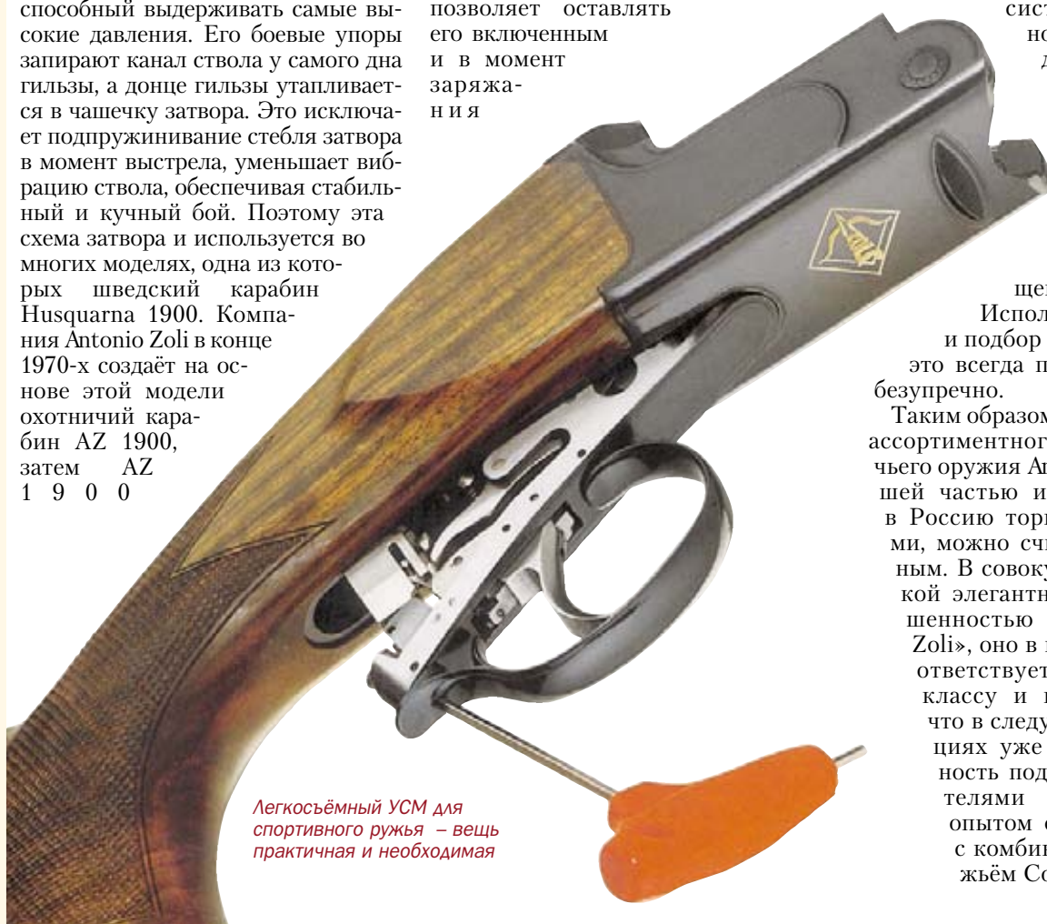
Легкосъёмный УСМ для спортивного ружья – вещь практичная и необходимая