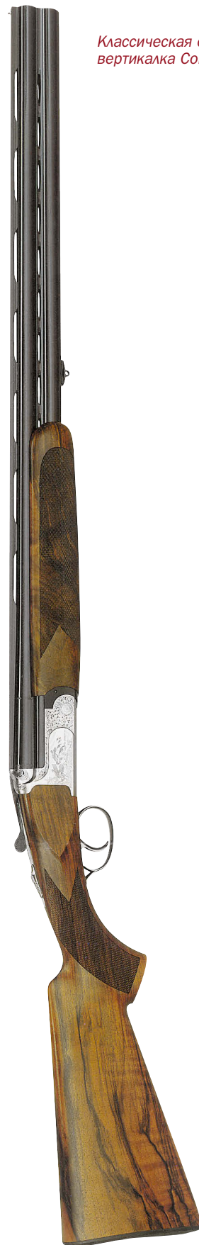
Классическая охотничья вертикалка Columbus

Модель оснащена самой современной и надёжной системой запирания типа «Босс-Вудвард», которая гарантирует безопасность ружья при стрельбе мощными патронами, улучшает эргономику и позволяет осуществить более низкую посадку блока стволов в колодку, делая последнюю компактней и долговечней. Низкая посадка стволов способствует уменьшению сил, направленных на открывание ружья при выстреле, и существенно изменяет характер воспринимаемой стрелком отдачи. Такая колодка при выстреле испытывает меньшие напряжения на разрыв, что позволяет делать её облегчённой, но не менее прочной. Кроме того, компактность колодки улучшает также динамические показатели стрельбы, особенно быстрыми дублетами. Следующая осо-