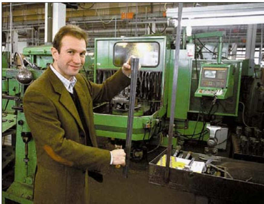
Блоки стволов, собранные мастерами А. Zoli, в руках президента компании звенят как струна лучшего музыкального инструмента