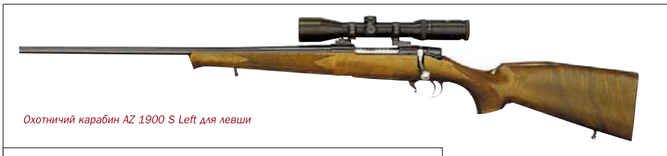
Охотничий карабин AZ 1900 S Left для левши