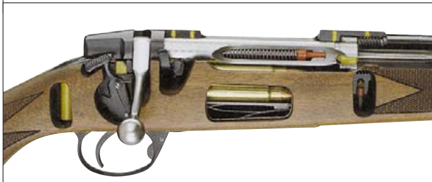
Высокая точность боя, надёжность работы и безотказность делает этот карабин незаменимым инструментом охотника-зверобоя

Серийно изготавливаемая модель Savanne, это оружие под патроны калибра 9,3x74R с длиной стволов 65 см. Тщательная проработка конструкции, изящество форм, надёжность и эффективность позволили этому оружию в кратчайшие сроки стать фаворитом на рынке. Запирание стволов осуществляется на два подствольных крюка по схеме «Перде». УСМ системы «Энсон» со шнеллером на переднем спусковом крючке, эжекторы системы Holland&Holland, масса 3,6 кг.