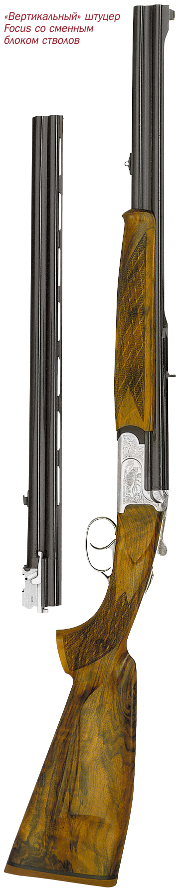
«Вертикальный» штуцер Focus со сменным блоком стволов

бенность – бойки, размещённые в специальных втулках с газосбрасывающими отверстиями. Такое устройство уменьшает вероятность поломки бойка и осечки, особенно в условиях низких температур. Ударно-спусковой механизм ружья съёмный. Он извлекается при отвинчивании винта в задней части скобы ключом из комплекта поставки ружья. Хотя такая фиксация спускового механизма занимает несколько больше времени, чем используемые защёлки других моделей, по соображениям надёжности предпочтение было отдано именно этому способу крепления УСМ.