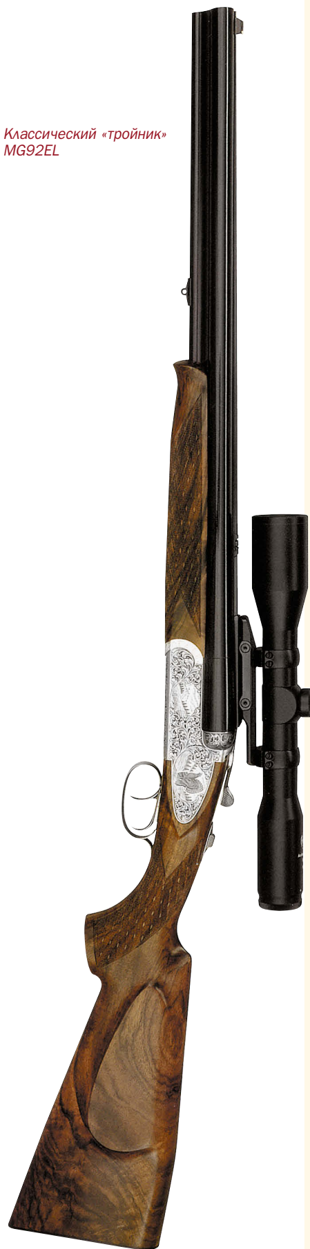
Классический «тройник» MG92EL

Corona – первая модель оружия Antonio Zoli с ручным сжатием боевых пружин, поднявшаяся на высшую ступень безопасности при обращении и стрельбе. Бойки, как и в первых «революционных» моде-